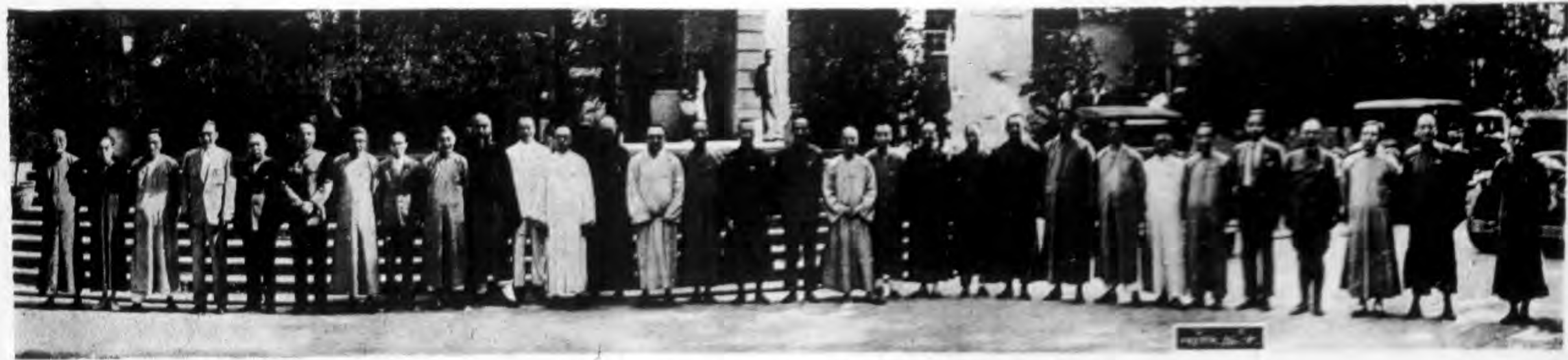
中國國民黨第三屆中央執行委員會第五次全體會議開會式