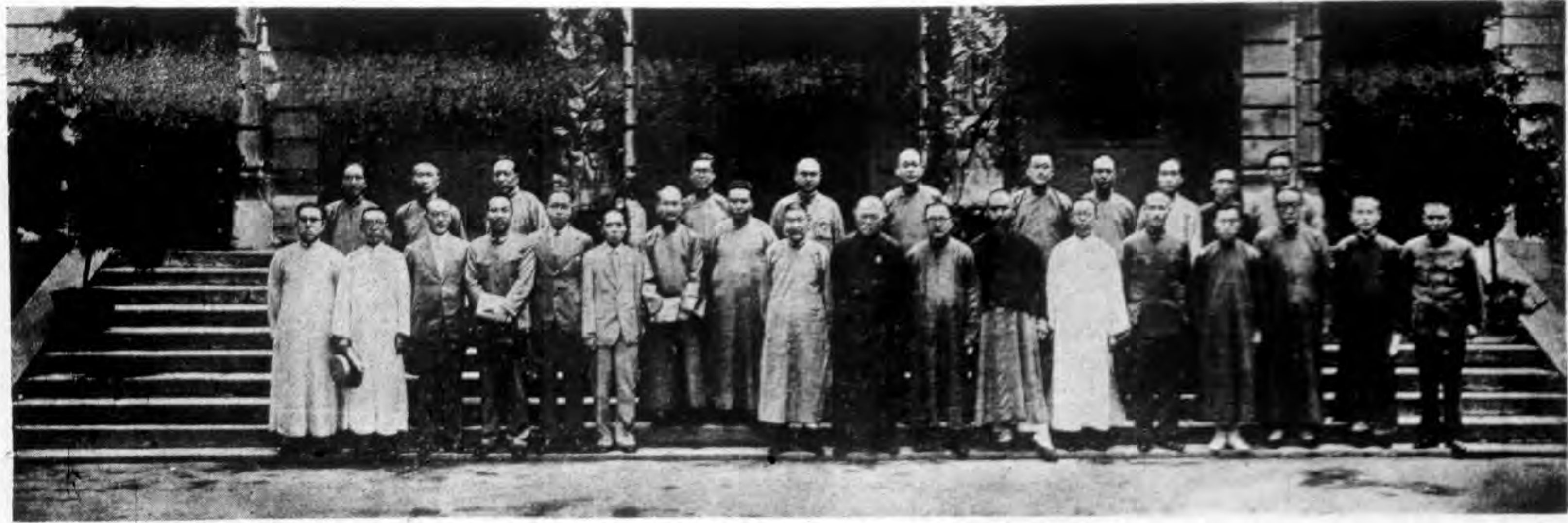
中國國民黨第三屆中央執行委員會第五次全體會議閉會式