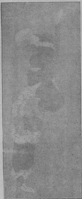
圖 二 第 甲 乙

同胎生處 幼犬三頭， 乙失去其 胸腺，閱一 月之後甲， 犬長大活 潑，乙未仍 幼少不發 育，亦不能 超立與幼 少時無異。 (據醫學 士清水松 茂實驗)