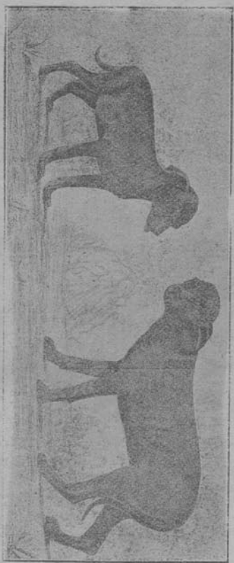
第一後生 同胞之一 兩胞之 異差犬小 圖 (甲) (乙)