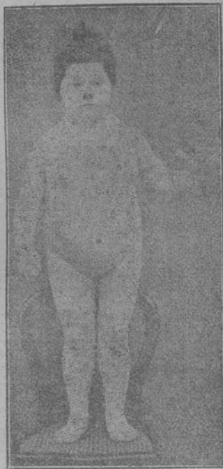
(乙) 同女服用甲狀腺三年半，初時體重，