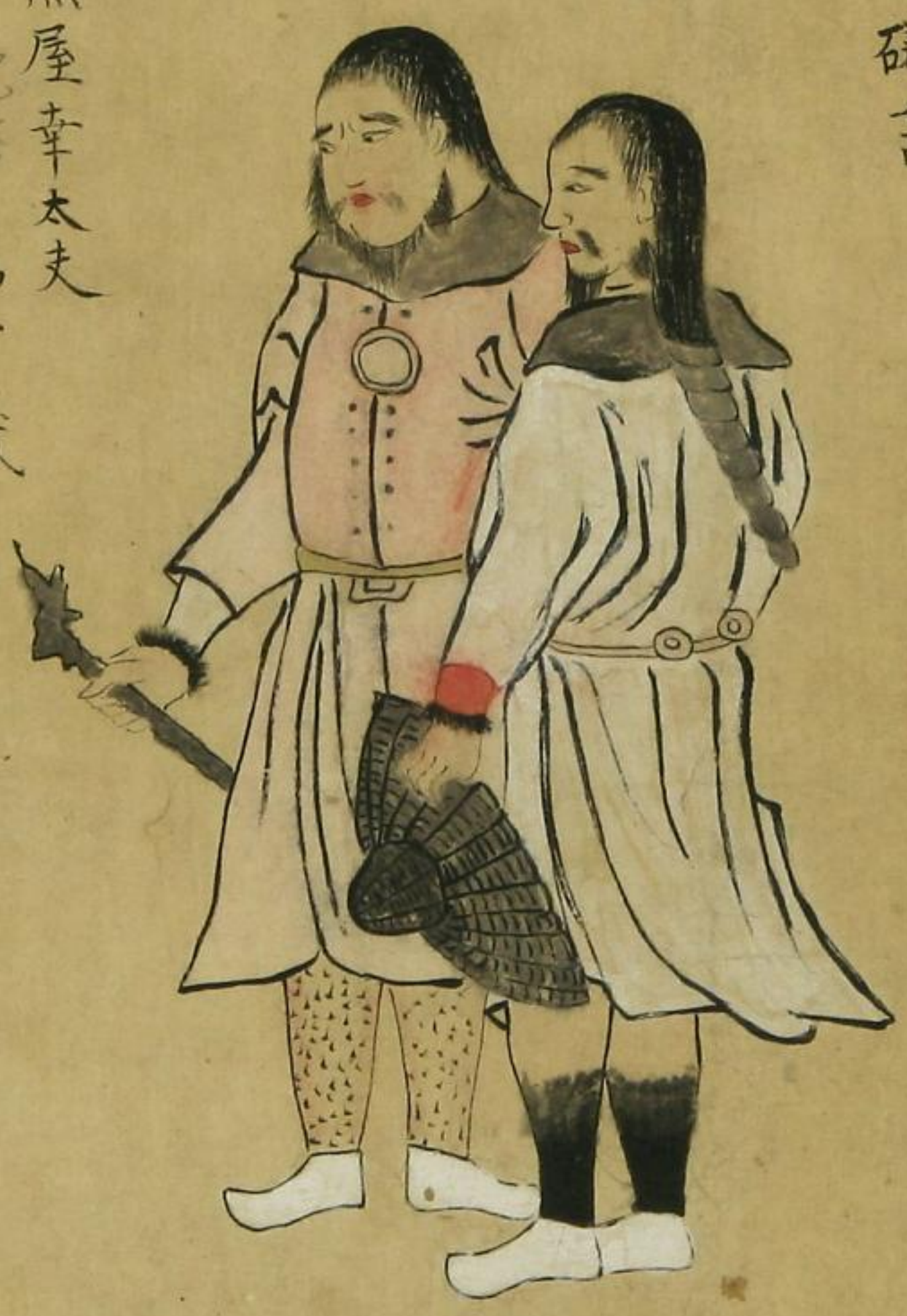
大黒屋 幸太夫 四十二歳