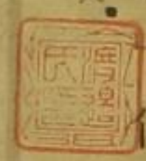
水主磯 十吉 二十八歳

天明二年(一七八三)勢州白子村神昌丸船頭幸大夫(魯國)存スル 文書ノ自署ハ光大夫トアリ水手磯吉等海上難凡ニ遭ヒ時日ヲ經テ露領 亞細亞東岸ニ漂着シ寛政三年(一七九一)魯都彼得堡ニ至リ皇女帝エカテ リナニ謁シ四年其使節ヲラスマンニ護送セラレテ歸国ス 五年九月十 八日大將軍徳川家齊二人ヲ江戸城吹上苑ニ召シテ之ヲ觀育司ヲシテ彼國ノ 事情ヲ問ハシム時ニ幸大夫年四十二磯吉廿八共ニ魯國ノ服裝ヲナス觀者 皆甚々之ヲ奇トス 漂流御覽之記 寛政五年(一七九三)奥州寒風汎濱若宮丸ノ船手十餘人海上難凡ニ 遭ヒ漂流數月翌年露領ニ着シ享和三年(一八〇三)彼得堡ニ至リ津太 夫左平等十人日本服ヲ裝シ國帝アレクサンドル第一世(廿七歲) 皇后エリサベトニ謁ス此時始テ輕氣球ノ飛揚ヲ縱覽ス 翌文 化元年(一八〇四)津太夫等四人魯國使節レサノッフニ半ハレテ歸国 ス 環海異聞 日本人ノ全地球ヲ一周セル者是ヲ始トス