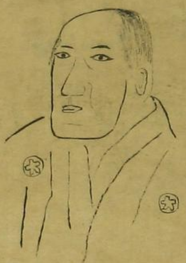
幸大夫 視聽草卷八所載 老年肖像ナルベシ

天明二年(一七八三)勢州白子村神昌丸船頭幸大夫(魯國)存スル 文書ノ自署ハ光大夫トアリ水手磯吉等海上難凡ニ遭ヒ時日ヲ經テ露領 亞細亞東岸ニ漂着シ寛政三年(一七九一)魯都彼得堡ニ至リ皇女帝エカテ リナニ謁シ四年其使節ヲラスマンニ護送セラレテ歸国ス 五年九月十 八日大將軍徳川家齊二人ヲ江戸城吹上苑ニ召シテ之ヲ觀育司ヲシテ彼國ノ 事情ヲ問ハシム時ニ幸大夫年四十二磯吉廿八共ニ魯國ノ服裝ヲナス觀者 皆甚々之ヲ奇トス 漂流御覽之記 寛政五年(一七九三)奥州寒風汎濱若宮丸ノ船手十餘人海上難凡ニ 遭ヒ漂流數月翌年露領ニ着シ享和三年(一八〇三)彼得堡ニ至リ津太 夫左平等十人日本服ヲ裝シ國帝アレクサンドル第一世(廿七歲) 皇后エリサベトニ謁ス此時始テ輕氣球ノ飛揚ヲ縱覽ス 翌文 化元年(一八〇四)津太夫等四人魯國使節レサノッフニ半ハレテ歸国 ス 環海異聞 日本人ノ全地球ヲ一周セル者是ヲ始トス