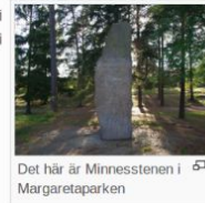
Det här är Minnesstenen i Margaretaparken