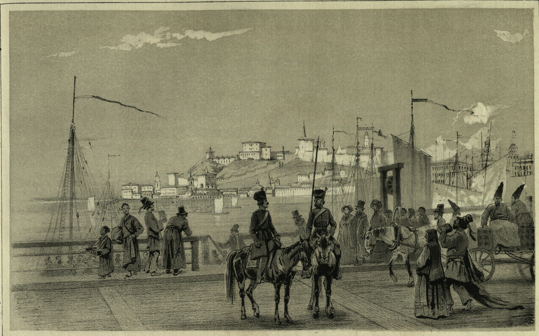
Изъ Альбома Е. И. В. ВЕЛИКАГО КНЯЗЯ МИХАИЛА НИКОЛАЕВИЧА, рисованы съ натуры Г. Рыбинскимъ.