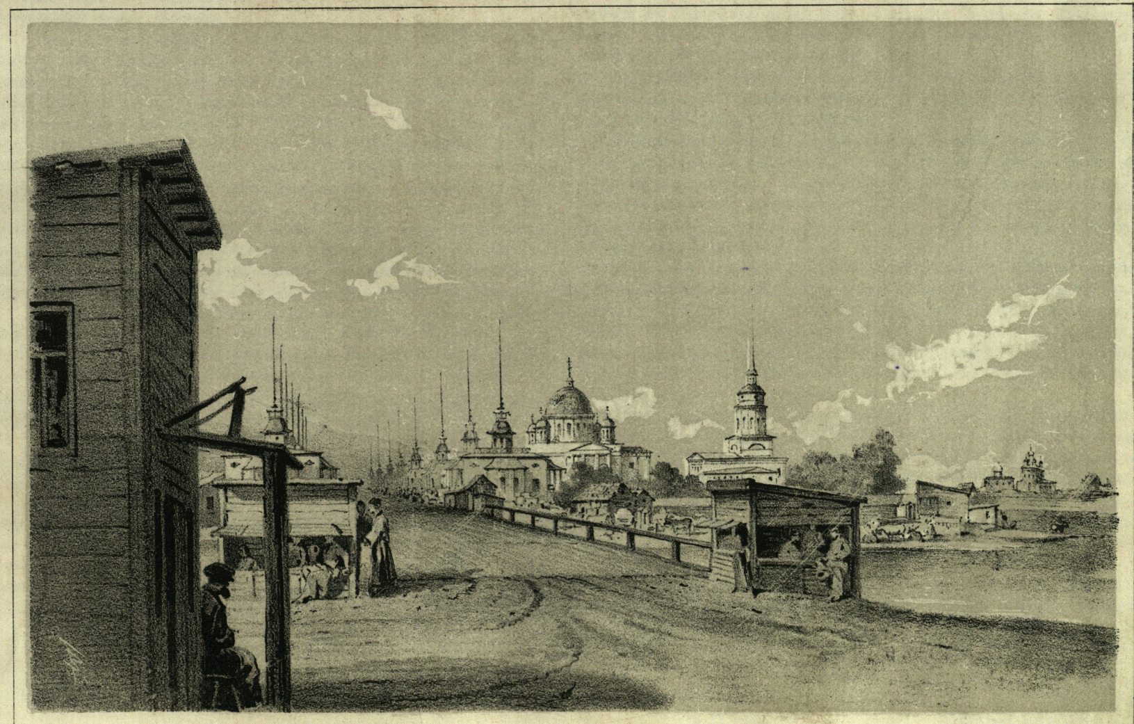
Ярмарочный Соборъ и Китайскіе Ряды въ Нижнемъ-Новгородѣ.