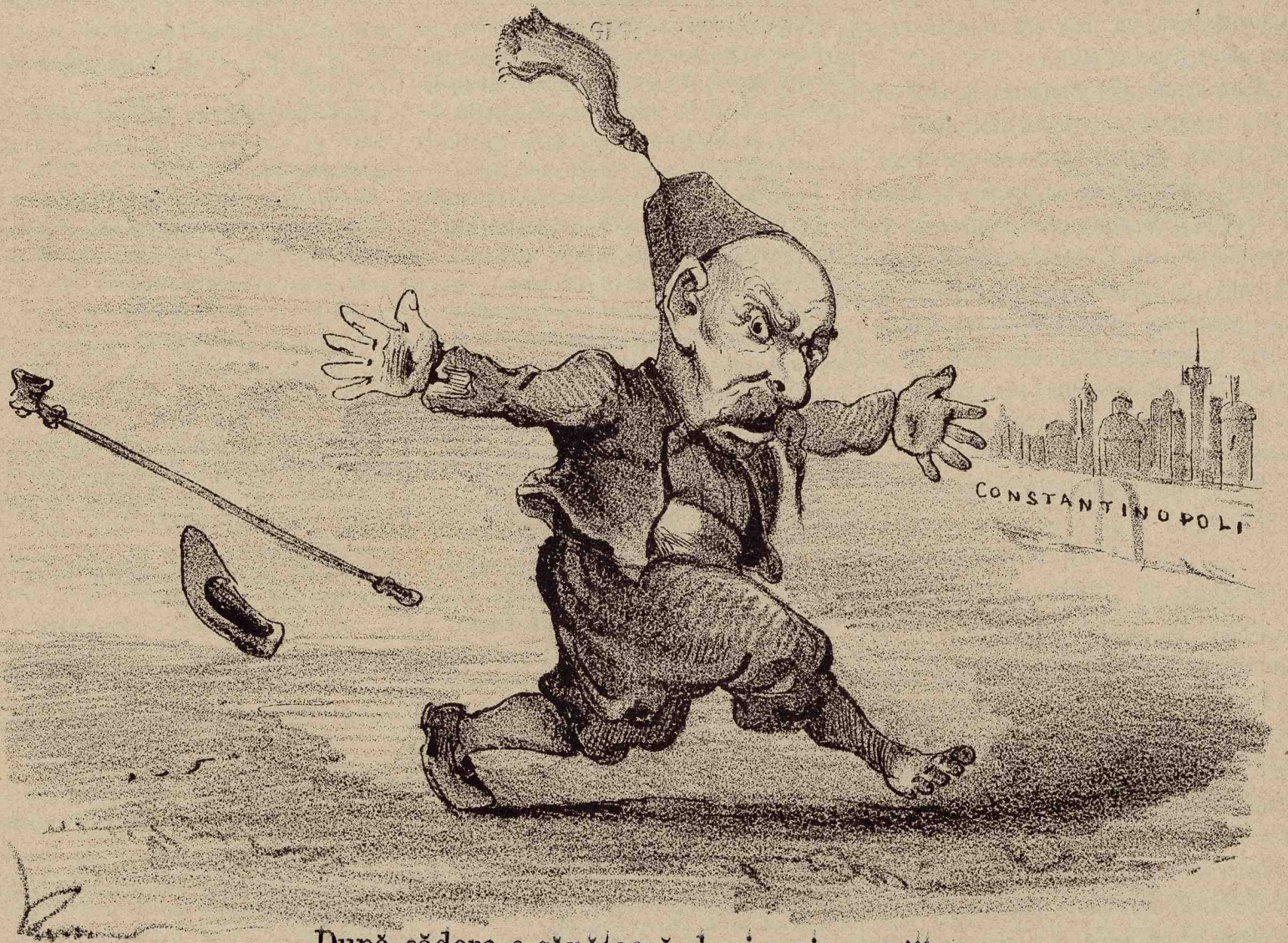
După cădere e sănătoasă de și rușinoasă!!!