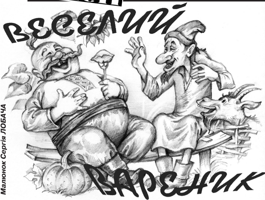
Малюнок Сергія ЛОБАЧА