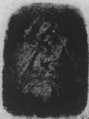
與耶穌聖嬰共享聖母的慈願

6. 諸聖節——包括聖母瞻禮，天神瞻禮，及聖人瞻禮；而聖人瞻禮更分五種，即：宗徒瞻禮，致命瞻禮，精修瞻禮，童貞瞻禮，及聖婦瞻禮。大概宗徒及致命聖人瞻禮用紅色祭服，其餘的，則用白色。