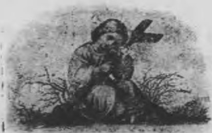
耶穌笑納我的諸般困苦