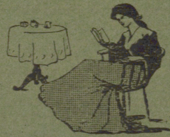
MI ESTAS TRINKINTA LA TEO ESTAS TRINKITA

I am about to drink The tea is about to be drunk I am drinking The tea is being drunk I have drunk The tea has been drunk