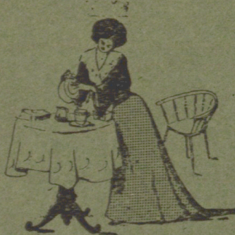
MI ESTAS TRINKONTA LA TEO ESTAS TRINKOTA

ACTIVE PASSIVE ACTIVE PASSIVE ACTIVE PASSIVE TRINKONTA TRINKOTA TRINKANTA TRINKATA TRINKINTA TRINKITA