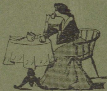
MI ESTAS TRINKANTA LA TEO ESTAS TRINKATA