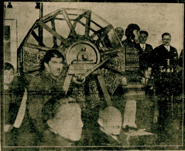
Tayyare piyanosunun ikinci keşidesi dün yapılmıştı. Bermutat bir çok meraklılar keşide salonuna gelerek heyecanlı dakikalar geçirmişlerdir.