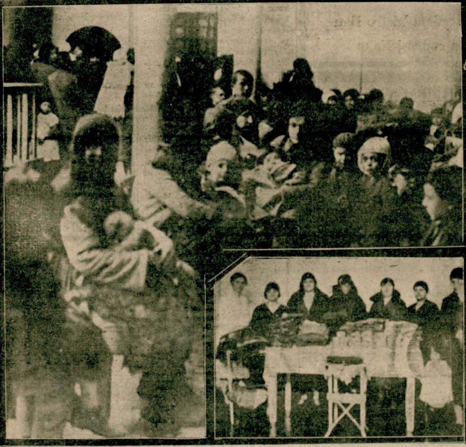
Süt Damlası dün küçük yavrulara giyecek elbise ve yiyecek erzak tevzi etmiştir. Resmimiz küçük yavrucağlar ile tevzi hey'etini gösteriyor.

Deniz kuvvetleri ihtiyacı için balada mikrarî telefon teli kapalı zarfla münakasaya konmuştur. Şartnamesini görmek isteyenlerin her gün itasına talip bulunmalarını da yukarıda yazılı gün ve saatta Kasımpaşa'da Deniz mübayaat komisyonuna müraaatları.