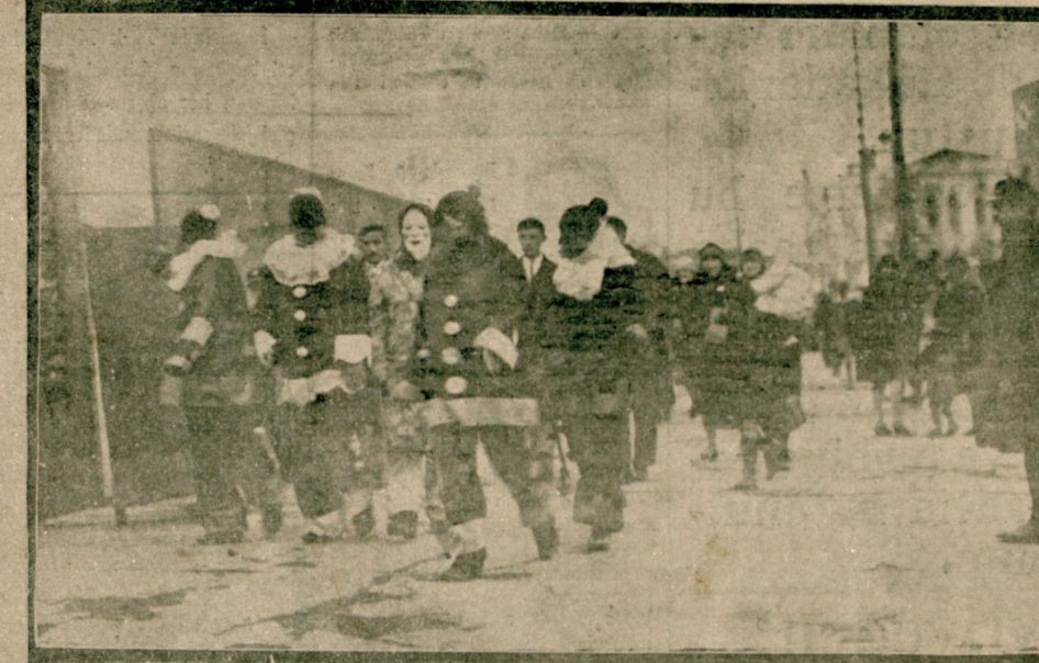
Paskalyanın yaklaşması münasebetile ortada maskaralar çoğalmıştır. Zabıtai Belediye memurları sokakta teşkil ettikleri maskaralara vesika sormaktadırlar.