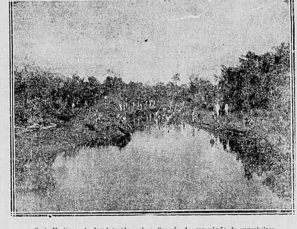
O rio Merity sendo desobstruido, sob a direcção da comissáo de engenheiros

Mol. de seborrhea e erupçáo púrpura. Consultas ás 10 horas, na igreja de S. Antonio.