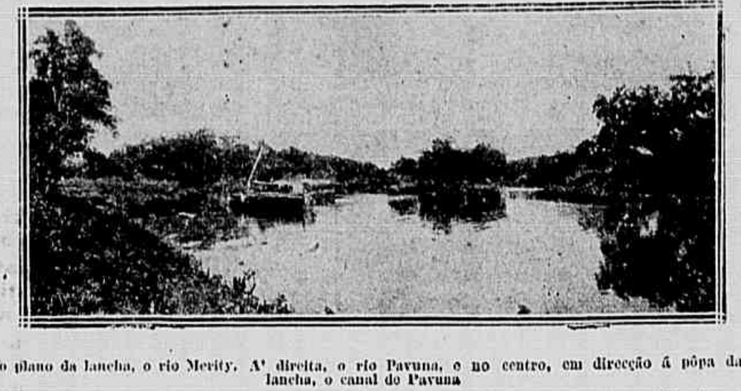
No plano da lancha, o rio Merity. A' direita, o rio Pavuna, e no centro, em direcção á pópa da lancha, o canal do Pavuna