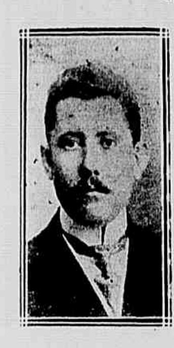
Senador Nilo Peçanha, candidato governista