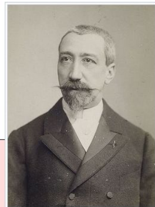
Anatole France, ca 1880