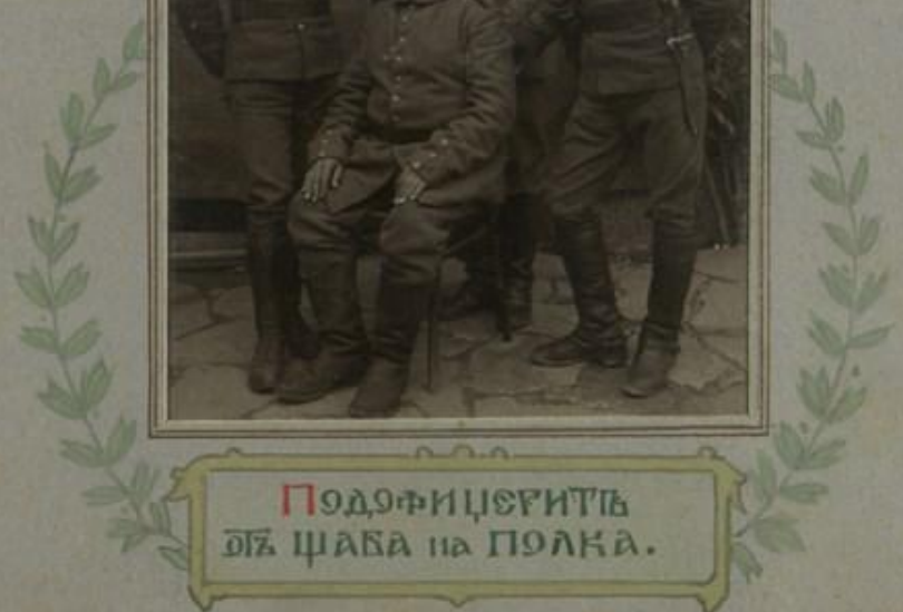
ПОДОФИЦЕРИТЪ СЪ ЩАБА НА ПОЛКА.