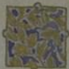
Подпоручикъ отъ III дружина.