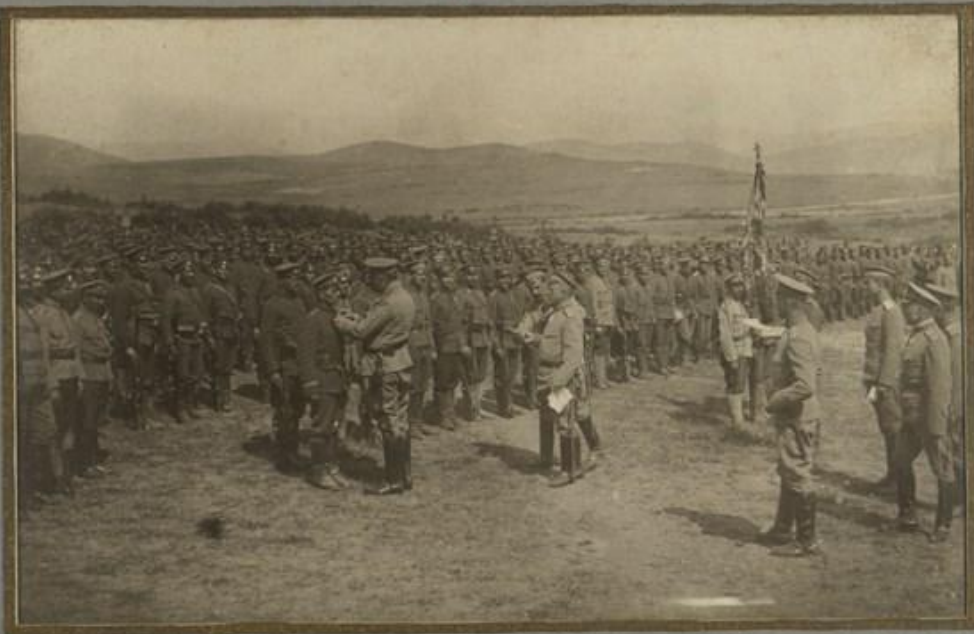
ВЪЗДАВАНЕ ОРДЕНИ ЗА ХРАБРОСТЪ НА ОФИЦЕРИ И ВОЙНИЦИ ОТ ПОЛКА, ПРИ ГР. ГЕВГЕЛИИ НА 24-ти Май-1916г.