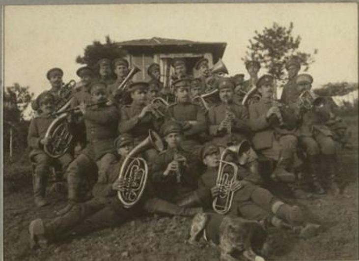
МУЗИКАНТСКА КОМАНДА НА ПОЛКА