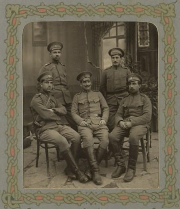
Младшиятъ офицери въ I ю дружина на полка.