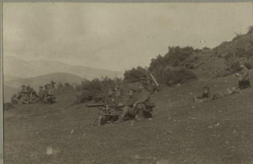
КАРТСЧНИЦИ НА ПОЗИЦИЯ.