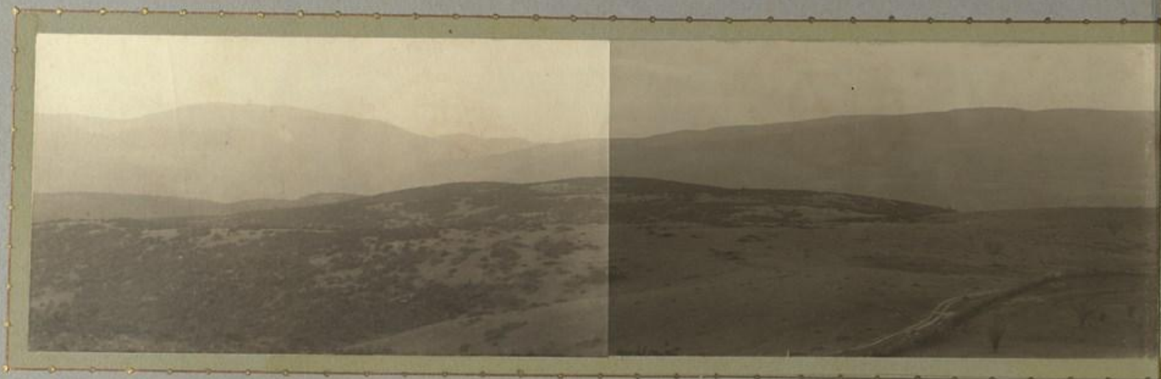
Позицията Дупина по дънония бригада на В. Българска Моравя ( Сърбия ). Атакувана и пръветата от пoлaкa на 22 ю Октомври 1915 .