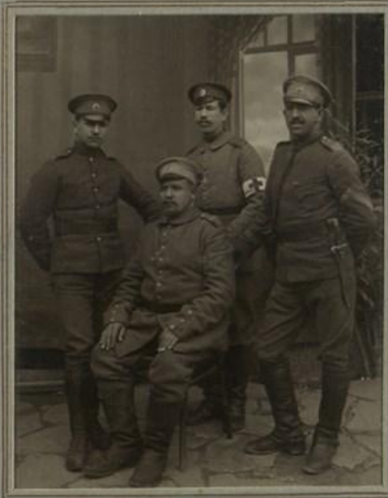
ПОДОФИЦЕРИТЪ СЪ НЕСТРОСВАТЪ РОЛЪ НА ПОЛКА.