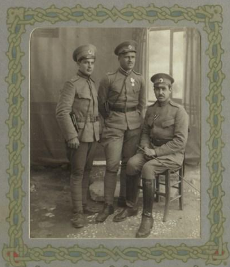
Младшиятъ офицери съ IV дружина