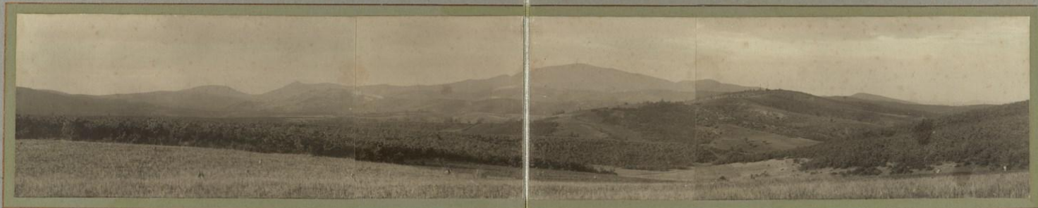
Позицията на ПОАКА ПРИ ГР. ГОБЪГАЛИИ ВЪЗ ПО- ЗИЦИОННАТА ВОИНА СРЪБИИ ФРАНЦУЗИ И ТЪРЦИ ОАКЪДА 29 и НОСЕМВРИИ 1915 Г.ОД.