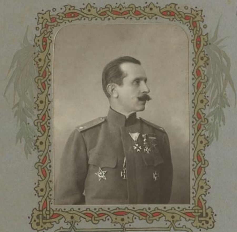
ГЕНЕРАЛ-ЛЕЙТЕНАНТЪ ЖИКОВЪ НИКОЛА ГЛАВНОКОМАНДУЮЩЪ НА БЪЛГАРСКАТА АРМИЯ.