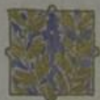
Подпоручикъ отъ IV дружина.