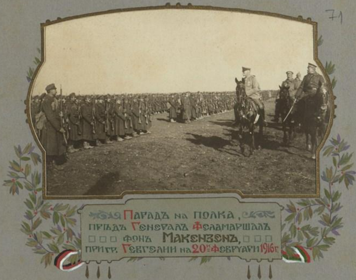
ПАРАДА НА ПОЛКА, ПРИДАТЪ ГЕНЕРАЛЪ ФЕЛДМАРШАЛЪ □□□ ФОНЪ МАКЕНЗЕНЪ, □□□ ПРИ ГР. ГЕВГЕАНИ НА 20 ТЕ ФЕВРУАРИ 1916Г.