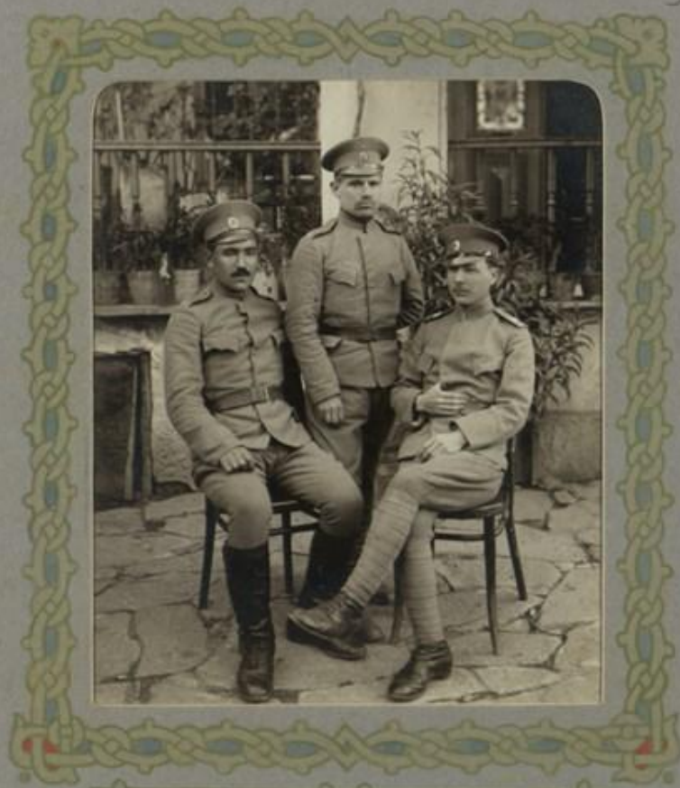
Младшиятъ офицери съ III дружина