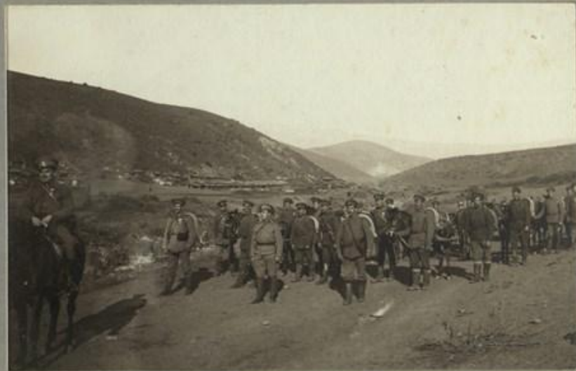
КАРТСЧНИЦИ ВЪ ПОХОДАЪ.