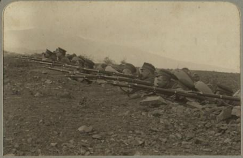
На война позиция.