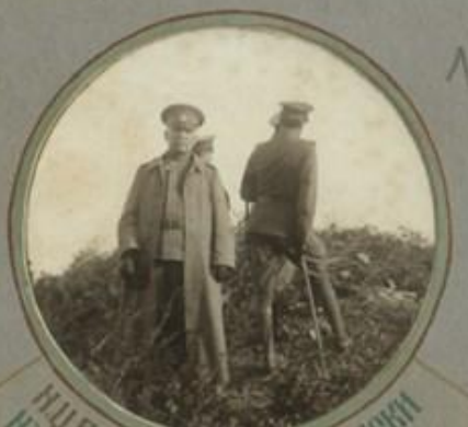
И Ц. В. КИРНАЗЪ КН. ПРЪСЛАВСКИ НА ОБЩИНТА ПРИ ГР. ГЕРТЕЛИН.