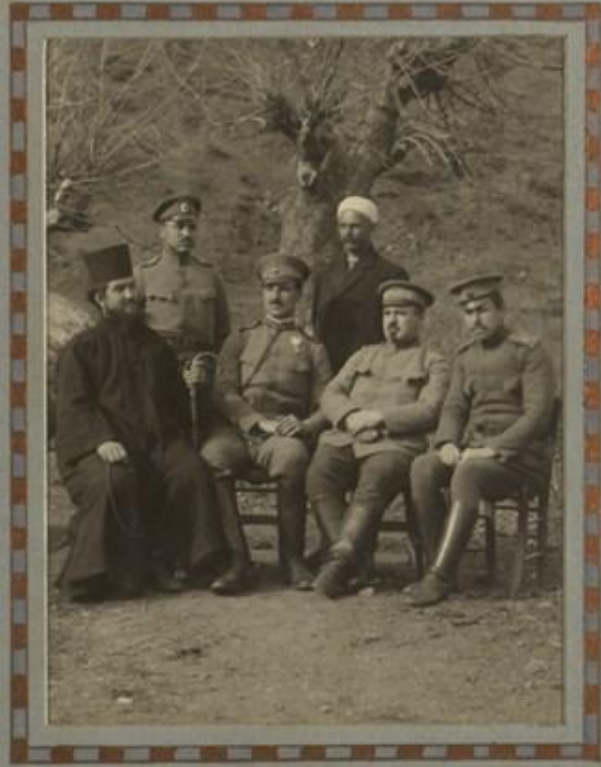
ОФИЦЕРИ И ЧИНОВНИЦИ ОТЪ ИСТОРИЧЕСКАТА РЪГА НА ПОЛКА.