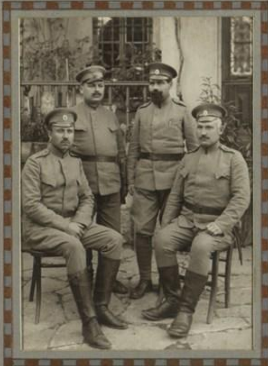
МЛАДШИТЕ ЛЮКАРИ ОТЪ ПОЛКА.