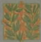
Подофицеріиъ отъ II дружины.