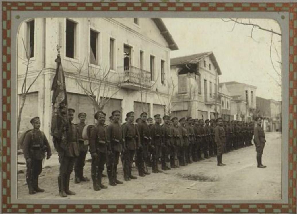
ПОЧЕТНАЪ ВЪВОДА СЪ ЗНАМЕТО НА ПОЛКА.