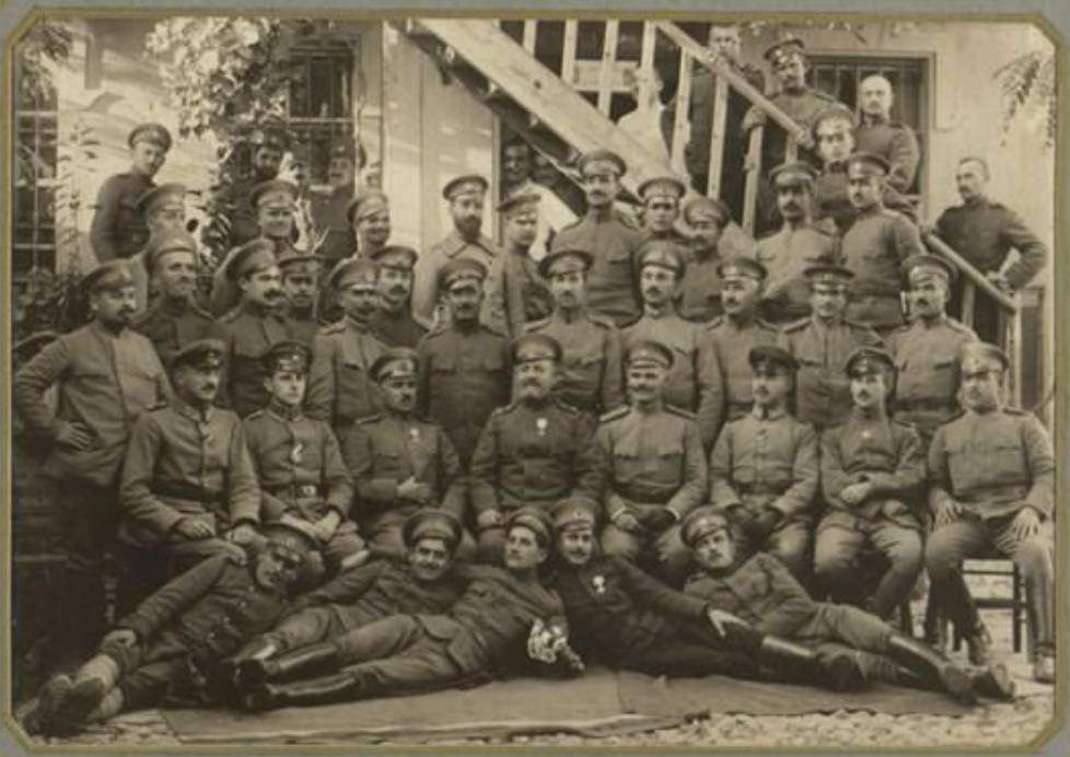
ГРУПА ОФИЦЕРИ, ПО СЛУЧАЙ БОЙНИЯТЪ ПРАЗНИКЪ НА ПОЛКА. 2 И НОЯМВРИИ 1916Г.