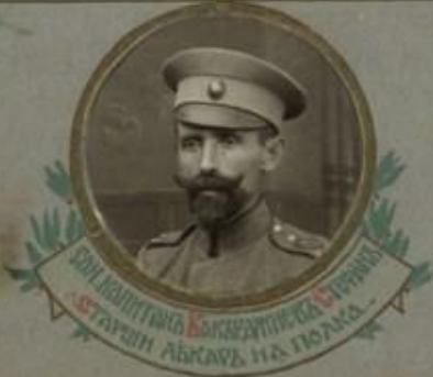
СЪН. ПОЛКОВНИКЪТЪ БЪЛГАРИНСКО-СЕРБИИ СТАРИН ЛЮКАРЪ НА ПОЛКА