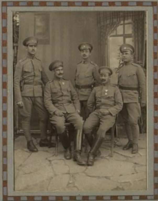
ОФИЦЕРИ ОТЪ ЦАБА НА ПОЛКА