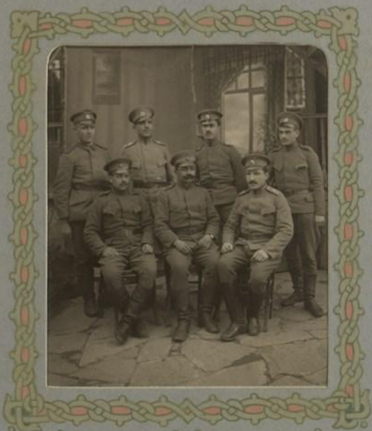
Младшиятъ офицери въ II ю дружина.