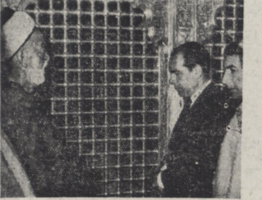
آقای دکتر فاطمی و هیئت نمایندگی ایران در خلال اقامت در عراق بپرات انتخاب مقدمه نائل گردیدند . عکس بالای وزیر خارجه را در حرم مطهر نجف اشرف هنگام زیارت نشان میدهد

قبل از اینکه دنیاه یادداشتی مسافرت تاریخی خود را در ابراق بناسبت شرکت در مراسم نایبگذاری اعلیحضرت ملک فیصل دوم در چند شماره دیگر انتشار دهم لازم میدانم در اولین فرصت بازگشت خود از حسن پذیرائی و ابراز محبت و مهری که از طرف دولت و ملت عراق نسبت بهبیت نمایندگی ایران مبدول گردید و صمیمانه تشکر کنم و بقیه دوام در این سیاستگذاری سایر همراهان گرامی نیز شرکت دارند . مسافرت دو هفته هیئت نمایندگی ایران در عراق با منتهای صمیمیت و دوستی و علاقتندی انجام گرفت، همه جا بقیه در صحنه پنجم