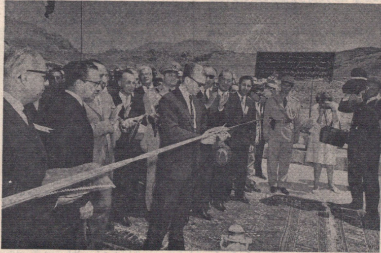
۲۵ تیر ۱۳۴۲ - شاهنشاه در مراسم افتتاح راه تازه تهران - آمل فرمودند: همه چیز تحت‌الشعاع انقلاب بزرگی است که ما شروع کرده‌ایم.