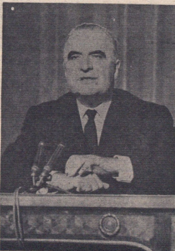
حضرت ژرژ پمپیدو

آقای و.س. بوم گارتر وزیر سابق - عضو «انستیتو دو فرانس» و رئیس «آلیانس فرانسه» پروفور روبر دزره عضو آکادمی بزرگ فرانسه آقای ژرژ. دوپروسون رئیس او.ا.ر.ت.ا.