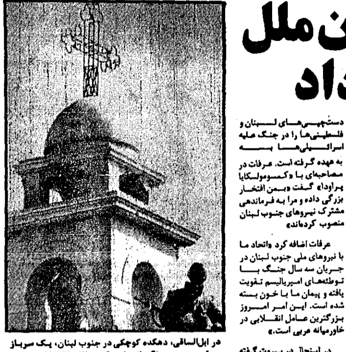
در ایل اسالی، دهکده کوچکی در جنوب لبنان، یک سرباز سوئدی در پشت نگهبانی خود که بر بالای کلیسا است دیده می‌شود.