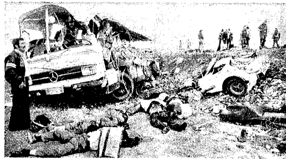
تاکر نفتکش پس از برخورد با اتوبوس مسافربری برخورد آن را هم به آه پاره تبدیل کرد.

در برخورد تاکر نفتکش و اتوبوس مسافربری و پیکان در جاده قزوین، ۲۶ نفر کشته و ۱۸ نفر مجروح شدند. این حادثه ساعت ۵ پیکان در جاده قزوین، ساعت ۵ با میدان اسرود ۳۳ نفر کشته و ۱۸ نفر مجروح شدند.