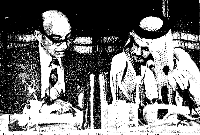
معمود ریاض، دبیر کل جامعه عرب و امیر سعود الفیصل، وزیر خارجه عربستان سعودی در جلسه افتتاحیه کنفرانس وزیران عرب دیده می شوند.