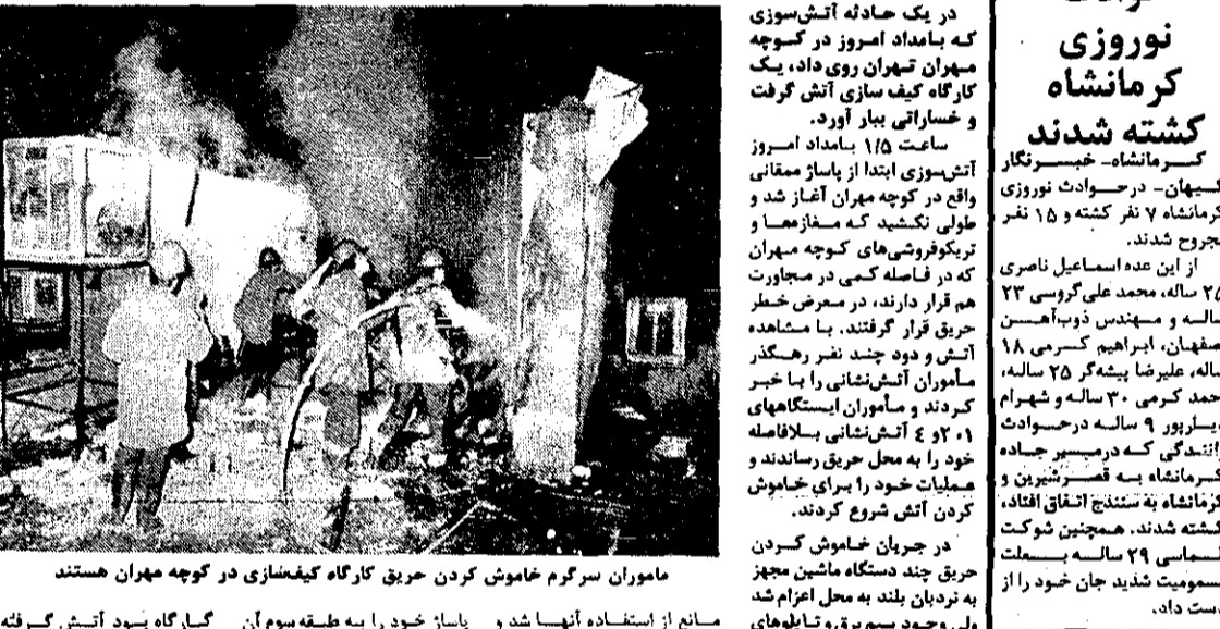
مأموران سرگرم خاموش کردن حریق کارگاه کیف‌سازی در کوچه مهران هستند

اصفهان- خبرنگار کیهان- یک کارگاه کیف‌سازی در کوچه مهران اصفهان به آتش گرفت. حریق در این کارگاه در ساعت ۱۱:۵۵ صبح آغاز شد و مأموران آتش‌نشانی در ساعت ۱۲:۰۵ به محل رسیدند.