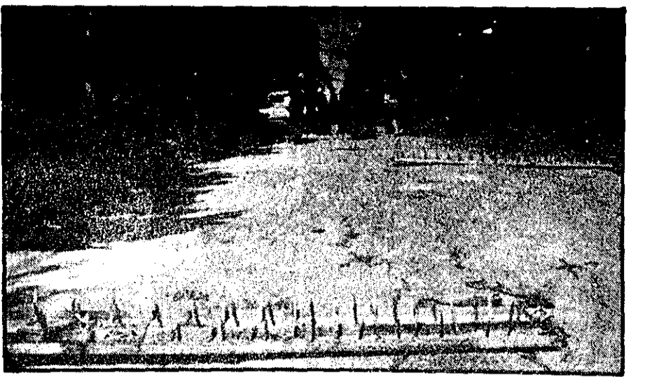
نیروهای سازمان ملل متحد در جنوب لبنان موانعی در جادای ایجاد کرده‌اند و جلو اتومبیلها را می‌گیرند و بازرسی می‌کنند.

کارتر و رئیس جمهوری آمریکا در این باره مذاکره کردند. کارتر و رئیس جمهوری آمریکا در این باره مذاکره کردند.