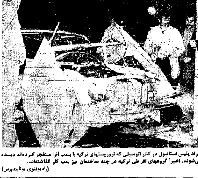
افراد پلیس استانبول در کنار اتومبیلی که در ترور پستیهای ترکیه با بمب آنرا منفجر کرده اند دیده می شوند.