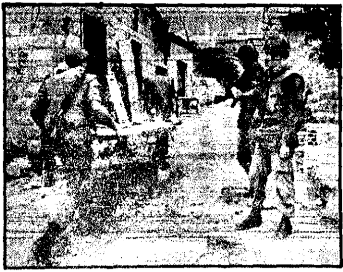
واحدهای سوئدی در دهکده ایل اسالی در خانهای را که از جا کنده شده است حمل می‌کنند و دو سرباز دیگر آنها را نگاه می‌کنند.

وزیر خارجه انبوی چند روز قبل آمریکا را متهم کرده بود که دان اسلمه به سومالی و نادیده گرفتن نقشه‌های سومالی لصد دارد حبشیوتی را امریک بشفاف نقره تقدیم سومالی کند.