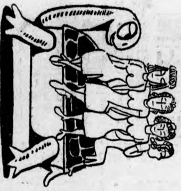
待遇「」：咱們慢慢的改善 一三三等三組，該業主為組長。 一滬警局准妓女組織濟勝利團體，令分