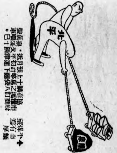
望煤平市麵 寫有厚