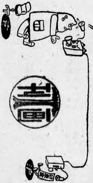
大亨們，小打擊。 京惠察用長途電話報告美金 市行情。