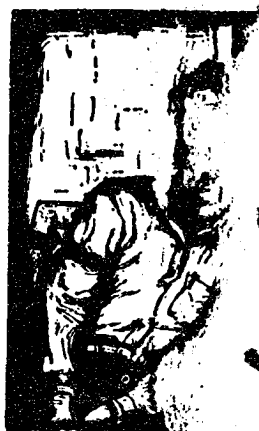
（ 屋 印 行 ）