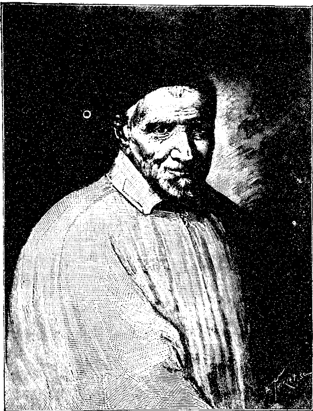
創立遣使會首聖味增爵