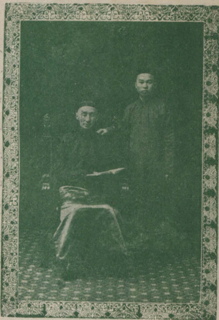
也 人 僕 者 立 秋 涵 者 坐