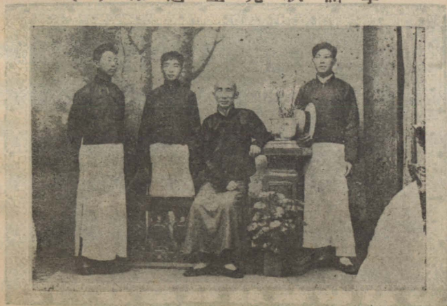
坐 者 涵 秋 立 者 其 弟 子 也