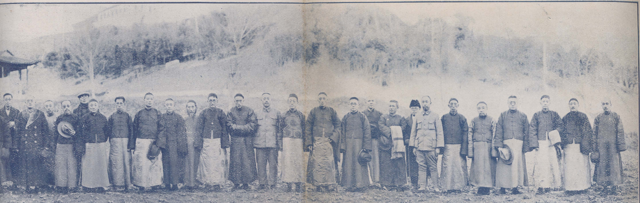
監務討論會全體員攝影