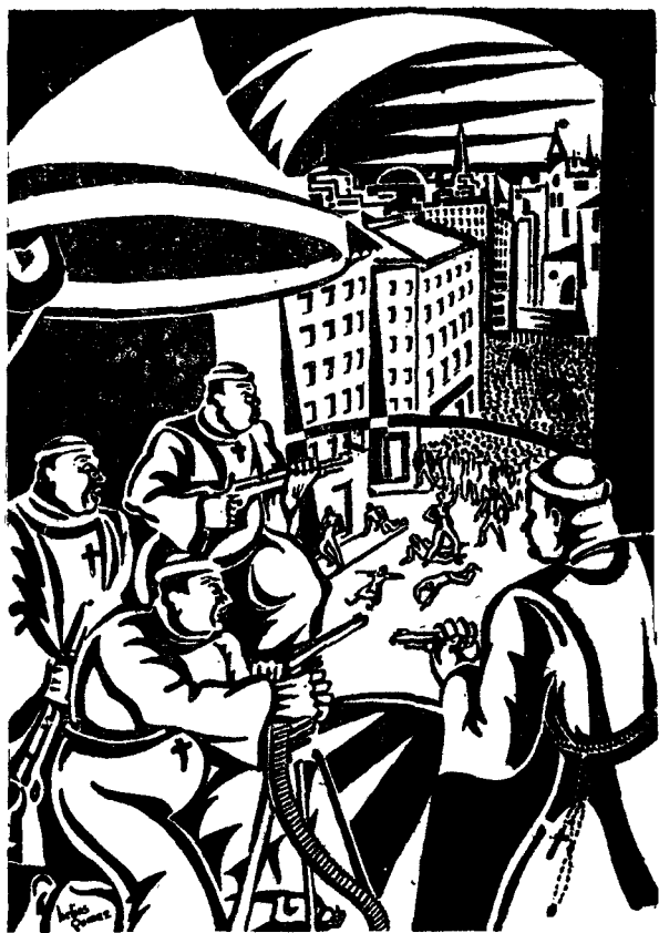
(三) 曲序的命革 人工射掃槍關機用士教