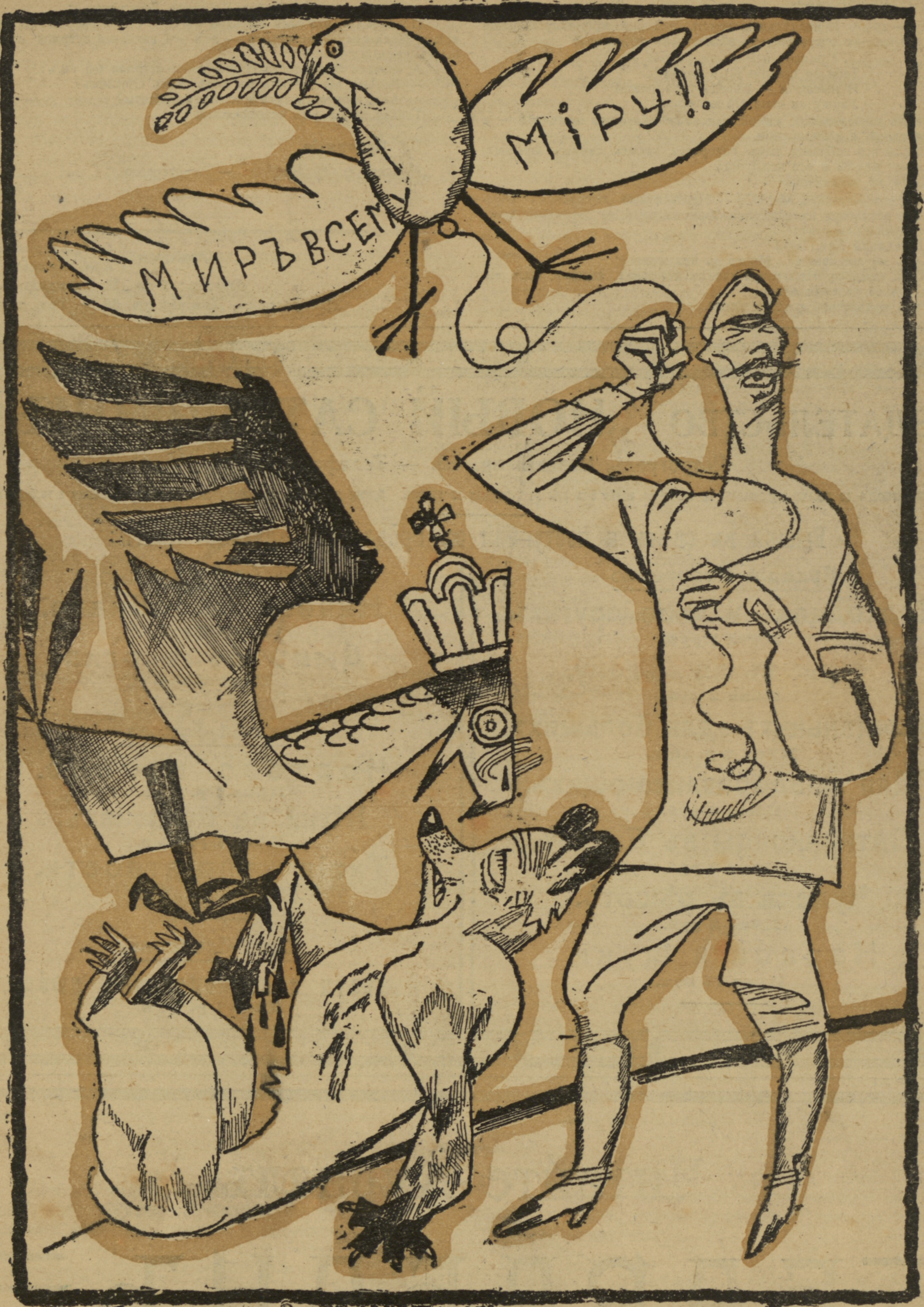
Рис. А. Радакова.