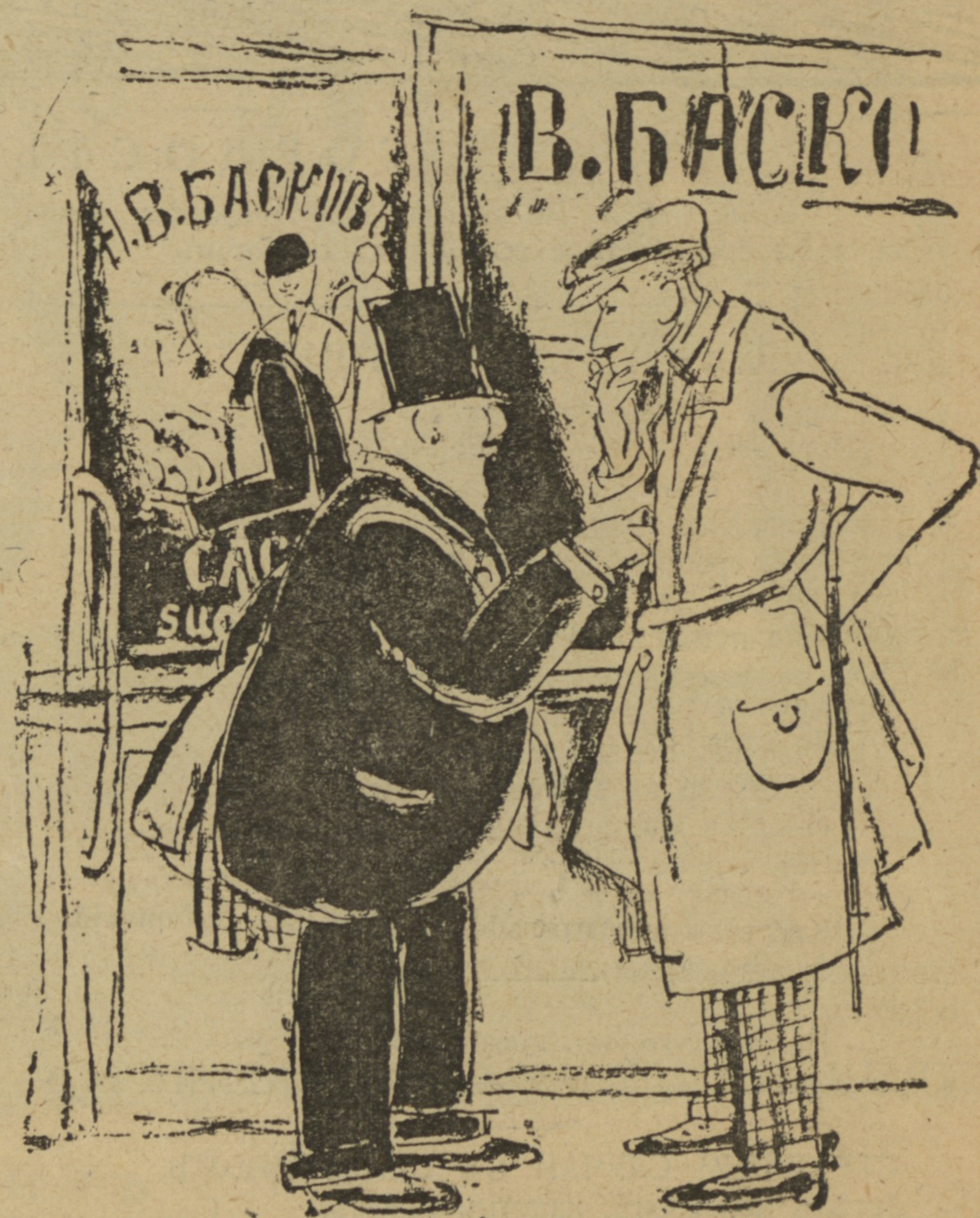
Рис. К. Богуславской.