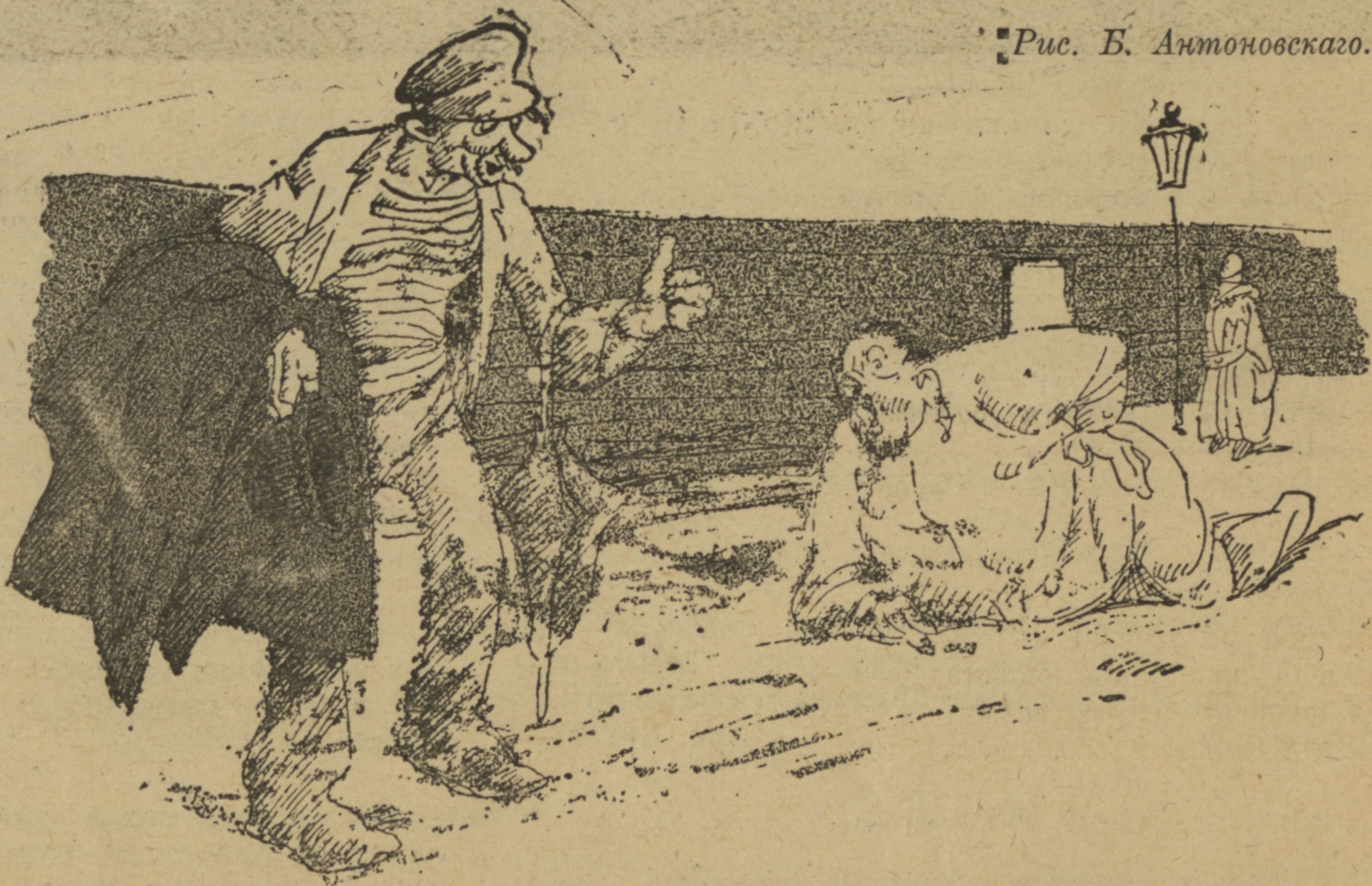
Рис. Б. Антоновскаго.

Черезъ полчаса донъ Діего Санта-Роза-Пиччикатто Тубероза стоялъ передъ большимъ котломъ въ одномъ изъ