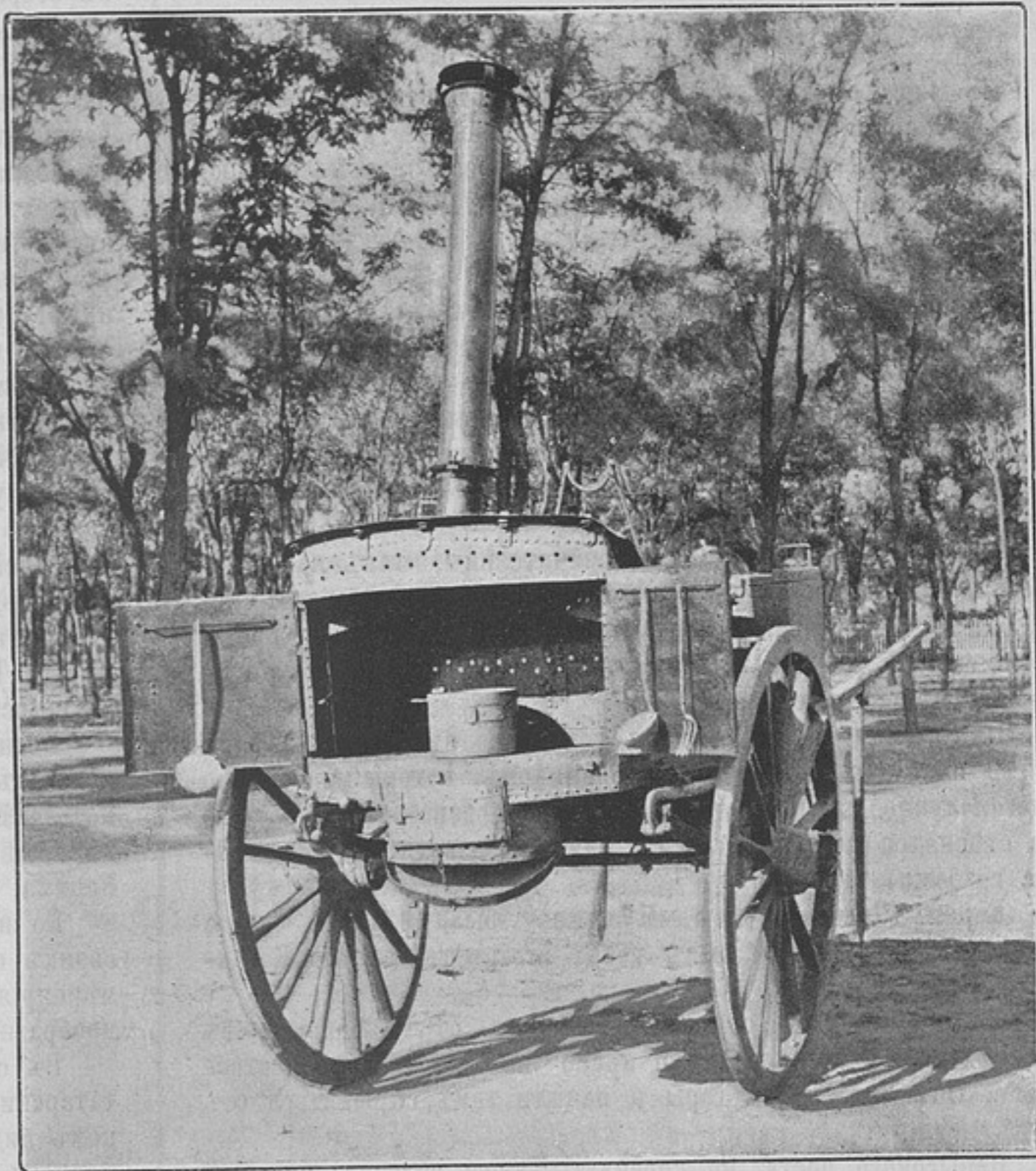
Походная офицерская кухня-двуколка системы М. Мерцалова. Видъ сзади, съ открытой плитой, лѣвой духовкой и опущеннымъ поддуваломъ.

Вышеописанная кухня какъ первый образецъ дала прек-