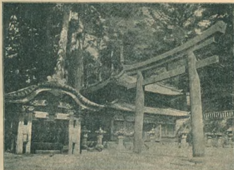
Храмовыя ворота въ Никко.

Въ отношеніи вѣшной политики Японіи, до самаго послѣдняго времени, предшествовашаго великой японской революціи, придерживалась политики своего единокроннаго сосѣда—Китаю. Она упорно старалась изолировать отъ всякихъ вѣншихъ вторженій и европейцамъ только съ величайшимъ трудомъ удалось добиться самыхъ ограниченныхъ торговыхъ правъ. Въ то время, какъ въ Европѣ открытія новѣйшей науки произвели полный экономическій переворотъ, навсегда оторвавшій ее отъ средневѣковыхъ пережитковъ, Японія косяла еще въ тискахъ своего феодальнаго строя, чуждая всякаго новыя пріобрѣтенія челоѣческаго разума. Ея самуранъ, въ началѣ шестидесятыхъ годовъ