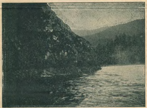
Рис 6. Скалы близъ устья Золотой.

Между артистами встрѣчаются безусловно крупныя драматическія таланты. Женщины начали допускать на сцену только въ самое послѣднее время: да и то далеко не во всѣхъ театрахъ. Представленія продолжаются почти цѣлый день, съ утра до вечера, а самые театры, за исключеніемъ одного, самаго новаго, далеко не блещутъ обстановкой.