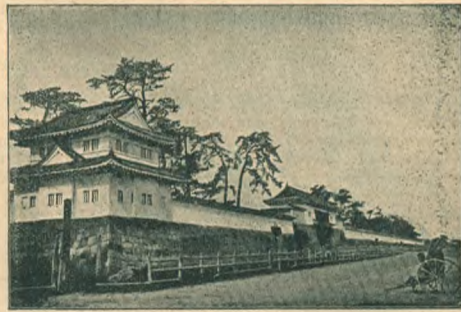
Императорский дворец в Киото.

Всегда за переводами явились подражания.