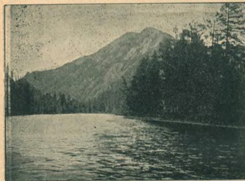
Рис 5. Долина р. Уса

вать изъ камня такую тонкую пластинку, чтобы она была прозрачна, послѣ чего только и можно ее разсматривать подъ микроскопомъ. Для того, чтобы получить такую пластинку, берутъ обломокъ камня величиной съ крупный лещинный орѣхъ и приставляютъ къ поверхности вращающагося шлифовальнаго камня; треніемъ снимается гѣлый бокъ обломка, въ рукахъ остается только половина его. На обломкѣ получается отшлифованная поверхность, диаметръ которой равняется диаметру обломка. Затѣмъ этой отшлифованной поверхностью обломокъ посредствомъ копейскаго бальзама прикрѣпляется къ одному изъ такъ называемыхъ предметныхъ стеклышекъ, какіе употребляются при микроскопахъ. Когда бальзамъ остынетъ, когда убѣдится, что камешекъ прочно сидитъ на стеклышкѣ, его снова приставляютъ къ вращающемуся шлифовальному камню, держа такъ, чтобы стеклышко было параллельно поверхности шлифовальнаго камня и этимъ продолженіемъ шлифованія снимаютъ другой бокъ камешка до тѣхъ поръ, пока на стеклышкѣ не останется самый тонкій слой камня въ четыре или пять сотыхъ миллиметра толщиной. Получается тонкая пластинка, пропускающая свѣтъ. Если положить ее подъ микроскопъ, то можно будетъ видѣть мельчайшіе кристаллики въ составѣ камня, кото-