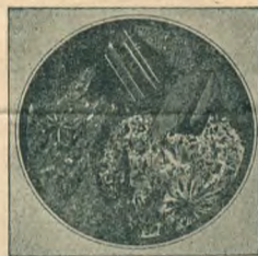
Коргонскій вариолитовый порфиръ.

разная стойки ( бабки ) для носовой и кормовой гребей (большое навѣсное весло). Въ виду того, что плотъ заливается на порогахъ водою, на среднемъ его, нѣсколько ближе къ кормовому концу, устраивается помостъ ( баллаганъ ) на клѣткѣ изъ тонкихъ бревенъ; на этомъ возвышеніи въ 1½ арш. высоты, крѣпо прибитымъ веревками къ плоту, чтобъ его не снесло, помещается товаръ и имеющиеся пассажиры. Въ скрѣпленіи должны быть вполнѣ надежны. Плотъ приведенныхъ выше размѣровъ выносить нагрузку 300—400 пудовъ, а съ натяжкой и того больше. Въ виду возможности аварий на порогахъ плотъ поручается опытнымъ лодчанамъ, хорошо знающимъ „ходъ“ на порогахъ; въ числѣ лучшихъ лодочниковъ считаются Дм. Ил. Ивановъ—почтарь, Викентій Шумухинъ (Мухитъ)—присыльный лодчанъ, Окей Масловъ, Ник. Фед. Казанцевъ, Степ. Дм. Шепелевъ и др. Къ этому остается прибавить, что для плаванія по верхнему порожистому Енисею никакая иная посудина, кроме плота, не годится; въ лодкахъ можно ѣхать въ тихихъ частяхъ рѣки, но на Большомъ порогѣ—не мыслимо.