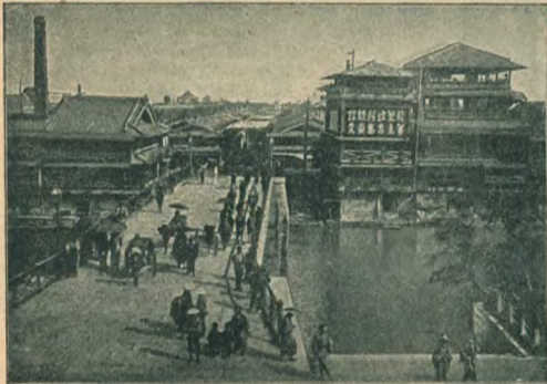
Іебиссо, предместье Осаки.

4 ноября 1873 года народъ получилъ конституцію, переработанную и расширенную 11 февраля 1889 года. По этой послѣдней кон-