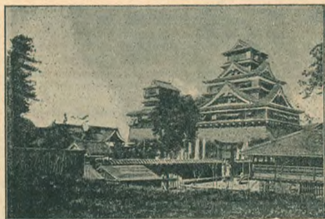
Замок даймюса в Кумамото.

ституции японской парламент состоит из верхней палаты пэров, к которой принадлежат все мужские члены императорской фамилии, все принцы и маркизы старше 25 лет и атэма — пятая часть всех, имеющих свыше 25 лет графов, виконтов и баронов. Нижняя палата выборных представителей состоит из трехсот депутатов, имеющих не менее тридцати лет от роду и избираемых на четыре года, причем в голосовании принимают участие все мужчины, не моложе 25 лет, платящие налоги в казну в сумме не менее 10 иен. Женщины никакими политическими правами не пользуются.