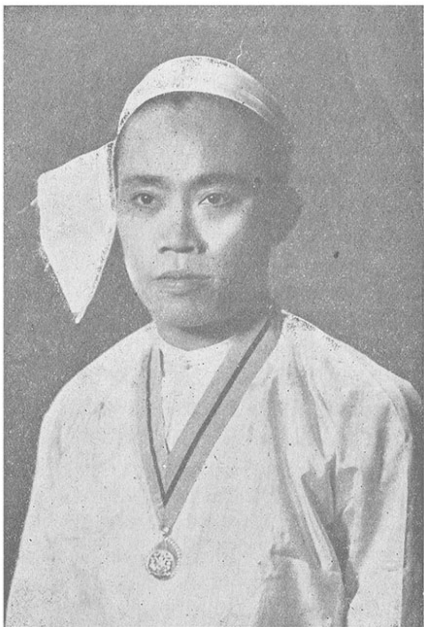
အလင်္ကာကျော်စွာ ရွှေမန်းတင်မောင်