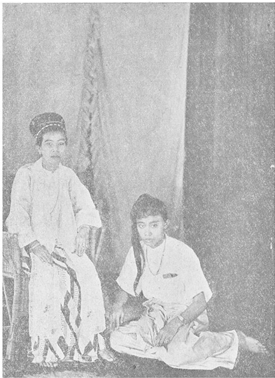
မြခင်ချင်း - ဇာတ်ထွေပြိုင်နှင့်