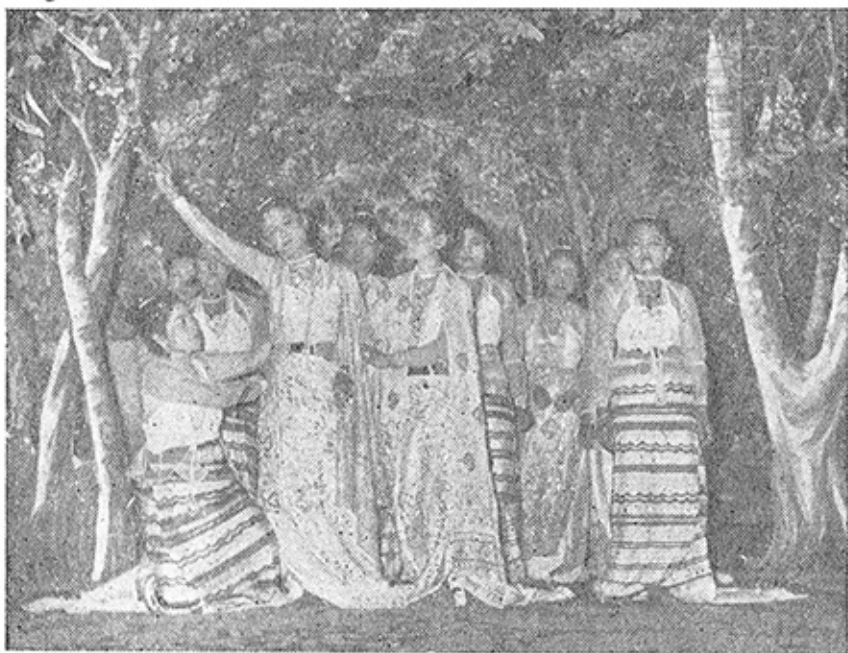
ထူးခြားသော ဇာတ်ခုံအပြင်အဆင်

သူက ဖြေသည်။ “အော်ပရာဘဲ ခေါ်ခေါ်၊ ဘဲလေးဘဲခေါ် ခေါ်၊ အခြား ဘယ်အမည်နှင့်ဘဲ ခေါ်ခေါ်၊ ခေါ်ချင်သလို ခေါ် ပါ။ ရှေးမြန်မာ အနုပညာ အဘိဓာန်တွင် အော်ပရာလို အကမျိုး၊ ဘဲလေးလို အကမျိုး ရှိခဲ့ပါသည်။ ပြဇာတ်ဆိုတာ မျိုးကတော့