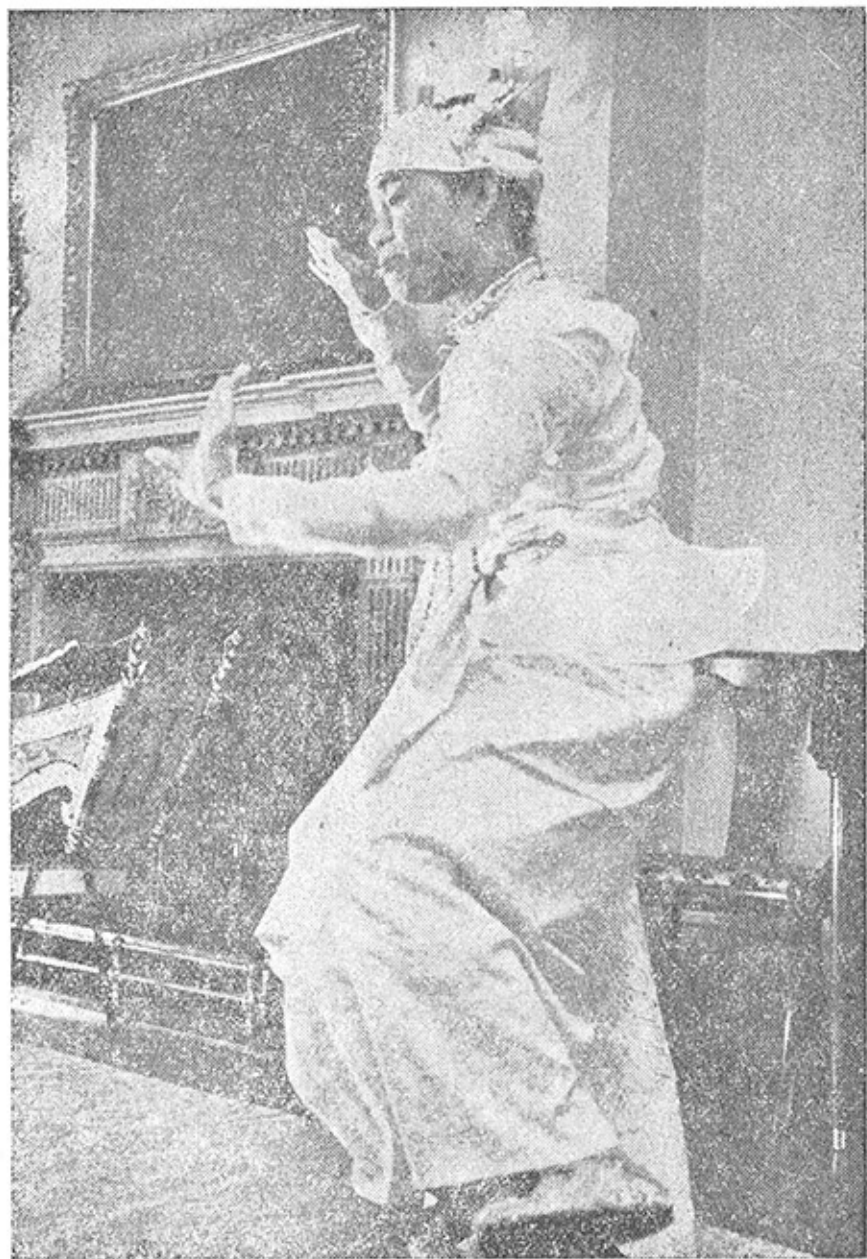
အပေရိကန်ပြည်၌ ကပြစဉ်