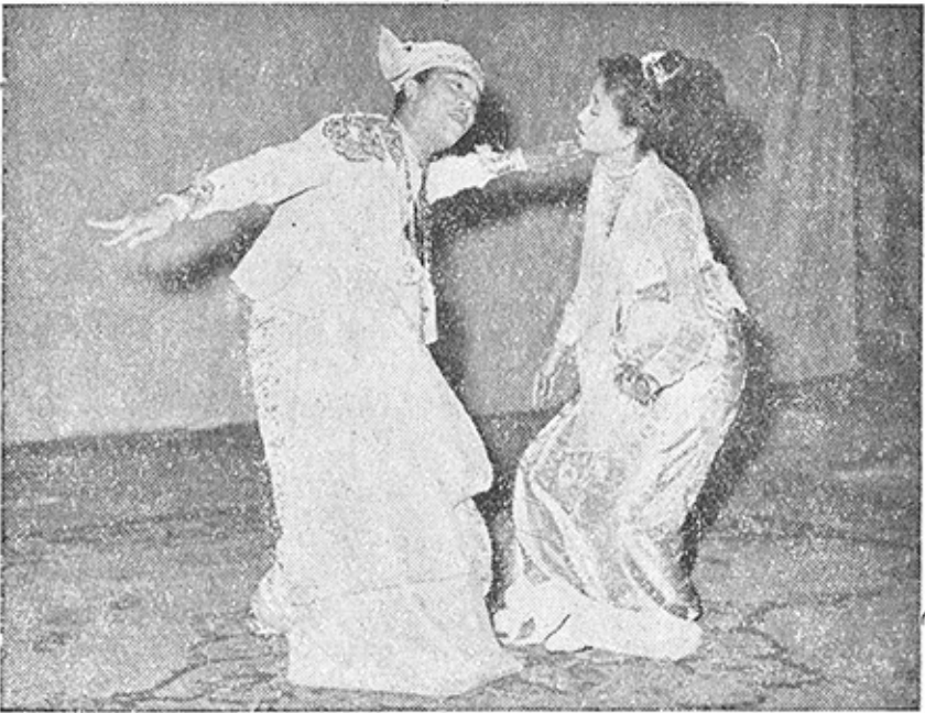
ရွှေပန်း၏ နှစ်ပါးသွား

နေသော မီးအိမ်ပျံကဲ့သို့သော သူ၏ အော်ပရာကိုကြည့်ကာ ဆင် ခြင်သည်။ သူကား ဘယ်သောအခါမျှ အကျထိအောင် စောင့် ဆိုင်းနေသူ မဟုတ်ချေ။ သူ၏ ဇာတ်ခုံပေါ်တွင် အရောင် တဝင်း ဝင်းနှင့် ထွန်းလင်း တောက်ပနေသော အော်ပရာကို ရုပ်သိမ်း လိုက်ပြီး ထိုနေရာတွင် ပြဇာတ်ကို အစားထိုးလိုက်သည်။ “ဂီတရူး၊ သဘင်ရူး၊ ချစ်ပြည်ထောင်စု၊ ချစ်မိစ္ဆာ၊ အောင်ဘာလေ၊ ရွှေ ကြေးစည်” တို့သည် သူ၏ လူကြိုက်များသော ပြဇာတ်များပင် ဖြစ်ကြသည်။