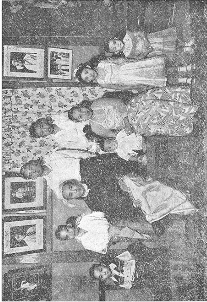
ရွှေမန်းတင်မောင် မိသားစု