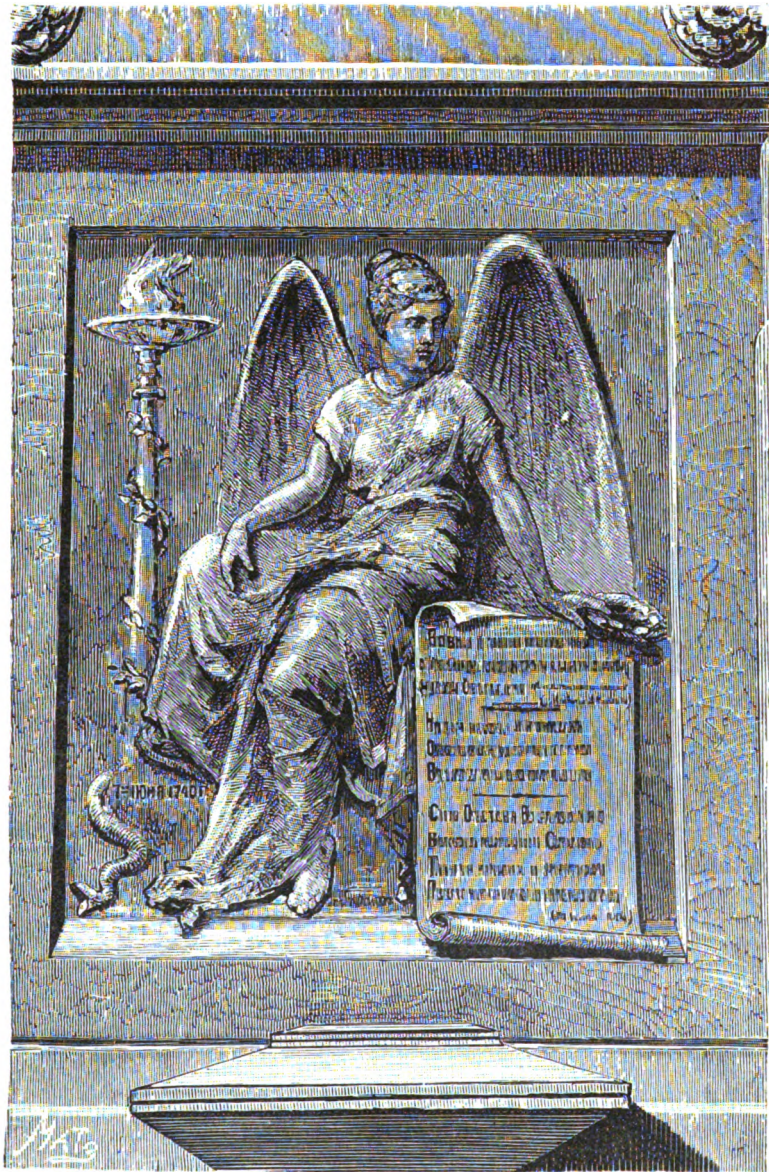
БАРЕЛЬЕФЪ НА ПАМЯТНИКЪ ВОЛЫНСКАГО, ЕРОПКИНА И ХРУЩОВА, СООРУЖЕНЪ ВЪ 1885 Г.

ПРИЛОЖЕНИЕ КЪ ЖУРНАЛУ «РУССКАЯ СТАРИНА», ИЗД. 1886 Г.