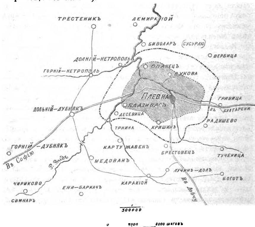
ПЛЕВНА, 1877 г.

«Не въ первый разъ отправляюсь на войну, писалъ Тотлебенъ, 3-го сентября, своему семейству,—счастіе мнѣ всегда благопріятствовало. Будемъ же и на этотъ разъ надѣяться, что милосердый Богъ и теперъ защититъ меня» 1) .