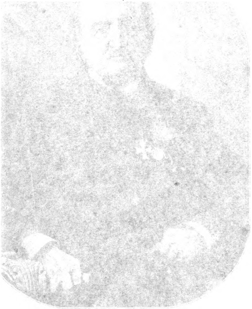
Portrait of a man, likely a historical figure, wearing a dark coat and a hat, looking slightly to the right.