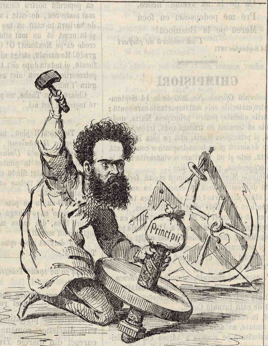
— Să 'mpănescu tocila cu principiile mele, spre a o repara!...