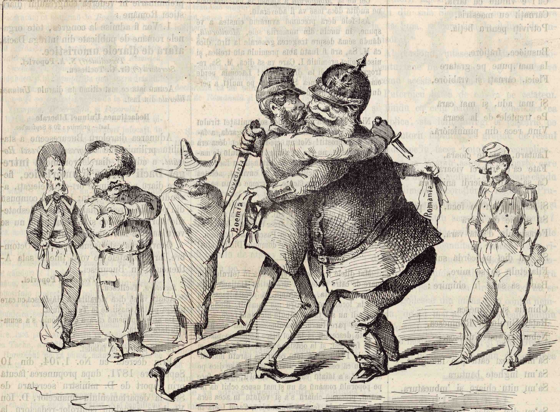
Sinceritatea capetelorū încoronate!..!