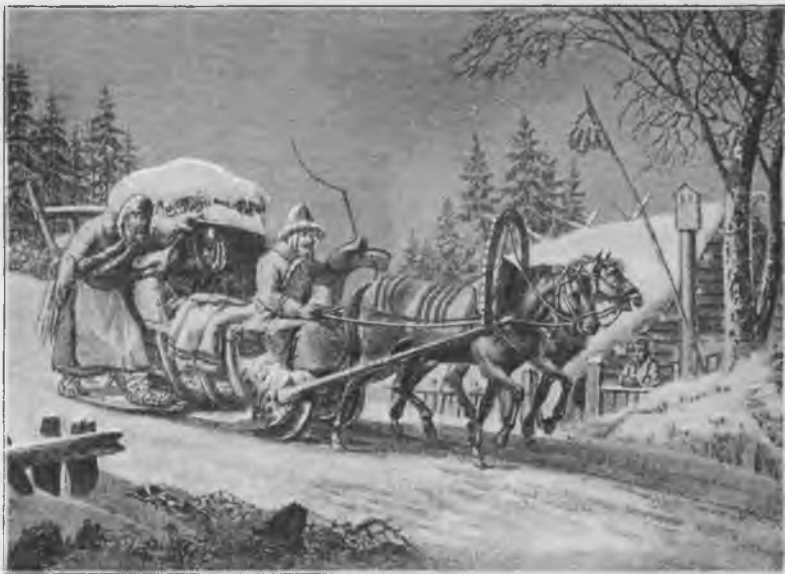
Возокъ помѣщицы начала XIX в.

Вся внутренность экипажей была какъ садъ, — изъ всякаго рода цвѣтистыхъ компаньонокъ, компаньо-