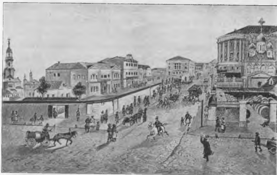
У Мясницкихъ вѣрѣ, гдѣ Почтамтъ.

травка: всѣ разбрелись по деревнямъ накапливать опять денегъ на зиму.