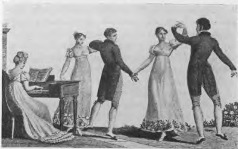
Танцы начала XIX вѣка.

отбиваютъ даму. Кавалеры отвоеванныхъ дамъ достаются сзади идущимъ дамамъ и переходятъ отъ одной къ другой; кавалеръ послѣдней пары оказы-