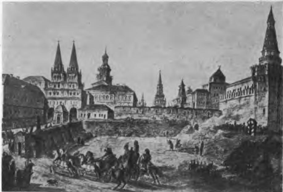
Съ акварели Ѳ. Я. Алексѣева.

Одинъ изъ наиболѣе интересныхъ для нашего времени видовъ работы Алексѣева — это «Тверская улица» съ площадью въ глубинѣ, гдѣ видны несущ-