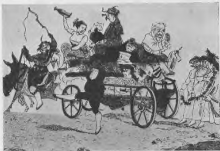
Бѣгство французскихъ артистовъ изъ Москвы.

вляють Москву», бѣгутъ изъ Москвы толстыя модныя торговки — «ихъ нигдѣ по дорогамъ не задержали, а съ честью крестьянки провожали»; за дорогами, наполненными всякимъ бутафорскимъ хламомъ, идутъ въ ногу три драматическія актрисы въ бѣлыхъ платьяхъ и цвѣточныхъ гирляндахъ... *)