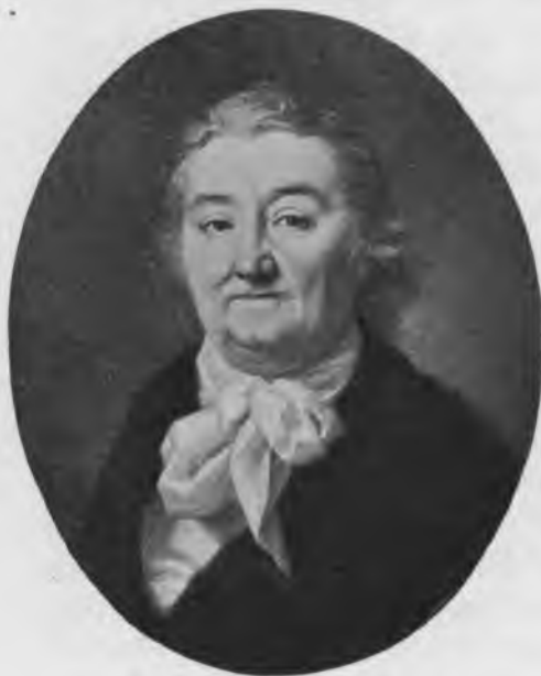
Гр. А. Г. Орловъ-Чесменскій.

Про Алексѣя Орлова говорили, что физическая сила его была настолько велика, что онъ гнулъ подковы и свертывалъ узломъ кочергу. Въ молодости онъ былъ побѣдителемъ не только на каруселяхъ, но всегда