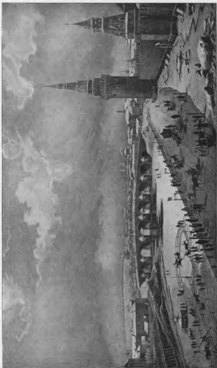
Бѣга на Москвѣ-рѣкѣ.