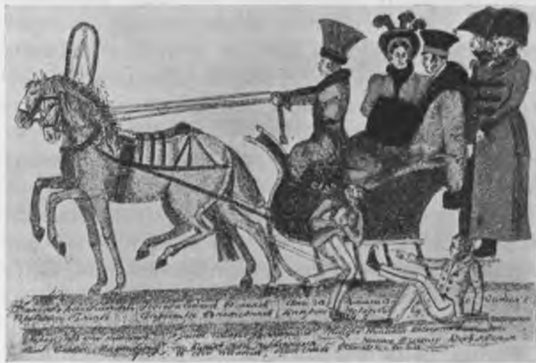
Катанье на масленицѣ.

ничные гулянья на льду Москвы-рѣки. Строились ледяныя горы на высокихъ деревянныхъ подмосткахъ, болѣе трехъ сажень въ вышину. На верху устраивались шатры или терема. Горы были въ два ската и украшались разными цвѣтными флагами. Близъ горъ, тоже на льду, ставились красивыя балаганы; въ однихъ была «ресторация», а въ другихъ