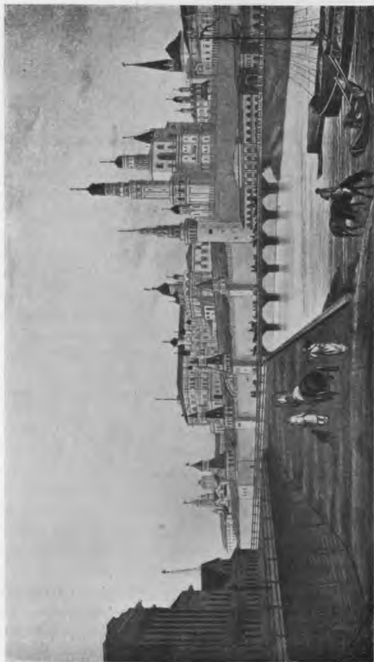
Видъ Кремля изъ-за Москворѣцкаго моста.