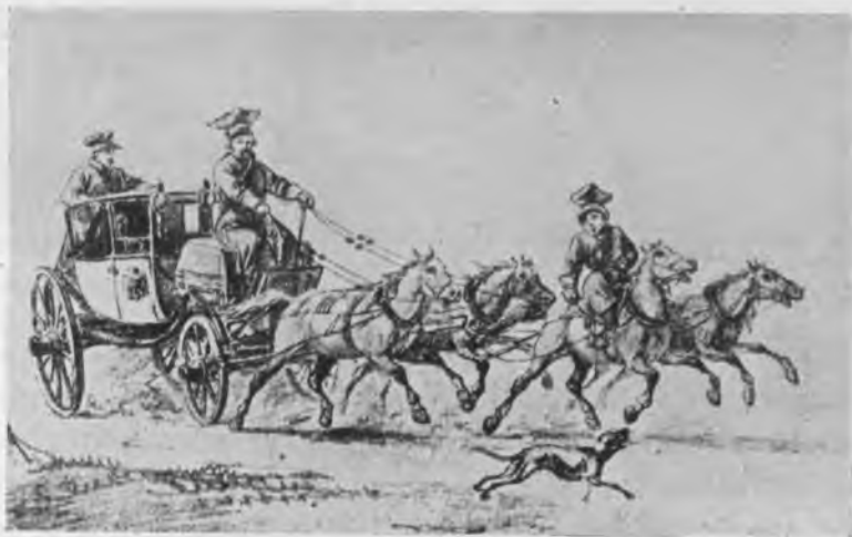
Съ рис. Орловскаго.

Лакеи парные, рослые, въ золоченыхъ ливреяхъ; кучера важные, бородатые, въ бархатныхъ кафтаныхъ, голубыхъ, зеленыхъ, малиновыхъ, съ бобровою опушкою и какою-то блестящею оторочкою; форейторы—дѣти, кричавшіе пронзительнымъ альтомъ на неворотливыхъ прохожихъ или встрѣчныхъ проѣзжихъ, смиренно ползущихъ на войлочкахъ ,—все это были непремѣнные принадлежности большого свѣта.