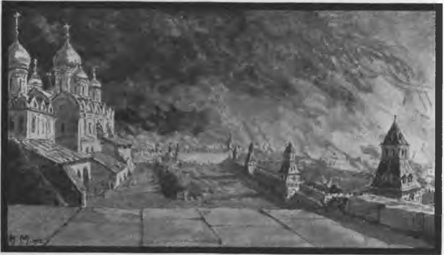
Рис. Н. С. Матвѣева.