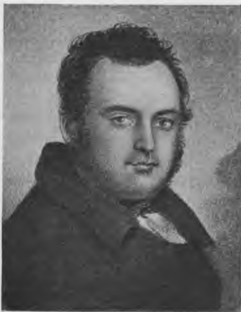
С. Н. Глинка.

Наряду съ графомъ Ѳ. В. Ростопчинымъ въ эпоху Отечественной войны ярко мелькнуло имя