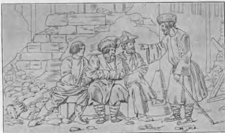
Московское простонародье эпохи 1812 г.

видно движеніе, приготовленіе»,— писала одна дама своей пріятельницѣ въ Петербургъ въ тѣ дни. «Народъ ведетъ себя прекрасно,—говоритъ она.—Увѣрю тебя, что не достало бы журналистовъ, если бы описывать всѣ доказательства преданности отечеству и государю».