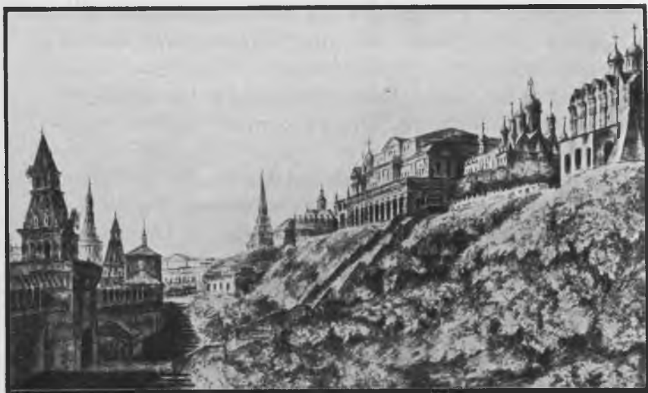
Съ акварели О. Я. Алексѣева.