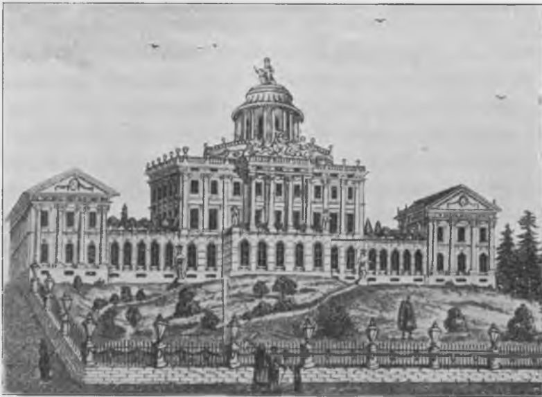
Видъ дома Пашкова до 1812 г.