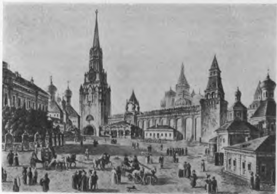
Съ акварели Ѳ. Я. Алексѣева.