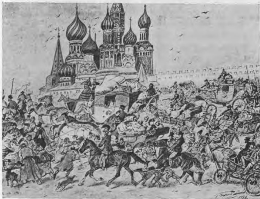
Рисунокъ Н. Е. Сверчкова.