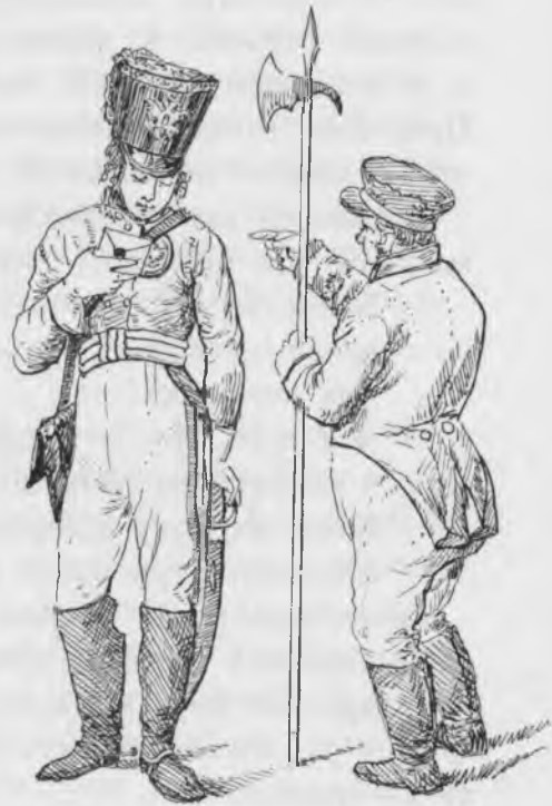
Почтальонъ и городской стражъ.

Присутственныя мѣста содержались грязно, стекла разбиты, заклеены бумагою... «Даже въ сенатѣ. «пер-