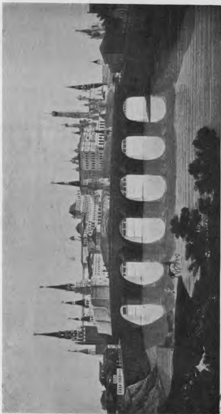
Видь Кремля изъ-за Каменнаго моста.