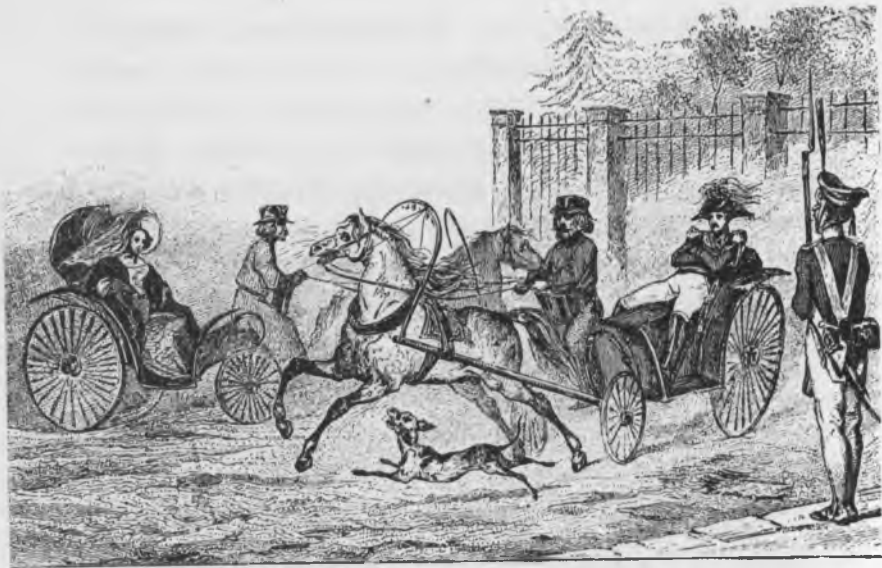
Дрожки начала XIX в.

бодилъ бѣднягу, которая продолжала кричать безъ памяти. Онъ спросилъ меня, кто я таковъ, и объявилъ, что хотя, по принятымъ правиламъ, долженъ былъ бы отправиться со мною въ полицію, но что онъ не хотѣлъ бы мнѣ сдѣлать эту неприятность, и потому предлагаетъ дать женщинѣ сколько-нибудь денегъ на лекарство и тѣмъ предупредить ея формальную жалобу. Я бы радъ былъ дать все, что угодно, но со мною не было денегъ, и когда я объявилъ о томъ приставу, то онъ заплатилъ женщинѣ 5 рублей своихъ, съ тѣмъ, чтобы я послѣ возвратилъ ихъ ему, а впредь старался ѣздить осторожнѣе».