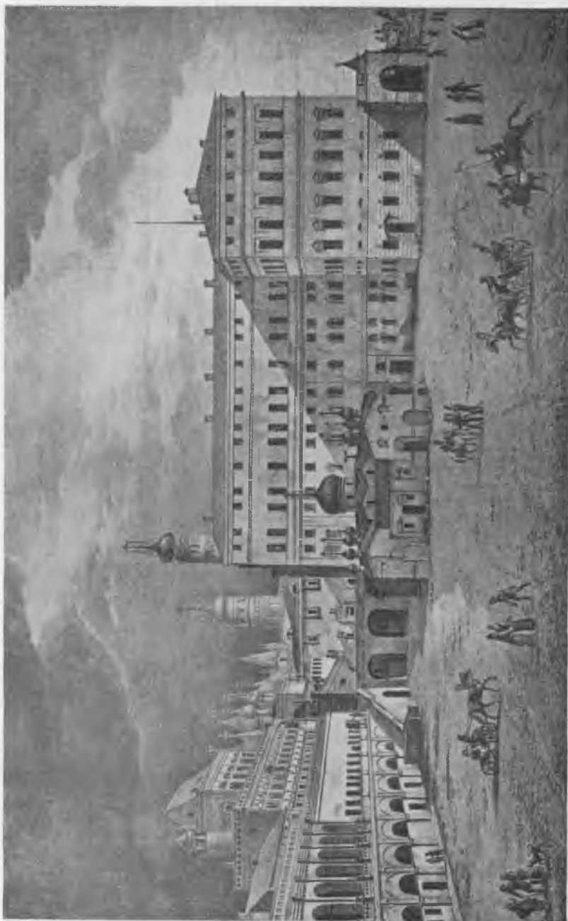
Соборъ Спаса на Бору, дворедъ и терема.

Управленіе путей Валаръ № 1 Министерство Путей Сообщенія 1901