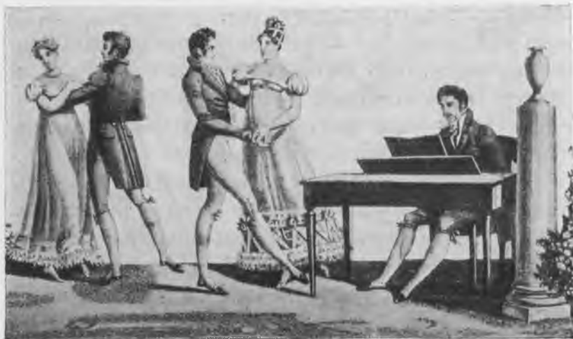
Танцы начала XIX вѣка.

Балъ открывался «длиннымъ польскимъ», тянувшимся извилистой змѣей по всѣмъ комнатамъ. Степенные старички и почтенныя старушки, въ шутку, то щеголевато кланяются, то присѣдаютъ. Не понав-