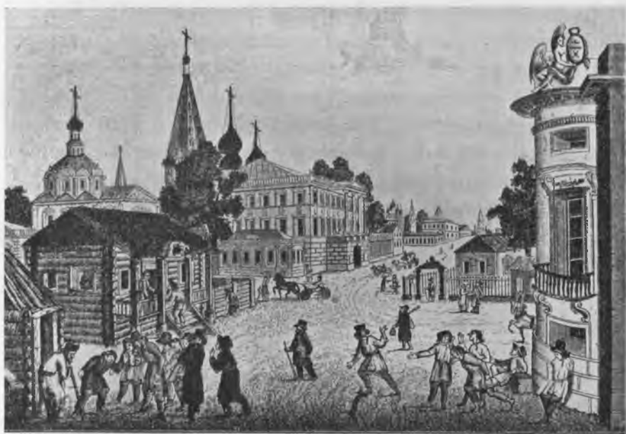
Московская улица въ началѣ XIX ст.

Замощиваніе Москвы шло очень туго: оставались не замощенными къ 1812 г. даже крупныя пространства центральныхъ площадей и улицъ.