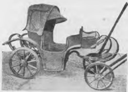
Походный экипажъ Кутузова, какъ типъ экипажа того времени.

Къ характеристикѣ москвичей у Вигеля есть слѣдующія строки: «Въ Москвѣ... всегда съ нѣжнымъ восторгомъ говорятъ о Западѣ и стараются подражать ему, а между тѣмъ въ обыкновенномъ быту сохраняютъ всѣ навыки Востока, гдѣ гаупцы всегда состояли и состоятъ еще подъ защитою законовъ