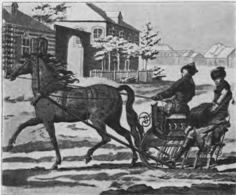
Щеголь съ «манькой» на «ващкѣ».

Дамы носили платья съ высокою таліей, съ короткими рукавами и длинныя, но локоть, перчатки; прически—à la Titus, шляпы—глубокія, башмаки à la Dupont (извѣстный парижскій танцовщикъ, вскружившій головы дамамъ всѣхъ націй, незадолго передъ войною