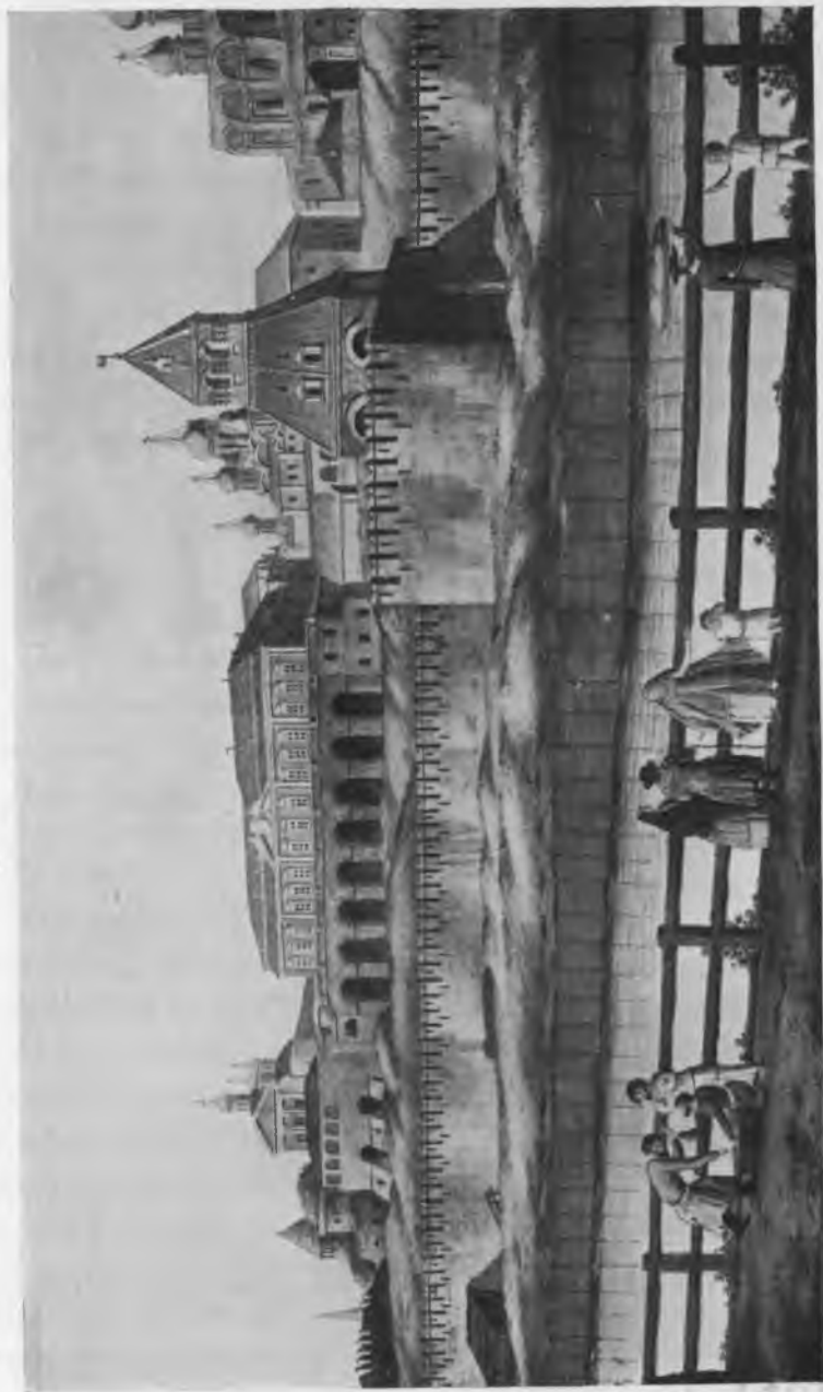
Видъ Кремля изъ Замоскворѣчья.