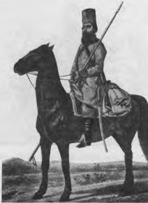
Конный казакъ московскаго ополченія.

Московское дворянство выставило 80 тыс. ополченцевъ. Вотъ ихъ одежда: штабъ и оберъ-офицеры имѣли общіе армейскіе мундиры, конные и пѣшіе егеря и казаки имѣли русскіе сѣрые кафтаны изъ толстаго сукна и такія же шаровары; рубашки на нихъ были съ косымъ воротомъ, на шеѣ платки, на