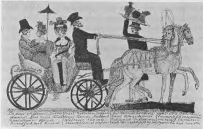
Катанье въ семькѣ.

и тѣхъ, которые ѣдутъ смотрѣть другихъ изъ одного любопытства или обязанности! говорю: «по обязанности», потому что всякій коренной москвичъ обязанъ быть на извѣстныхъ гуляньяхъ въ избѣжаніе заключеній о немъ, точно также, какъ и всякая московская барышня обязана не пропускать на балахъ ни одного танца». «По случаю сегодняшняго гулянья