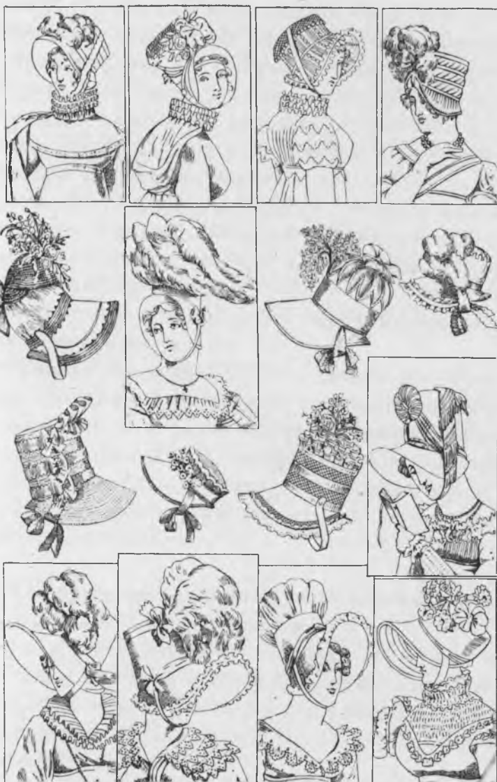
Шляпки эпохи 1812 г.