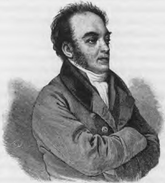
Графъ Федоръ Васильевичъ Ростопчинъ.

что я неутомимъ и что меня видятъ повсюду. Я усиѣлъ заставить такъ думать о моей дѣятельности, разѣзжая въ одно и то же утро по самымъ отдаленнымъ одна отъ другой частямъ города и вездѣ оставляя слѣды моего правосудія или строгости... Я входилъ всюду, я говорилъ со всѣми, я многое узна-