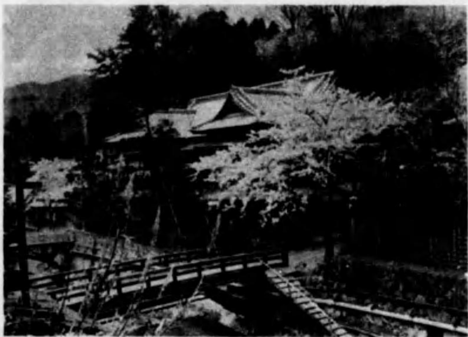
富士屋旅館の一部