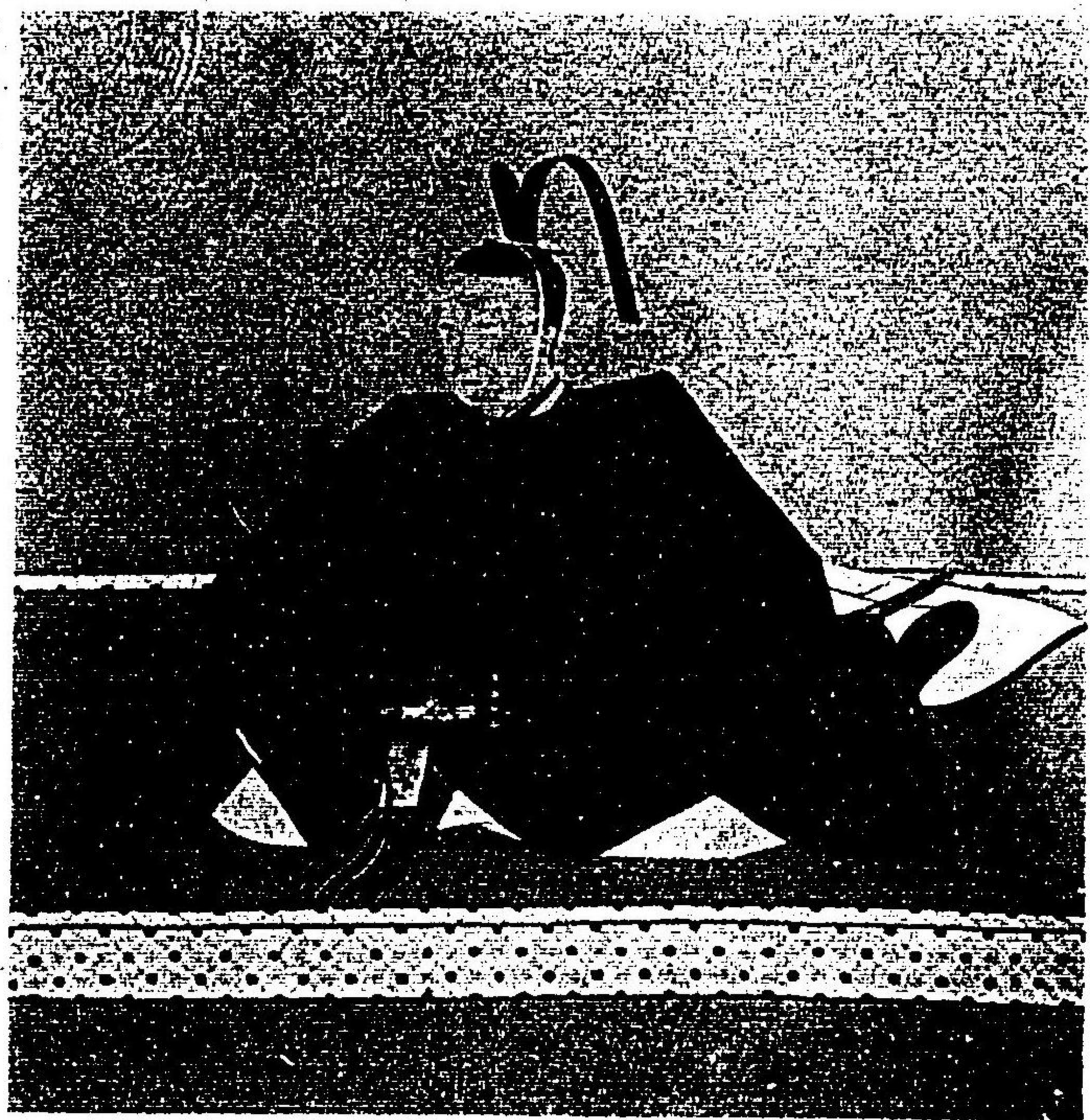
紙懷及像肖卿護齊川細