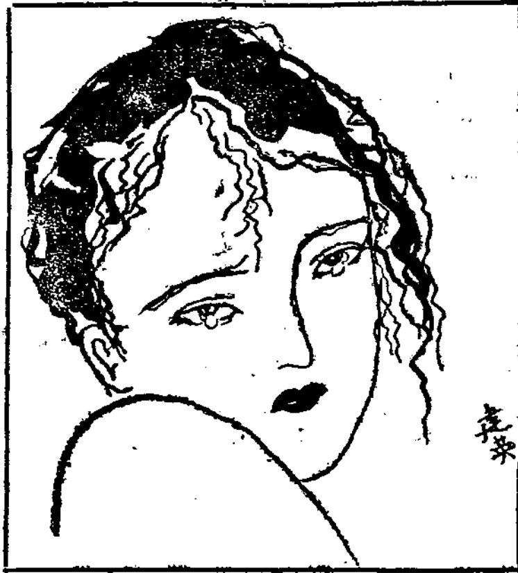
— 運 明 珠 雙 淚 垂 —