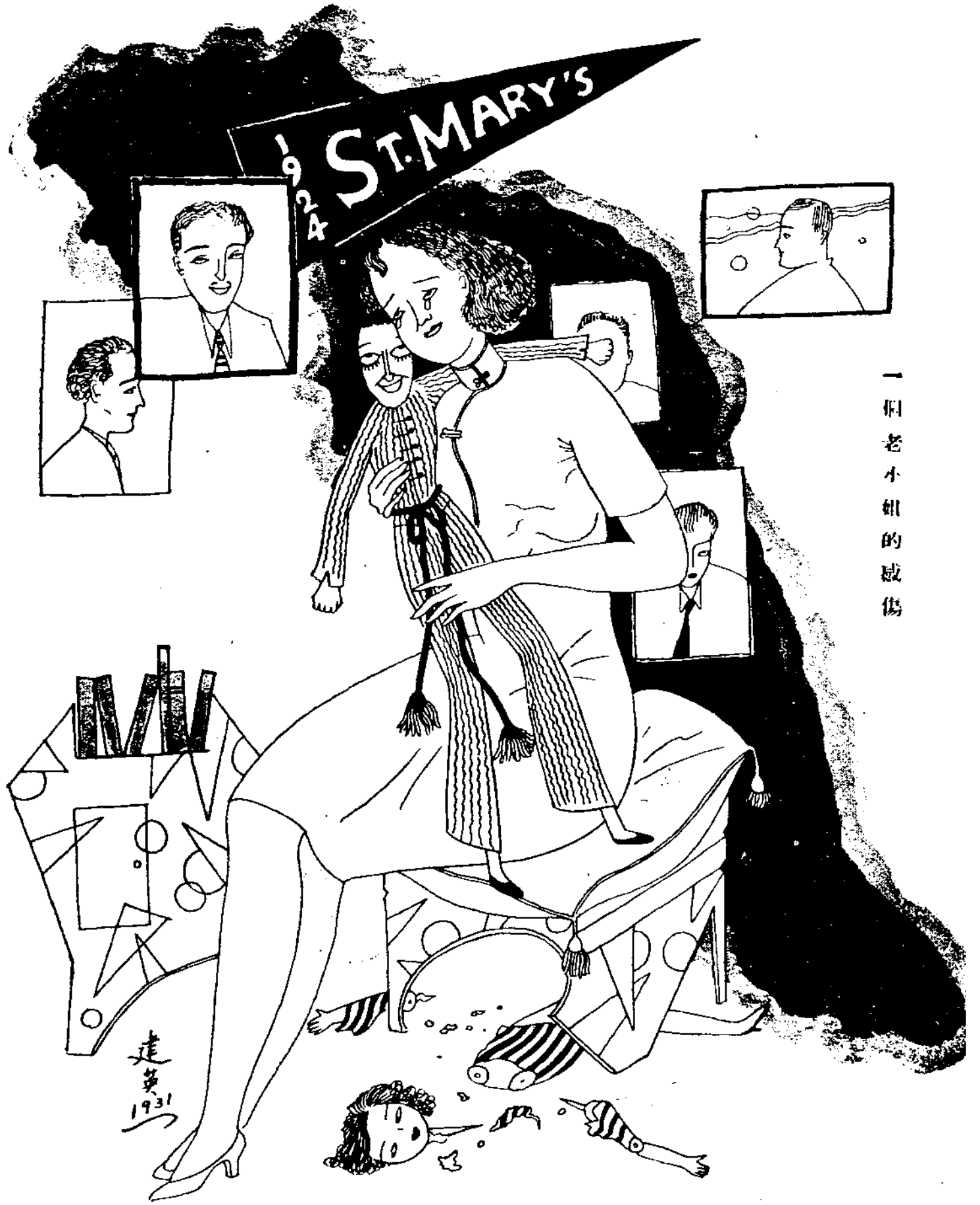
一個老小姐的感傷