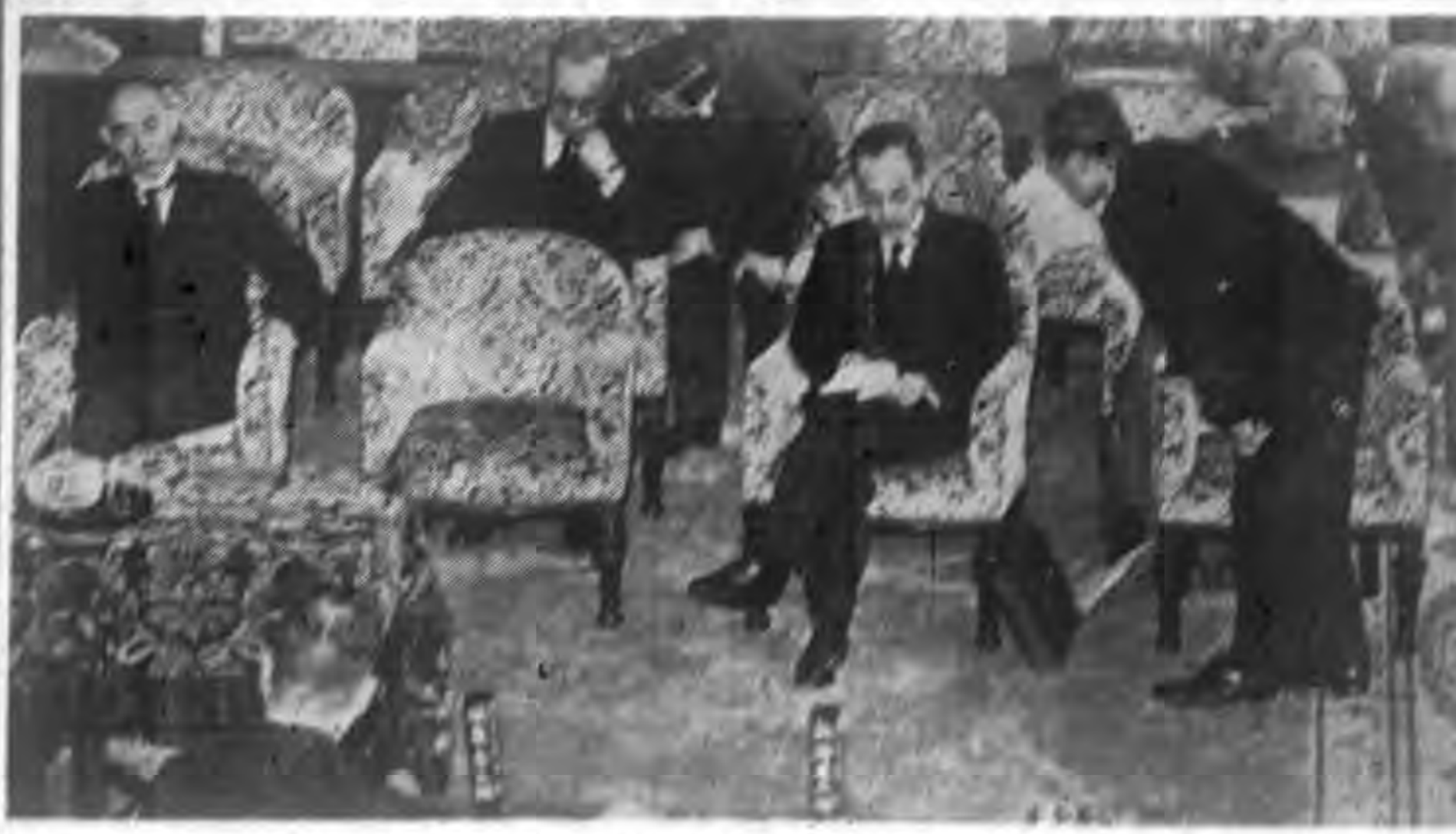
相陸山杉·相廣城精·相廣當伍·相育其