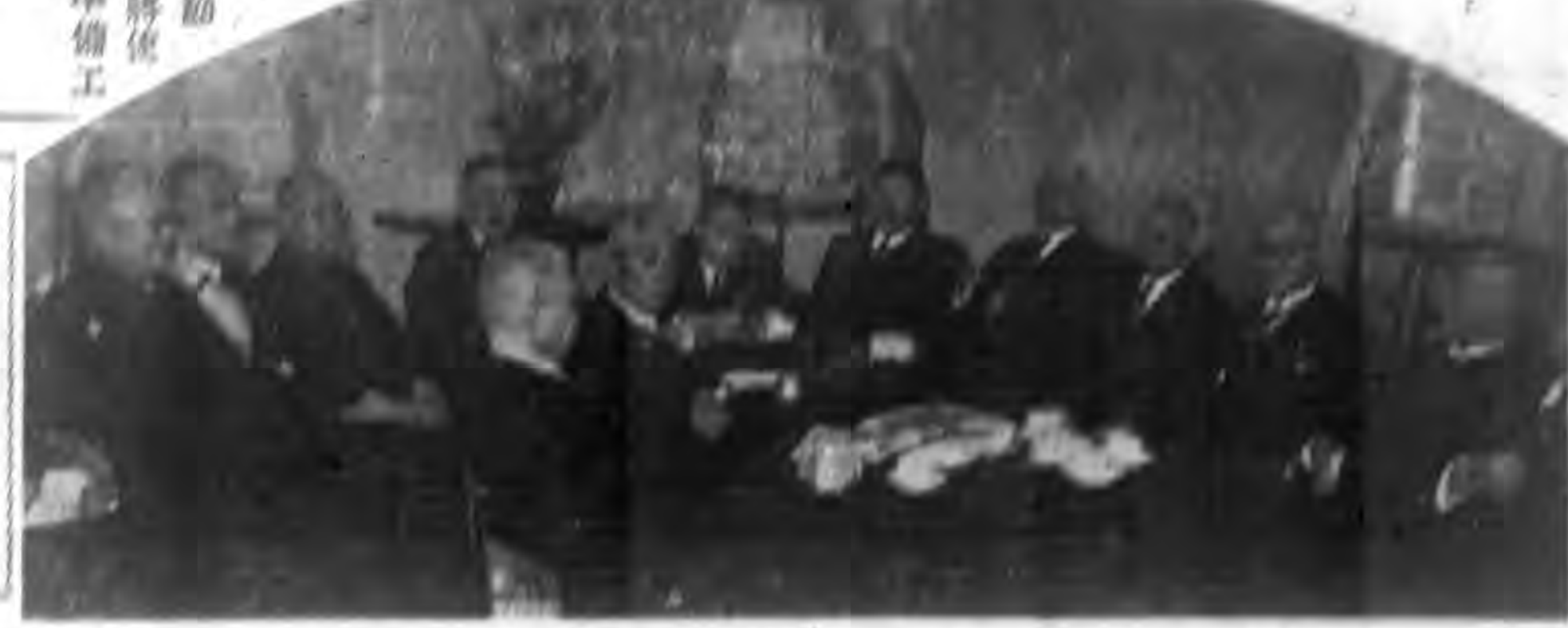
因路及會首... 之領... 午前十時... 政及務會