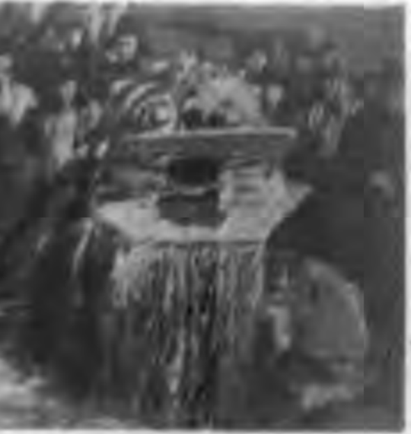
慶祝萬壽節，新京博頭...