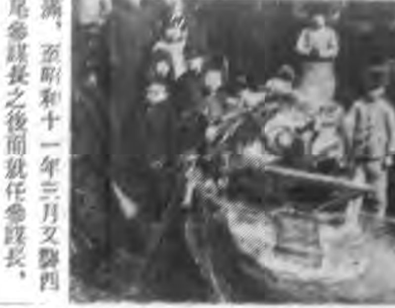
慶祝萬壽節，新京博頭...