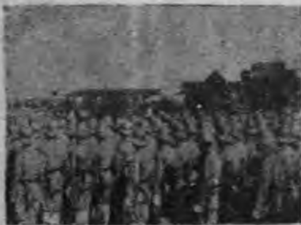
• 新軍中與國情形 •

州一帶，其部隊業已開入收復區。後，供職十五年，在唐生智部，現年五十二歲。在保定軍官學校畢業，第三師師長，五年，國民革命軍第八軍軍長，兼武漢衛戍司令，湖北省政府主席，升為國民革命軍第一軍軍長，兼武漢衛戍司令，湖北省政府主席。府主席，第二次北伐軍事委員會委員。十六年，將軍被任為第十二路軍總指揮，率部北上，戰事起，將軍因父喪丁憂，暫行告退軍事生活。翌年將軍東山再起，十七年，將軍在李宗仁部下任第五路軍總參謀長，兼西靖綏公署副主任，五年，西全看，並督辦，及不拾遺，夜不閉戶，其梓鄉太公署副主任，五年，西全看，並督辦，及不拾遺，夜不閉戶，其梓鄉為平。同使，西全看，並督辦，及不拾遺，夜不閉戶，其梓鄉切實。將軍性沉著，好實幹，故深得部下的愛戴。辦事態度雍容，辦公