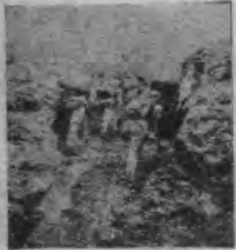
我戰在土戰區補毒殘敵

出，江，浙，江，蘇，因各地民衆響應，又垂手而得。國民政府成立後，任第一師旅長，後升任第一師旅長，協助全軍訓練。 把軍事交與蔣委員長，任國民革命軍第一師旅長，後升任第一師旅長，協助全軍訓練。 任國民革命軍第一師旅長，後升任第一師旅長，協助全軍訓練。 應八，七，事，二，一，乃常與宋哲元，于學忠等抗戰領袖，商討國是。 對日抗戰，將軍沒有放鬆過敵人，始終以打擊還打擊，不遺餘力。