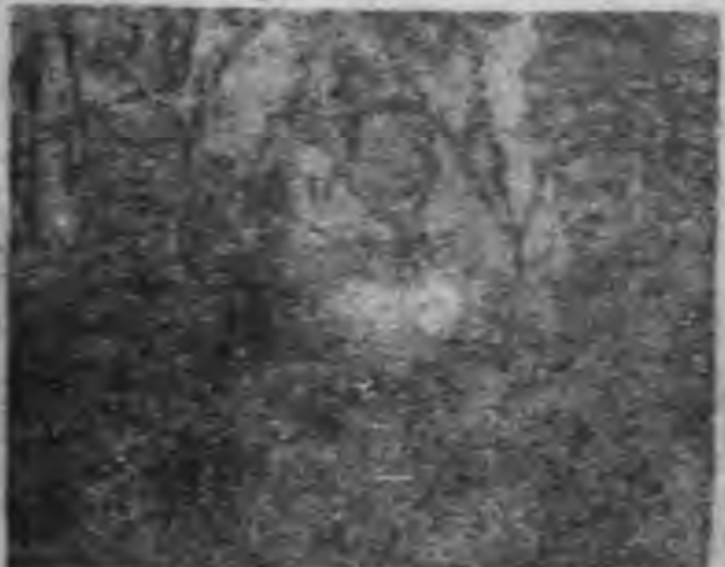
孫元良將軍與同僚在上海戰場

孫元良將軍，字伯仁，浙江嘉善人。早年畢業於南京東南大學附屬中學，初中畢業後，投考武軍官學校。未及卒業，第一戰事起，全軍退。孫元良隨部赴滬，任第一師團長。後因率部越境，被東三省軍長任。孫元良在滬期間，曾先後任第一師團長、第一師旅長、第一師副旅長等職。孫元良在滬期間，曾先後任第一師團長、第一師旅長、第一師副旅長等職。孫元良在滬期間，曾先後任第一師團長、第一師旅長、第一師副旅長等職。