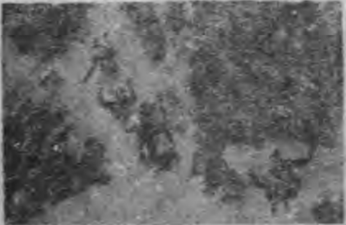
日軍在長沙地區中戰事經過圖

除致力於抗戰軍事外，將軍於戰區內的行政，也抱持絕大的關心，如整理田賦，增加農產，改善農民生活，每甘博得每一個湖南人民的讚許。