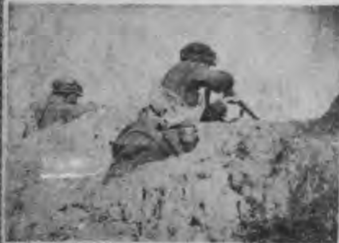
在戰場前線向手擊射的威發

響應討伐孫總理叛逆陳炯明，參與惠州之役，將軍身受重創，經療養數月才告痊癒。後將軍任命為黃埔軍官學校校長。民國十五年國民軍北伐時，被委為第一國民軍第五團團長，數次作戰於湖南，其後迭任浙軍警備司令，國民軍第一師師長，在任內曾於皖北作戰，從北伐軍手里佔據了徐州，蚌埠等地，因此將軍又擢升為第一軍副司令。一二八上海中日戰爭，被任命為左翼軍總司令，駐紮滬杭綫一帶。同年五月休職。城定簽字後，將軍即調防至蚌埠，任第二軍軍長及警備司令之職。民國二十一年八月，將軍奉令為北路剿匪軍野戰司令及行動總司令。