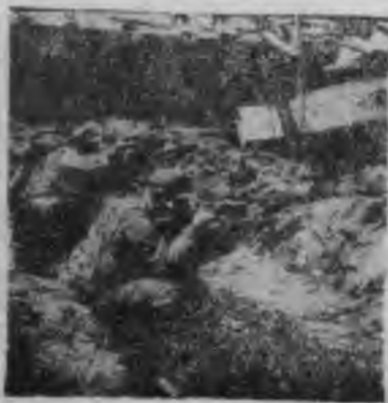
利用瓦礫爲天然障礙 向敵人不斷猛襲

八一三戰爭爆發，國民政府遷都以後，將軍率部轉戰於北方各戰線，屢創頑敵。戰事結束前，將軍爲第十一戰區司令官，日軍投降後，他奉令接收天津，北平，保定，石家莊等地區。