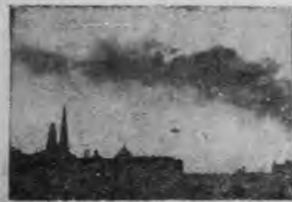
市港上的禮炮三一一八交曾 與復設處力勞去長市錢要領正

，雙。而。深。上。人。對。於。市。長。錢。大。鈞。將。軍。的。印。象。基。於。西。安。事。變。而。深。足。令。人。感。佩。且。善。於。講。法。策。略。而。深。足。令。人。感。佩。且。善。於。講。法。策。略。 ，雙。而。深。上。人。對。於。市。長。錢。大。鈞。將。軍。的。印。象。基。於。西。安。事。變。而。深。足。令。人。感。佩。且。善。於。講。法。策。略。而。深。足。令。人。感。佩。且。善。於。講。法。策。略。 ，雙。而。深。上。人。對。於。市。長。錢。大。鈞。將。軍。的。印。象。基。於。西。安。事。變。而。深。足。令。人。感。佩。且。善。於。講。法。策。略。而。深。足。令。人。感。佩。且。善。於。講。法。策。略。 ，雙。而。深。上。人。對。於。市。長。錢。大。鈞。將。軍。的。印。象。基。於。西。安。事。變。而。深。足。令。人。感。佩。且。善。於。講。法。策。略。而。深。足。令。人。感。佩。且。善。於。講。法。策。略。