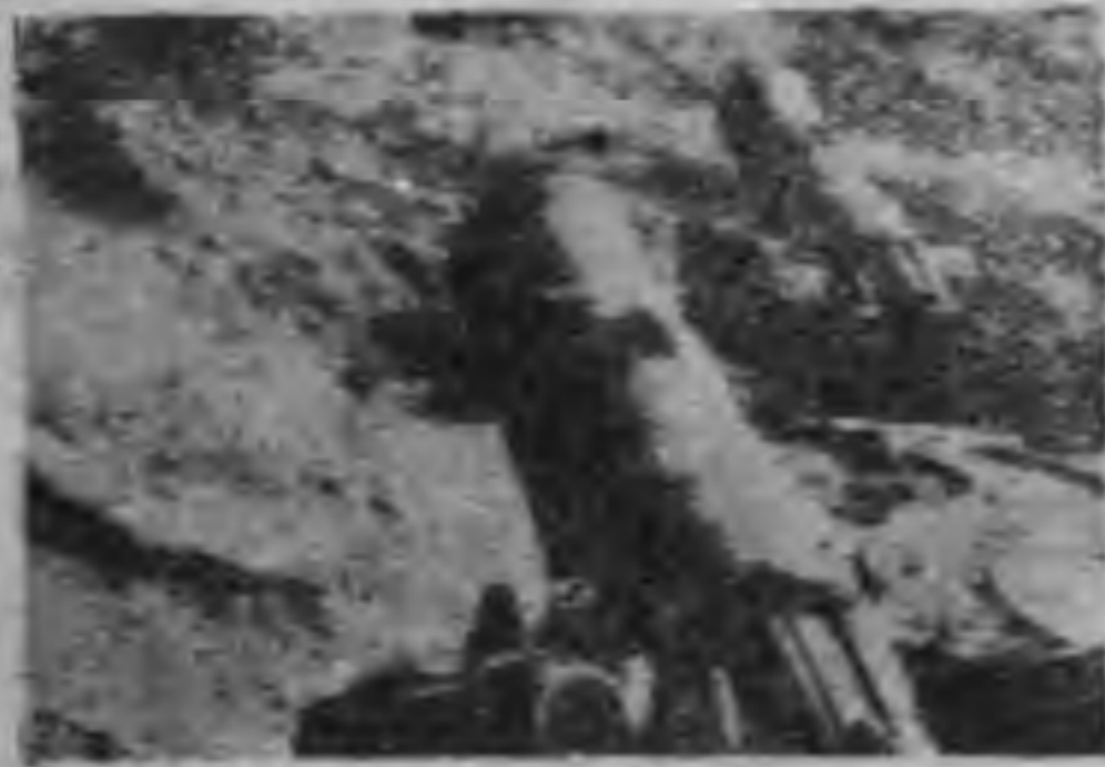
現代戰爭中不可不重視的大砲威力

將軍不僅善於作戰，且對教育事業亦頗感興趣，他在蘭州，所有清河，築路，發揚工業諸事都是將軍親自督促辦理的。因此當地民衆特為他建立一座寶塔，藉資紀念將軍的功績。