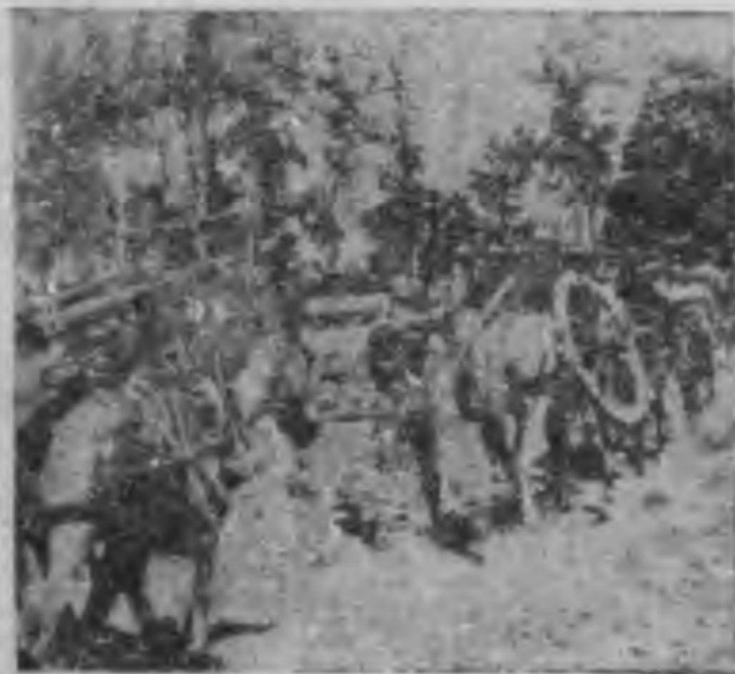
我騎兵團重隊向戰場進

程潛將軍年齡雖已很高，然精神極佳，尤其對軍事的事業劃更具經驗，不愧是位久戰沙場的老將軍。