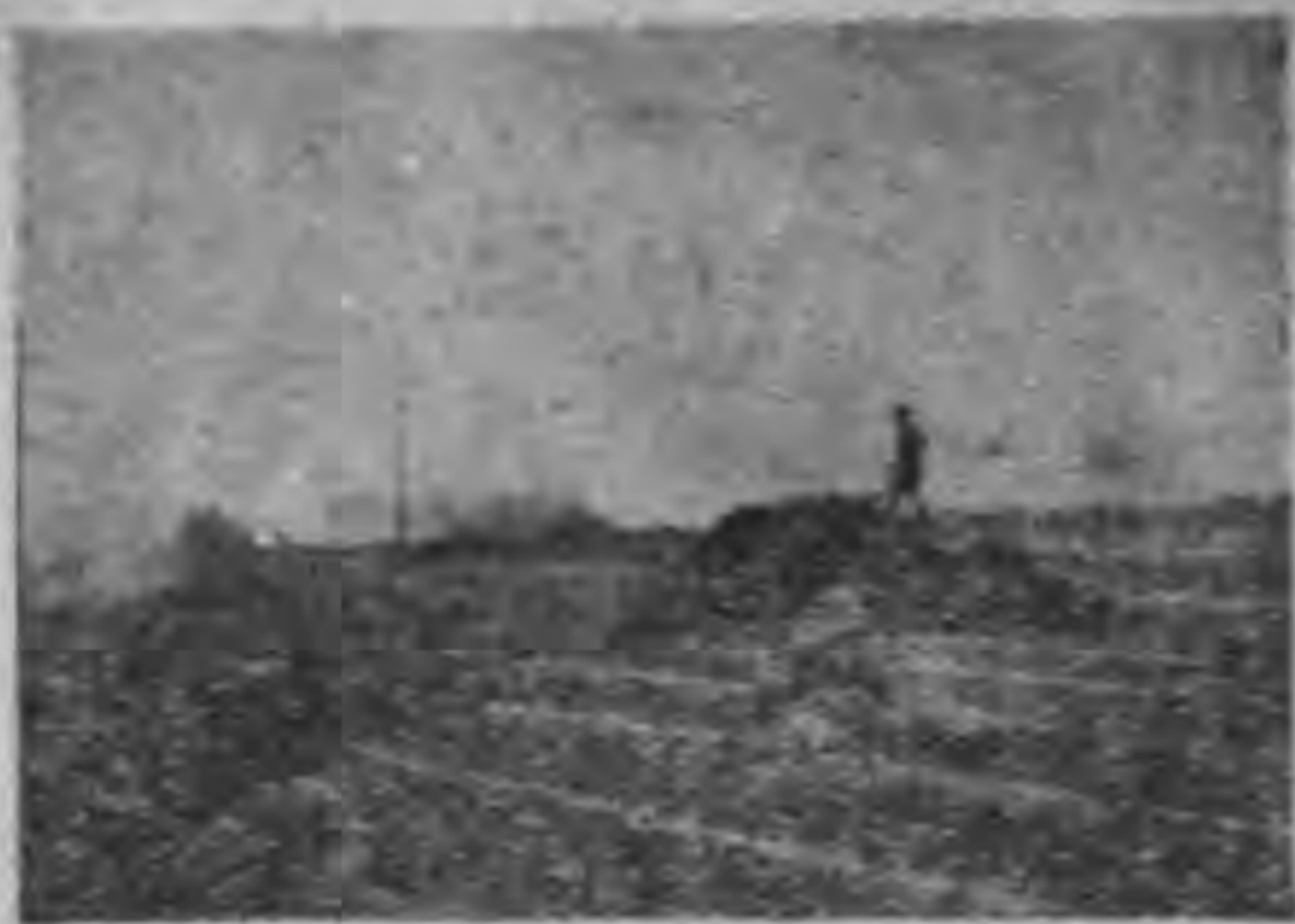
軍敵擊三砲守嚴軍我線前火炮在

寫冰心養生監，雪擁孤城笛吹咽，星羅大漠劍光曜，回頭廿五年間事，（余隸軍人陸軍忽忽廿五年矣） 傷心又旌一揮，勳馬山，胡騎盡，雄徹夜鳴，黎傷還期，素願，安邊未忍負蒼生，戰雲過眼空千里，拱劫 報國武將，如家，征一戰，夜，刁，青，涼，噴，又，關，人，與，古，同，仇，空，切，齒，三，邊，重，宗，獨，披，肝，雲，橫，古，戍，孤，烟，直，風，捲 晴沙落日，尤可，見，將，軍，一，肩，担，荷，重，涼，折，斷，興，已，嘆，未，遑，安，吾，人，於，數，折，舞，之，餘，尤，懷，念，此，一，代，千，城，之，蘇，將，軍 不置也。