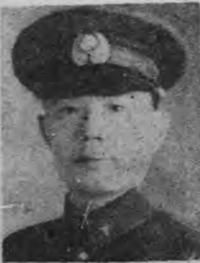
中國航空學會會長。

周將軍浙江臨海人，今年四十七歲，保定軍官學校出 身，卒業後，即為浙江省第二師中校。後改任廣東黃埔 軍官學校教練。旋又任第二十一師參謀，及第十一師參謀 長。 民國二十年開奉令為第十四師師長，未幾參加豫，魯 ，魯，湘諸省革命運動。 後將軍辭去第十八軍副軍長職，出洋學習空軍。二十 三年回國後，即委為杭州中央航空學校指揮官。民國二十 七年，二十八年期間，任中央航空總司令部，率領一部份主 要空軍健兒，縱橫於天空作戰，殲滅敵人。後任中國航空學 會會長。