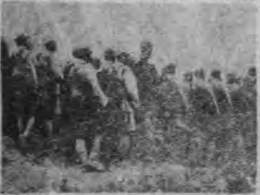
丁凡與他的強壯力門紙家有機

一文，不為武。他不能以武取他的名！ 他元白加武起。他現年五十二歲，畢業於保定軍官學校民令，指揮六年任。他現任。他現任。 部佔領。他現任。他現任。 委任。他現任。他現任。 席，同。他現任。他現任。 國民。他現任。他現任。 二十八年。他現任。他現任。 朝，而。他現任。他現任。