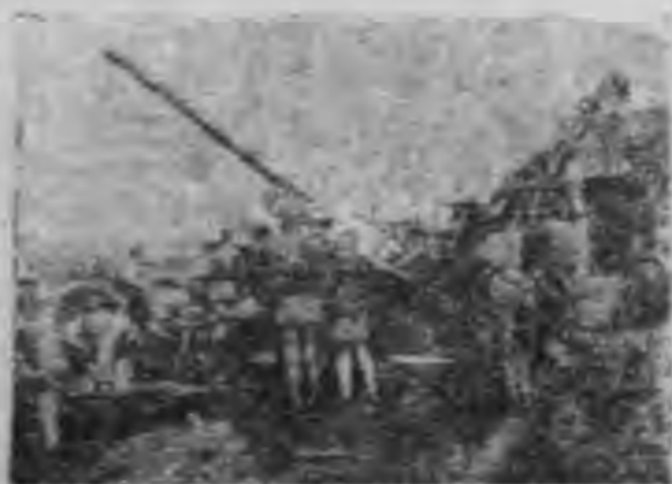
我軍以高射砲構築地上防空陣

十七年起又擔任第一集團軍參謀長，翌年四月任海陸空軍總司令行營參謀長，十八年又任命爲洛陽總司令行營主任，代表總司令主持一切。同年選舉爲國民黨中政會委員及中央執行委員。