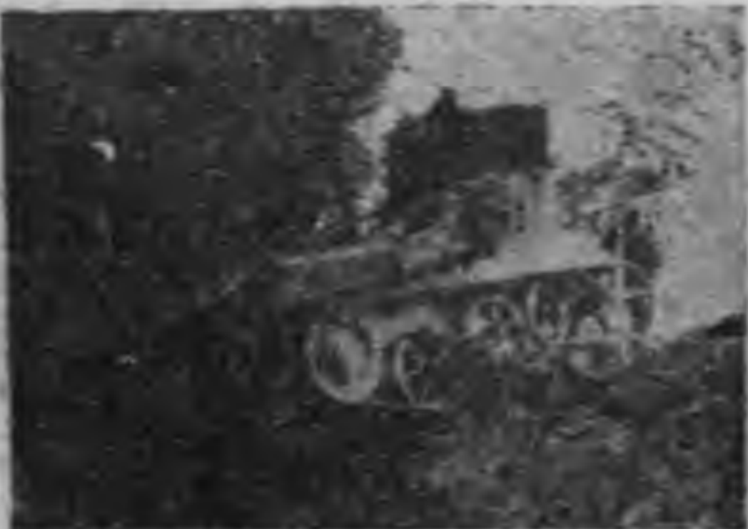
車克 想我的托拉地地直往勇

訂而河山光復，舉國歡騰，而尤其是因馬關條約之簽 一掃而日本宰割了去的台灣，而重我同胞自由，更覺得 是一件興奮而痛快的事情。起見特派陳儀將軍，爲該省 行政長官，並兼任台灣警備司令。陳儀將軍，爲該省 本士官學校砲兵科畢業後，更入日本陸軍大學求學，自日