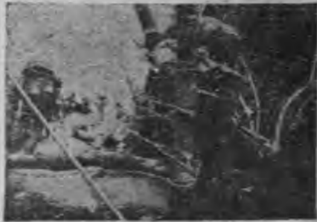
軍擊遊我的滅寇以加探敵索獲