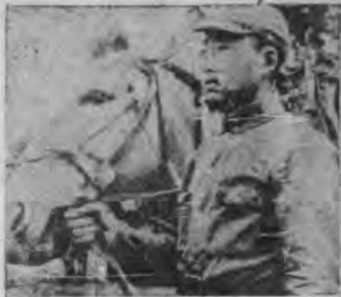
相安爲念的戰士與戰馬。