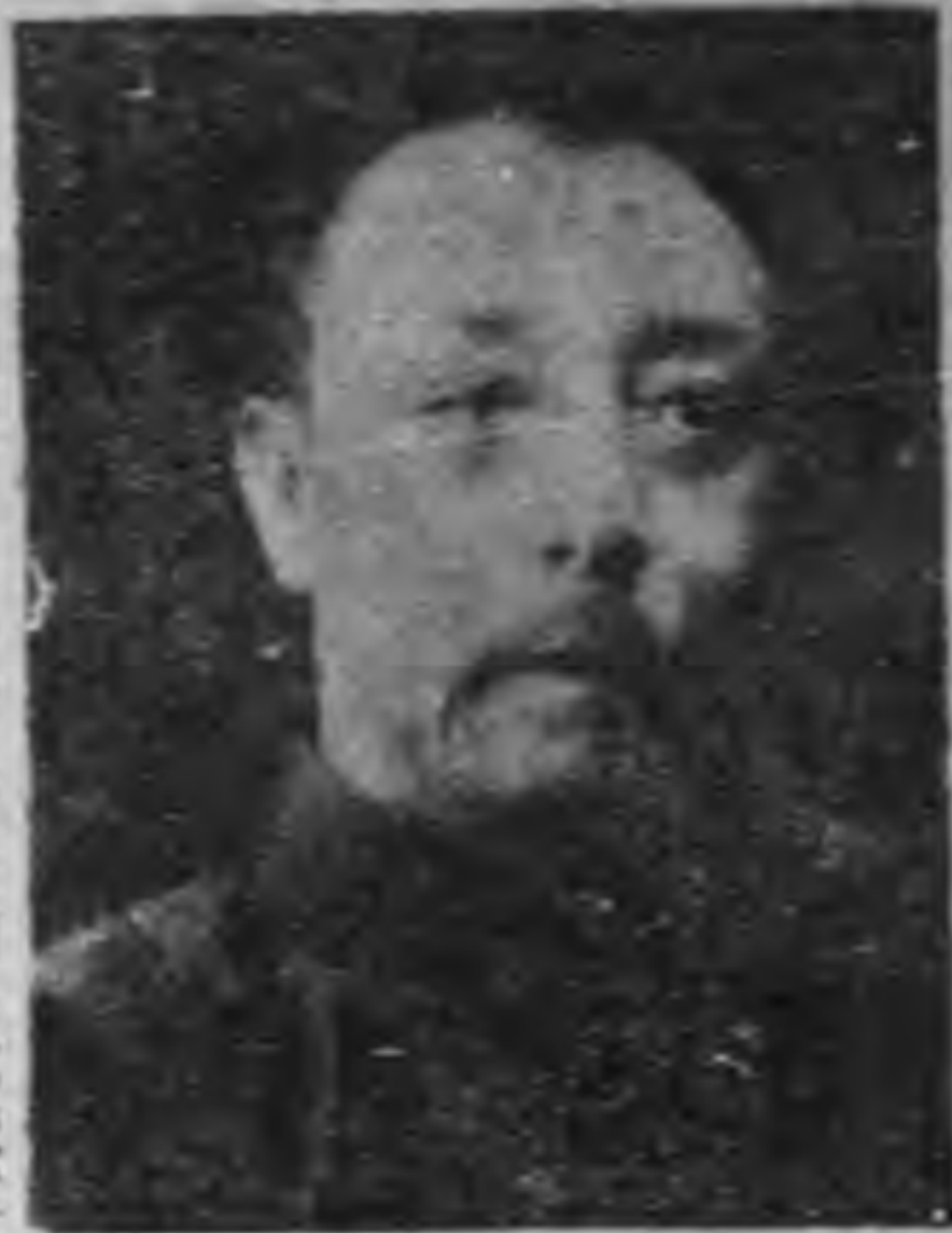
大後方督造生力軍的