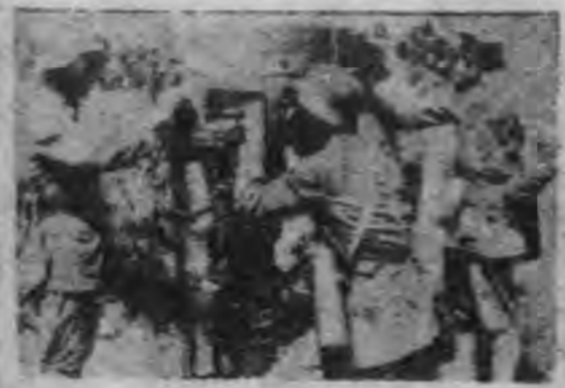
青年軍用機槍作操的人

了中國青年軍一個個無匹的。青年軍人率領川軍第三十八師及粵軍的一部。 便開始於抗戰後，他發揚了無匹的勇健。便開始於抗戰後，他發揚了無匹的勇健。便開始於抗戰後，他發揚了無匹的勇健。便開始於抗戰後，他發揚了無匹的勇健。 份，指場選戰，戰戰無匹的。份，指場選戰，戰戰無匹的。份，指場選戰，戰戰無匹的。份，指場選戰，戰戰無匹的。 漢七，他會了，戰戰無匹的。漢七，他會了，戰戰無匹的。漢七，他會了，戰戰無匹的。漢七，他會了，戰戰無匹的。 個，對員訓會了，戰戰無匹的。個，對員訓會了，戰戰無匹的。個，對員訓會了，戰戰無匹的。個，對員訓會了，戰戰無匹的。 軍，於長青，戰戰無匹的。軍，於長青，戰戰無匹的。軍，於長青，戰戰無匹的。軍，於長青，戰戰無匹的。 由，於長青，戰戰無匹的。由，於長青，戰戰無匹的。由，於長青，戰戰無匹的。由，於長青，戰戰無匹的。 精，於長青，戰戰無匹的。精，於長青，戰戰無匹的。精，於長青，戰戰無匹的。精，於長青，戰戰無匹的。 願，於長青，戰戰無匹的。願，於長青，戰戰無匹的。願，於長青，戰戰無匹的。願，於長青，戰戰無匹的。 經，於長青，戰戰無匹的。經，於長青，戰戰無匹的。經，於長青，戰戰無匹的。經，於長青，戰戰無匹的。 究，於長青，戰戰無匹的。究，於長青，戰戰無匹的。究，於長青，戰戰無匹的。究，於長青，戰戰無匹的。 看，於長青，戰戰無匹的。看，於長青，戰戰無匹的。看，於長青，戰戰無匹的。看，於長青，戰戰無匹的。 其，於長青，戰戰無匹的。其，於長青，戰戰無匹的。其，於長青，戰戰無匹的。其，於長青，戰戰無匹的。