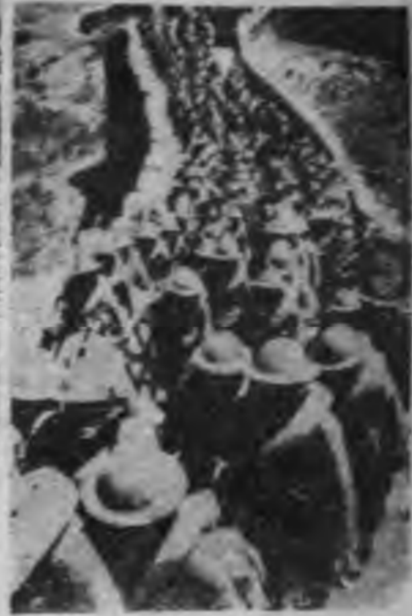
晉北戰役中子團的強行軍