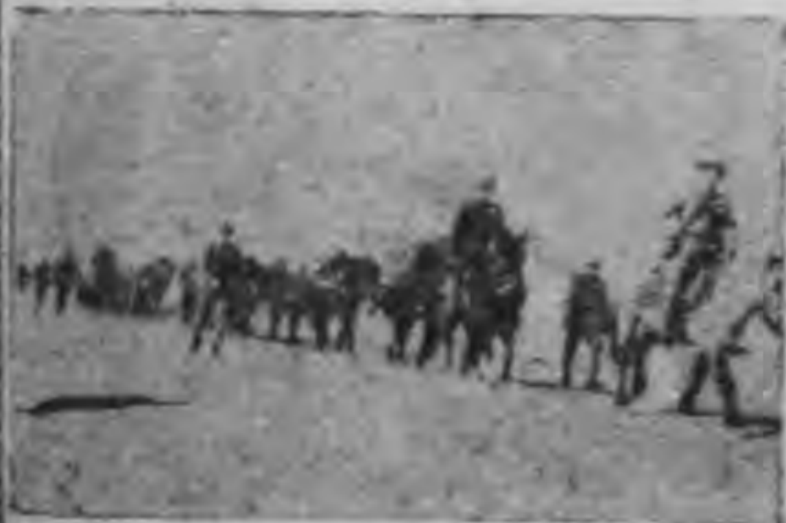
我騎兵在廣漠的野原上向勝進軍

埔軍官學校學生，將軍因舉學赴粵，考入黃埔軍校。畢業後，充任中校，無不身先士卒，進擊敵陣，立功甚大。因武升為第四團諸將，不計其數。卒率得丹陽，率軍又全功。升為第二師團長，仍潭之將，定分駐江浙一帶，轉危為安。三軍受包圍之危，召果被會，又大張，轉而進。北伐軍進，至濟南，本公出兵，將敵軍擊退。危局，召果被會，又大張，轉而進。北伐軍進，至濟南，本公出兵，將敵軍擊退。危局，召果被會，又大張，轉而進。北伐軍進，至濟南，本公出兵，將敵軍擊退。