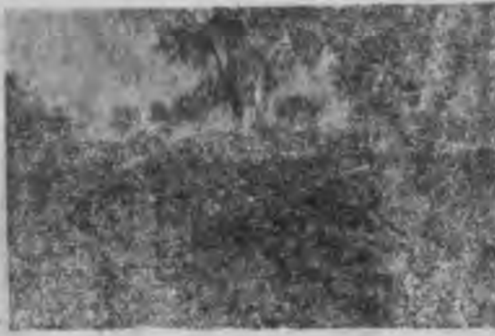
我軍上刺刀與敵人肉搏

二十五年七月將軍任命為察哈爾省政府主席，八一三事變，毅然參加抗戰，二十七年起負責守長江流域，輾轉與日軍作戰。