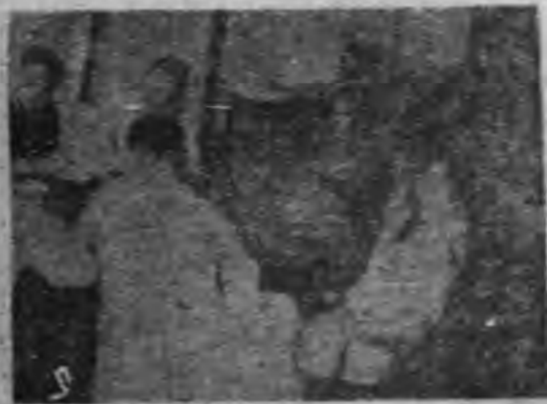
張將軍與外國記者見面

二十二年起，他開始被委為第四路軍湘，鄂，閩，贛，粵省諸的北區剿匪總司令。十六年七月又任京滬區警備司令，同年八一三事變，將軍兼任京滬區司令，在上海負責軍事工作。迨我軍西撤，將軍也率部退至蘇南，擔任該區主席。一直到廿七年冬為止。嗣被任命為軍事委員會政治部主任，襄助委座推進軍政工作，頗有建樹。現在將軍奉命為第三軍接生委員，並任委員長兼北行營主任，我人於將軍開發今後之東北前途，深致殷切的厚望。