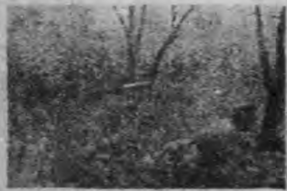
據延候侍人服者向據機的情無事無