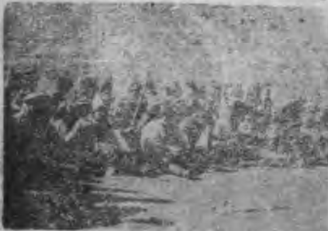
趙倜將軍在敵後工作

趙將軍不但是一位果敢的武將，且是個能執筆為文的作家，那本「怎樣和日本爭鬥和收復我們失土」的抗日書寫作者，就是我們的趙倜將軍。