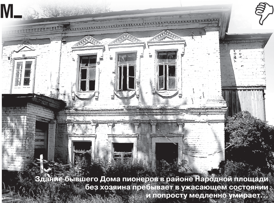
Здание бывшего Дома пионеров в районе Народной площади без хозяина пребывает в ужасающем состоянии и попросту медленно умирает.