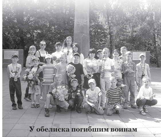
У обелиска погибшим воинам

В июне на станции детского и юношеского туризма и экскурсий работал оздоровительный лагерь с дневным пребыванием для детей с 6,5 до 14 лет под названием «Остров Робинзона».