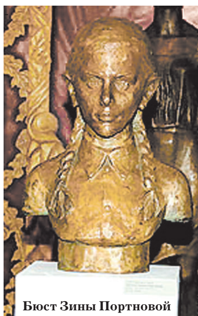
Бюст Зины Портновой

Первого июля в Москве, в Центральном музее Великой Отечественной войны на Поклонной Горе, был установлен и презентован еще один бронзовый бюст Героя Советского Союза - Зинаиды Портновой. Она самая юная из всех девушек и женщин, которые получили это высокое звание за боевые действия. Зина Портнова была партизанкой и погибла в 1944 году, ей было 16 лет, когда ее расстреляли нацисты.