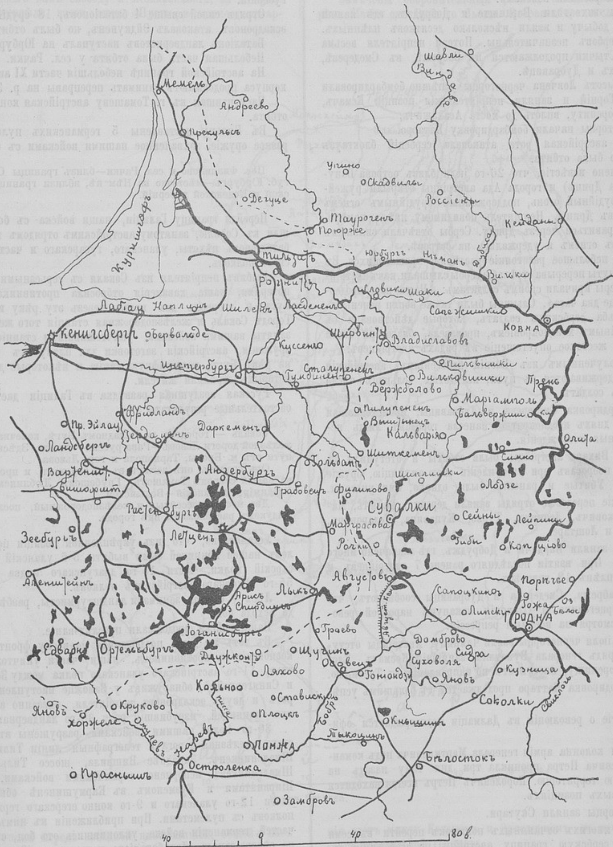
Карта пограничнаго пространства съ Восточной Пруссіей.

Изъ города на огонь судовъ отвѣтили нѣсколькими ружейными выстрѣлами. Тогда австро-венгерскія суда открыли сильнѣйшій огонь противъ города и его окрестностей, повредивъ и разрушивъ много домовъ. Затѣмъ огонь былъ