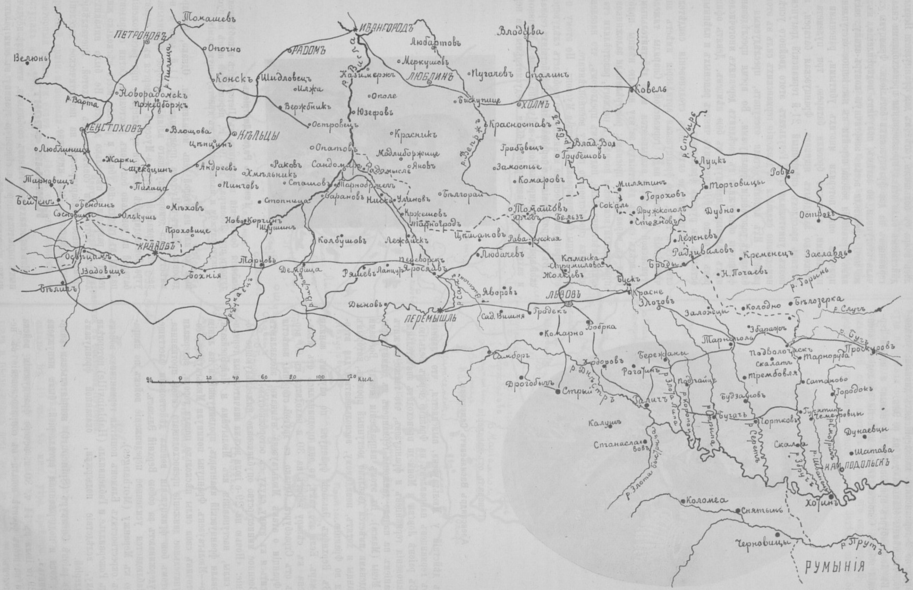
Карта пограничнаго района съ Австро-Венгріей.