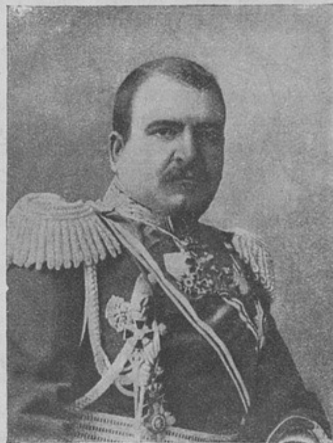
Генераль Радко Дмитріевъ.

Въ предположеніяхъ о первоначальныхъ дѣйствіяхъ германской арміи, бомбардировка Понтъ-а-Муссона (Pont-à-Mousson) и захватъ нансійскаго района были предусмотрѣны на пер-