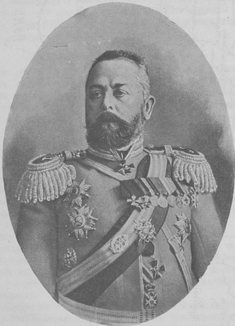
Генераль отъ-кавалеріи Александръ Васильевичъ Самсоновъ.

Въ Люксембургъ прибываютъ все новыя и новыя германскія войска. Сопоставляя это извѣстіе съ ходомъ воен-