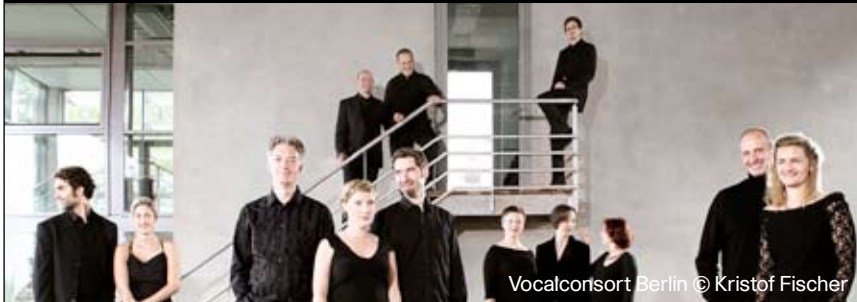
Vocalconsort Berlin

M LOCKE Consort in F uit 'Consort of Fowre Parts'