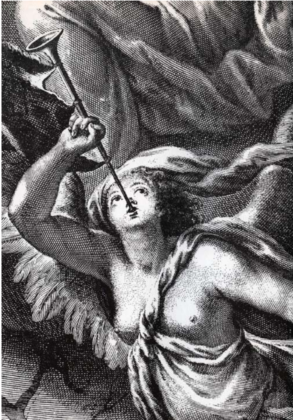
Gravure met musicerende engel.