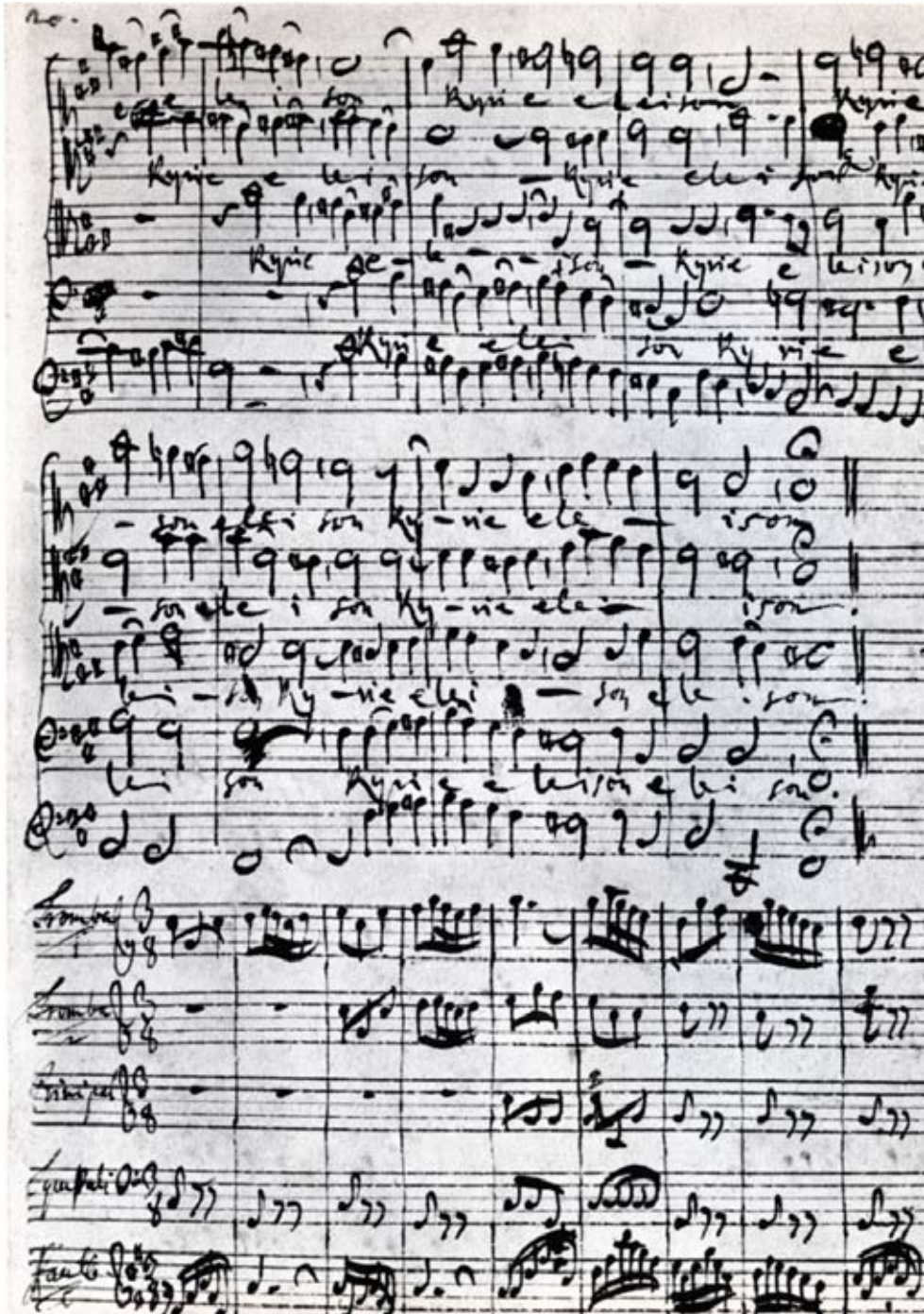
Fragment van een mis in het handschrift van Johann Sebastian Bach.

Dat de 'culturele mutant' Bach de rijke muzikale traditie met zich meedroeg, blijkt uit het grappige verhaal van het 'maanlichtmanuscript'. Na de dood van zijn ouders ontfermde Bachs veertien jaar oudere broer Johann Christoph Bach zich over Johann Sebastian. Johann Christoph had gestudeerd bij niemand minder dan Pachelbel in Erfurt en was er zelfs korte tijd organist van de Thomaskirche geweest. Johann Christoph was een uitmuntend muzikant en beschikte over een uitgebreide muziekbibliotheek. Bachs oudste zoon - Carl Philipp Emanuel Bach - nam de volgende