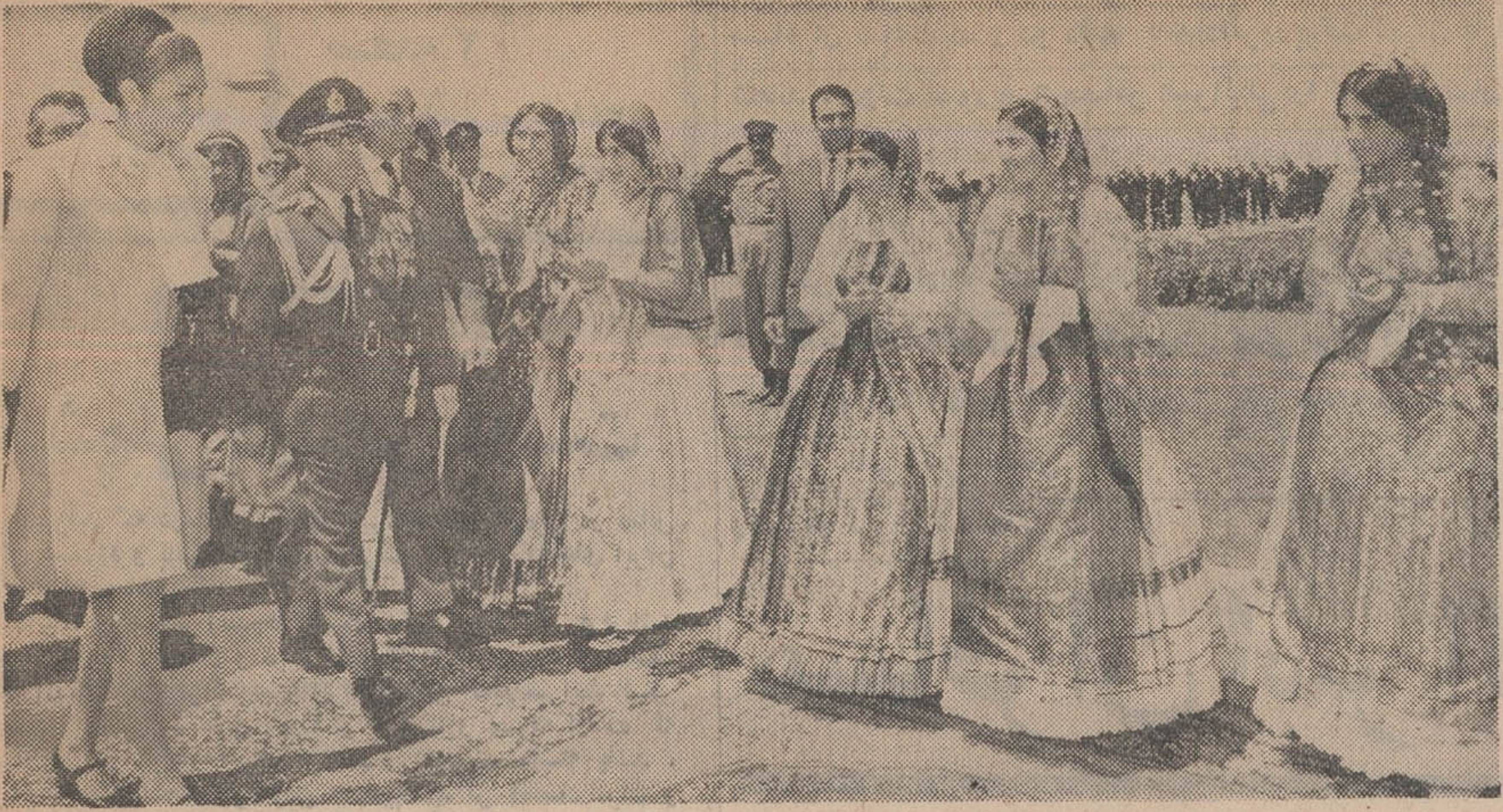
شهبانو در فرودگاه شیراز مورد استقبال مقامات عالیترتبه کشوری و محلی قرار گرفته و پس از انجام تشریفات رسمی از مقابل صفوف طبقات مختلف مردم که برای استقبال به فرودگاه آمده بودند، گذشتند این عکس هنگامی برداشته شده که علیاحضرت شهبانواز مقابل صف دختران وزنانی که لباس محلی پوشیده اند عبور می نمایند. تیمسار سپهبد ضرعغام فرمانده ارتش سووم نیز افتخار حضور دارد.