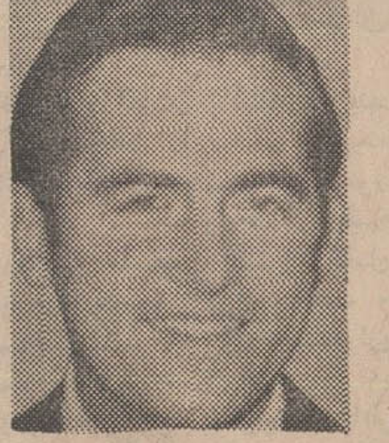
کنستانتین فرمانده نیروهای موشکی شوروی گفت: