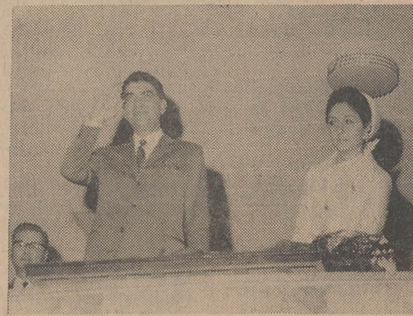
مسابقه شب پایان در حضور والاحضرت شاهپور غلامرضا پهلوی ریاست عالی کمیته ملی المپیک ایران و همسرشان والاحضرت عزیزه پهلوی انجام شد.

کمیته، دیدارهای سخت و دشوار همه جانبه از ماه ها پیش شکل در پیش نداشته است و اصولا در کلی تیم را در یک فرم دلخواه و آمادگی کامل حفظ کنیم. سابقهات قهرمانی ایران در حالی انجام شد که تیم تهران از کلیه فری آنها کمتر بنظر میرسد. تیمهای ما آمادگی نداشتند و این بعلمت آنستکه والیبالیستون ما طول سال گذشته اگر مسابقات آگاهی و شناختی که روی تیم تهرانمانی باشکاه را فراموش میمان داریم و در سایه یک تدارک فراموشی شد.