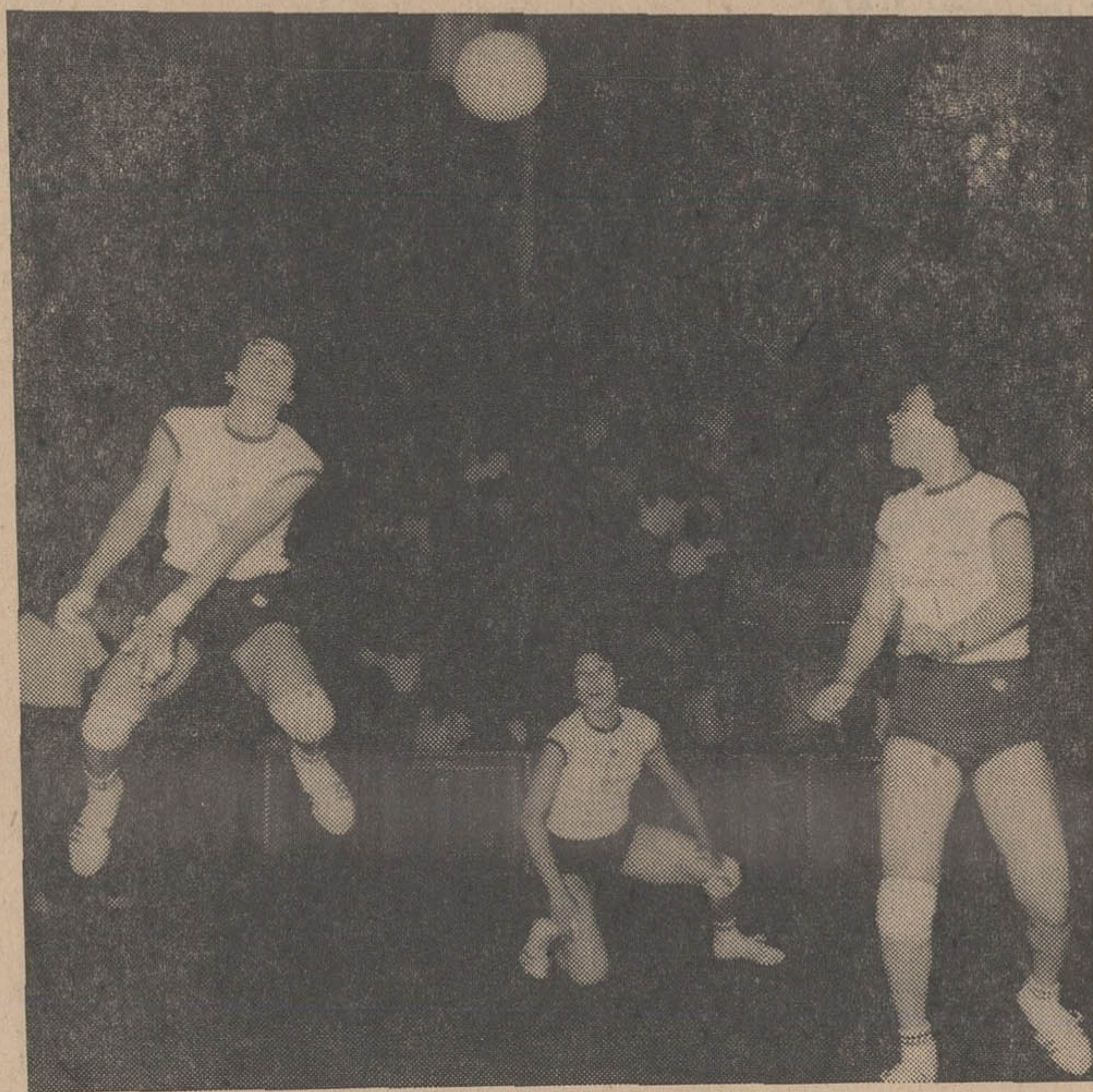
بازیکنان تیم «نیچو» ژاپن با خصوصیات خوب جسمانی، انعطاف پذیری و قدرت فراوان در حالیکه از مهارت های فردی و آهنگ دستجمعی برخوردار میشدند تیمی با ارزش بوجود آورده اند، این صحنه ایست از تلاش بازیکنان حرفه در میدان.

دربازیهای آسیایی ۱۹۵۸ در توکیو تیم والیبالیست مردان ایران در حالی عنوان دوم را بدست آورد که مقابل ژاپن ۲-۱ مغلوب شد. (در آن زمان بازیها مجموعا در سه گیم انجام میشد). آنهم در حالی که گیم سرنوشت امتیازات ۱۴ به ۱۴ بازیکن سالخورده به نام کاتسومی- رسید.