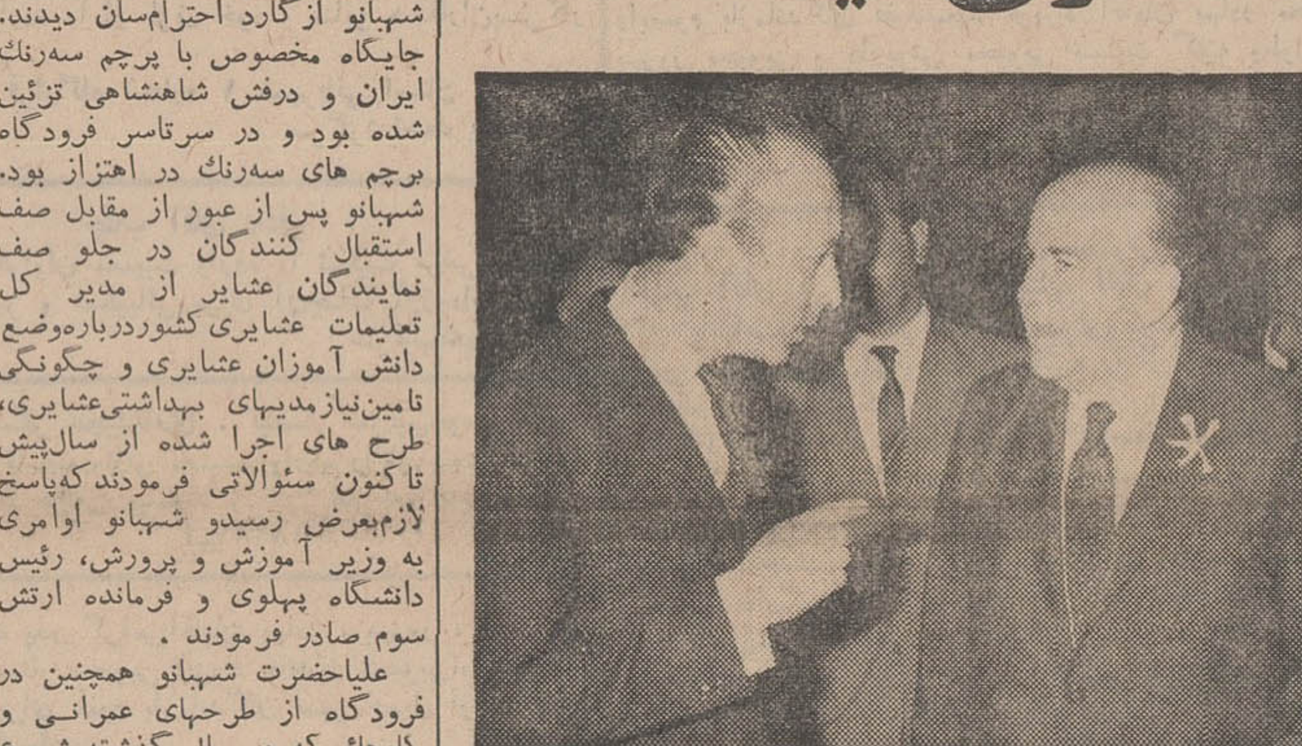
آقای هویدا نخست وزیر ایران در فرودگاه مهرآباد مورد استقبال اعضای کابینه و شخصیت های مملکتی قرار گرفت. عکس آقای نخست وزیر را هنگام گفتگو با آقای منصور وزیر اطلاعات نشان میدهد.

نخست وزیر ازمسافرت ۱۲ روزه خود مراجعت کرد