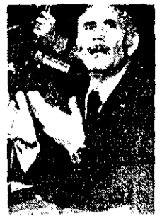
شاه فیاض الحق

اسلام آباد - آسوشیتدپرس - رهبران پاکستان و افغانستان دیروز توافق کردند که همکاری گسترده برای مبارزه با تروریسم و مبارزه با قاچاق مواد مخدر و سایر تهدیدات مشترک را آغاز کنند. رهبران پاکستان و افغانستان دیروز توافق کردند که همکاری گسترده برای مبارزه با تروریسم و مبارزه با قاچاق مواد مخدر و سایر تهدیدات مشترک را آغاز کنند.