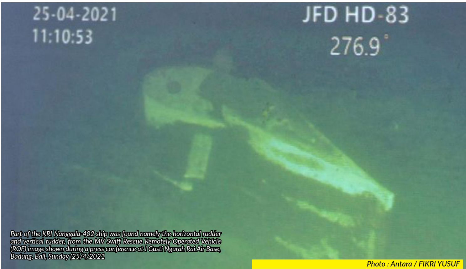
Part of the KRI Nanggala-402 ship was found namely the horizontal rudder and vertical rudder, from the MV Swift Rescue Remotely Operated Vehicle (ROF) image shown during a press conference at I Gusti Ngurah Rai Air Base, Badung, Bali, Sunday (25/4/2021)

At 03.00-03.30, the bow deck and conning tower of KRI Nanggala-402 are still visible to the sea rider tracking team within 50 meters. After that, at 03:30, the other KRI occupied the position to check the torpedo warning.