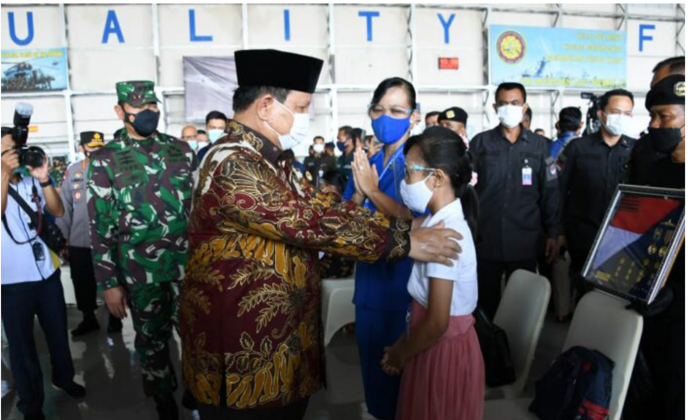
Menteri Pertahanan (Menhan) Prabowo Subianto saat bersilaturahmi dengan keluarga prajurit TNI AL ABK KRI Nanggala-402 di Hanggar 2 Bandara Juanda, Surabaya (Kamis, 29/04).

Seperti diketahui SMA Taruna Nusantara merupakan sekolah menengah atas berasrama yang berada di Kabupaten Magelang, Jawa Tengah. Sekolah ini juga berbasis semi-militer, sangat dikenal