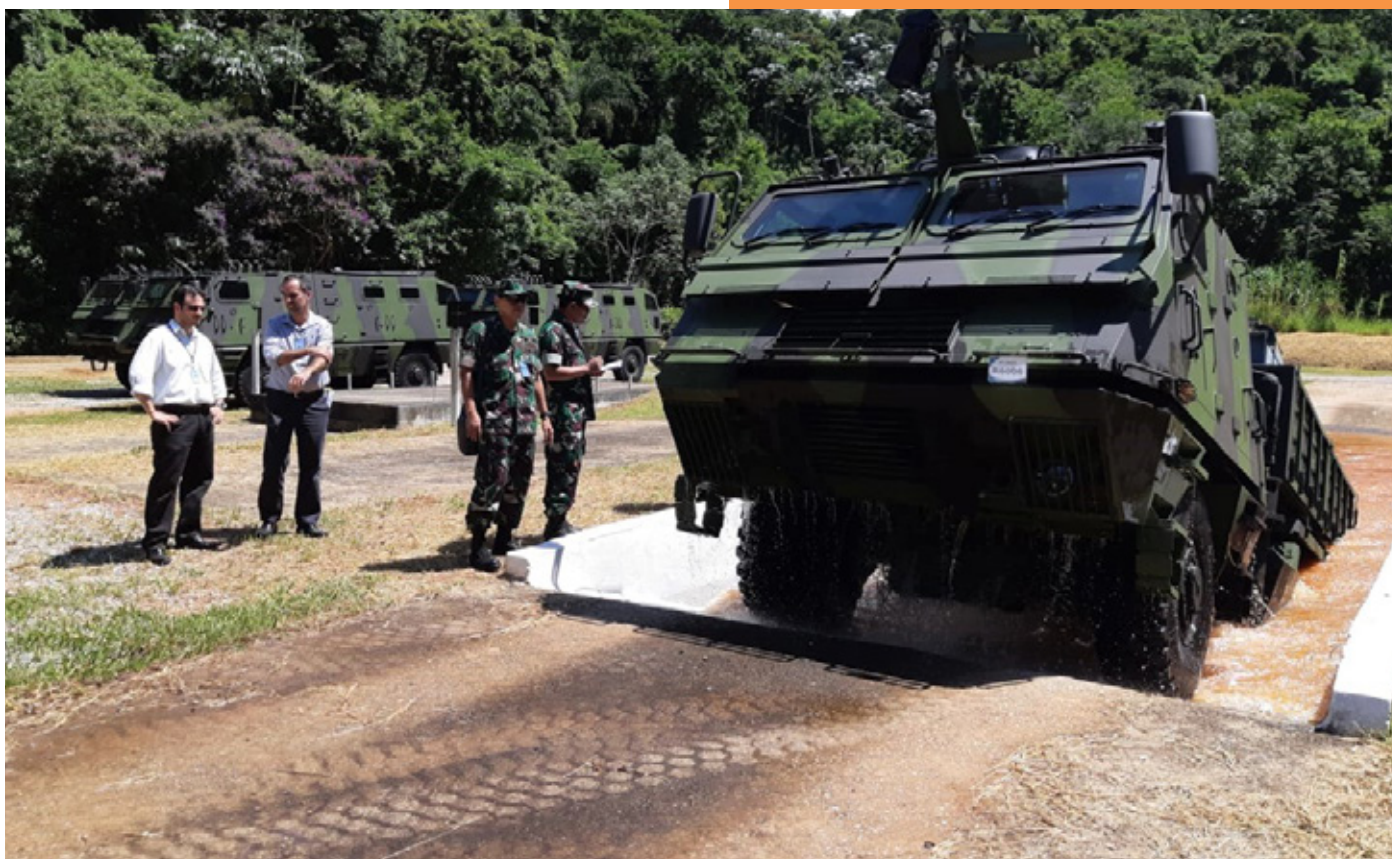
Avibras MLRS eligibility certification

Third, the Airworthiness Division ( Bidlaikud ), is tasked with implementing the Alpalhankam eligibility certification and the Alpalhankam facilities for air vehicles used to support national defense. Bidlaikud is an airworthiness authority that represents the government and the state, which is internationally known as the Indonesian Military Airworthiness Authority (IMAA) .