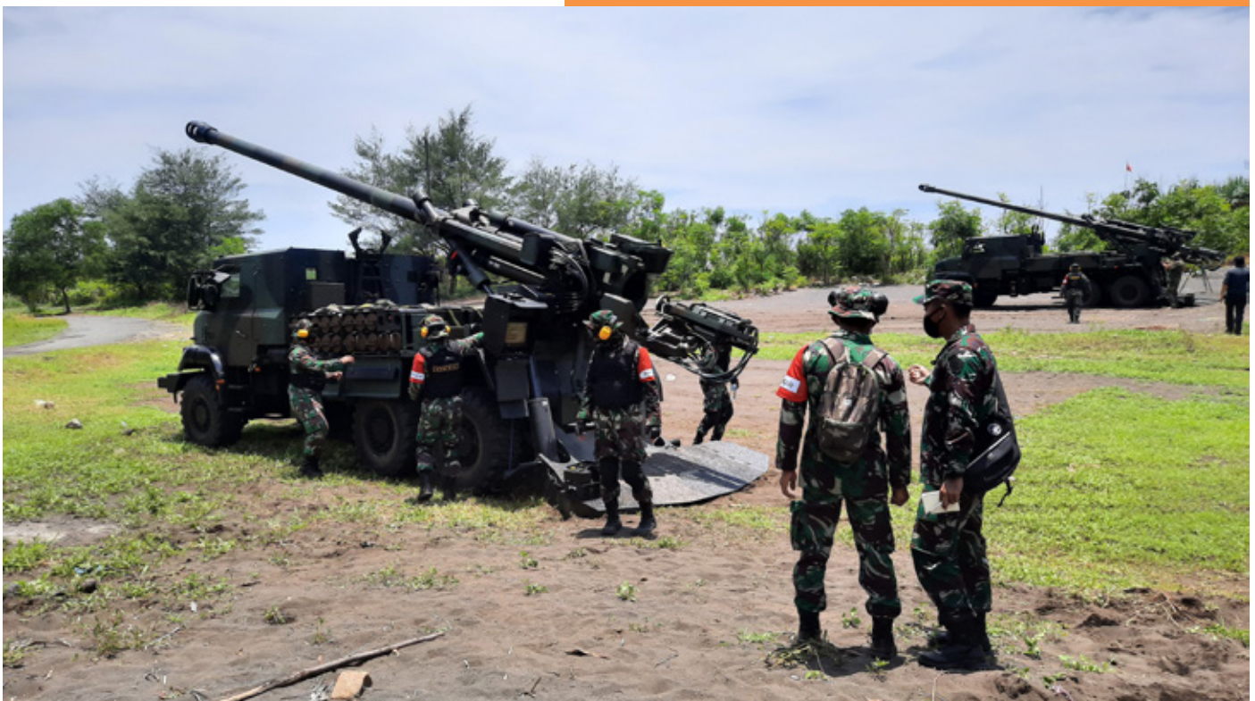
Certification of the Cal.155 mm Caesar cannon

Indhan's development is closely related to a country's eligibility institution, both of them are like two sides of a coin that cannot be separated and