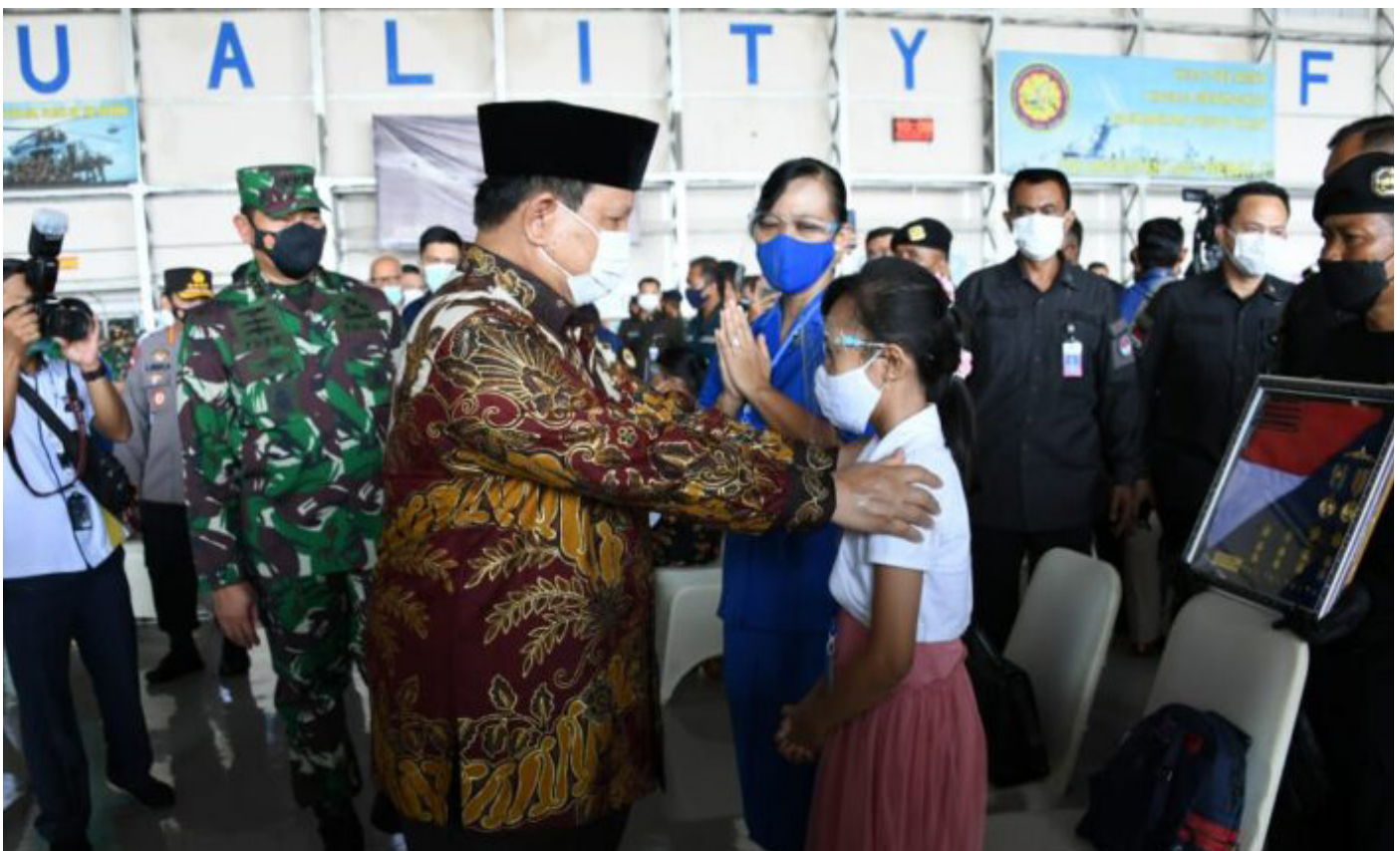
Minister of Defense (Menhan) Prabowo Subianto during a meeting with the families of Indonesian Navy soldiers ABK KRI Nanggala-402 at Hangar 2 Juanda Airport, Surabaya (Thursday, 29/04).

Meanwhile, for the sons and daughters of KRI Nanggala-402 crew who are currently going to college level, Minister prabowo Subianto has also instructed the Defense University (UNHAN) to allocate a place for them.