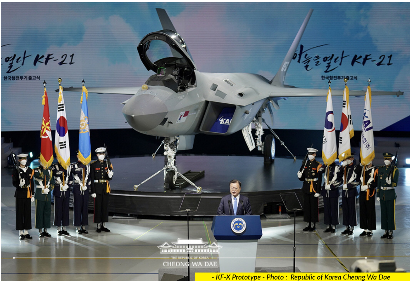
Roll-Out Ceremony of the next generation KF-X / IF-X fighter jet prototype in South Korea.

aircraft to meet the needs of defense equipment in the form of combat aircraft of the two countries within the next 30 to 40 years.