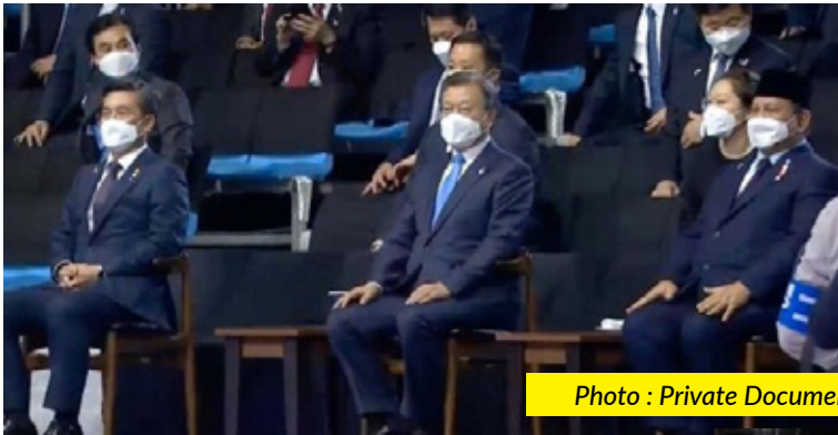
Minister of Defense of the Republic of Indonesia Prabowo Subianto on Friday (9/4), attended the Roll-Out Ceremony of the KF-X / IF-X next generation fighter jet prototype in South Korea