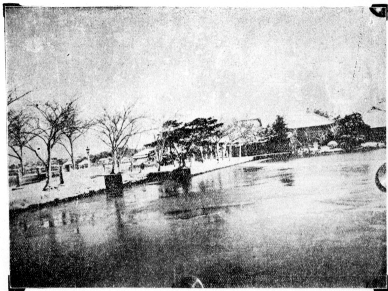
圖之池忍不京東本日