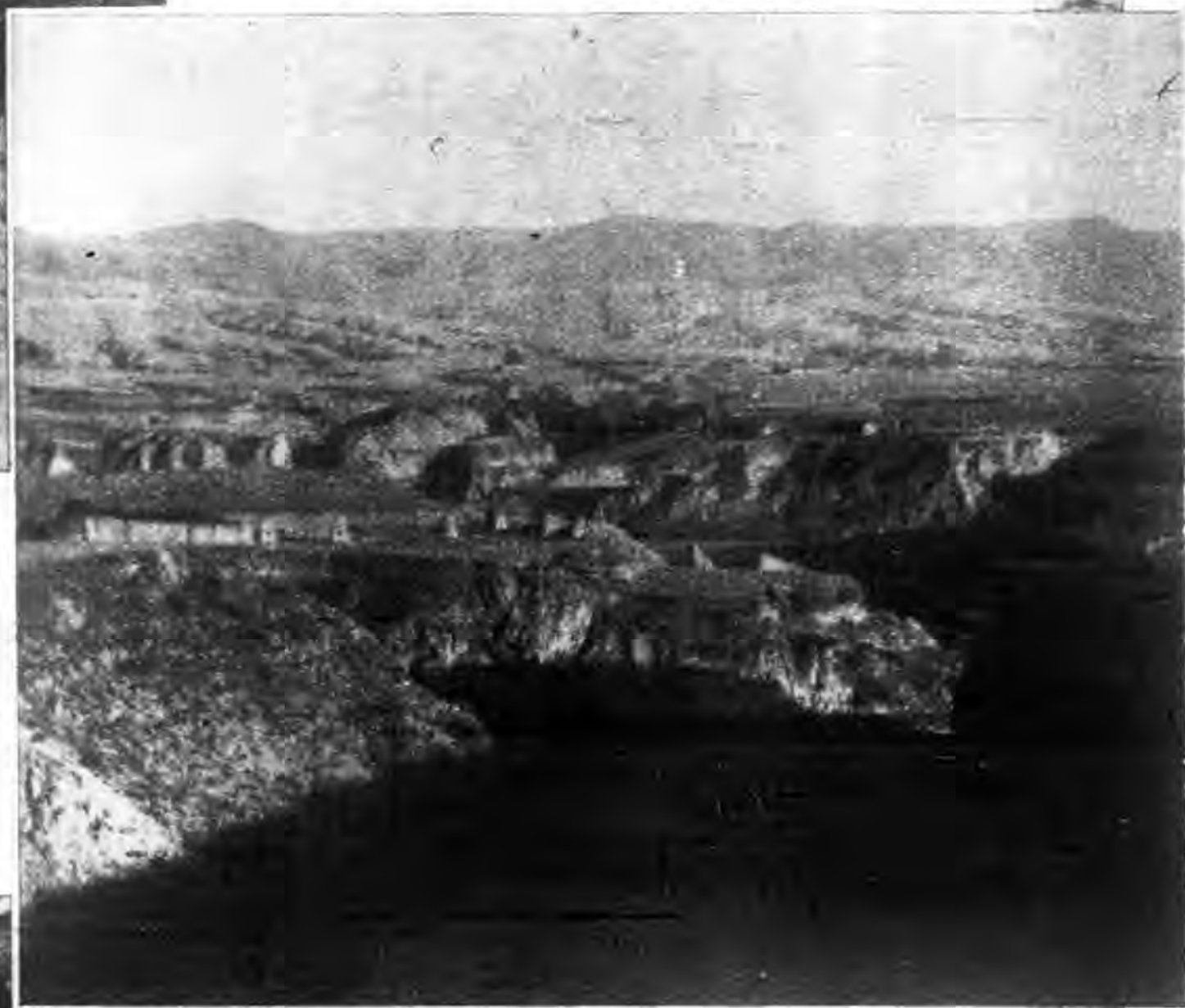
山西省內黃河一曲