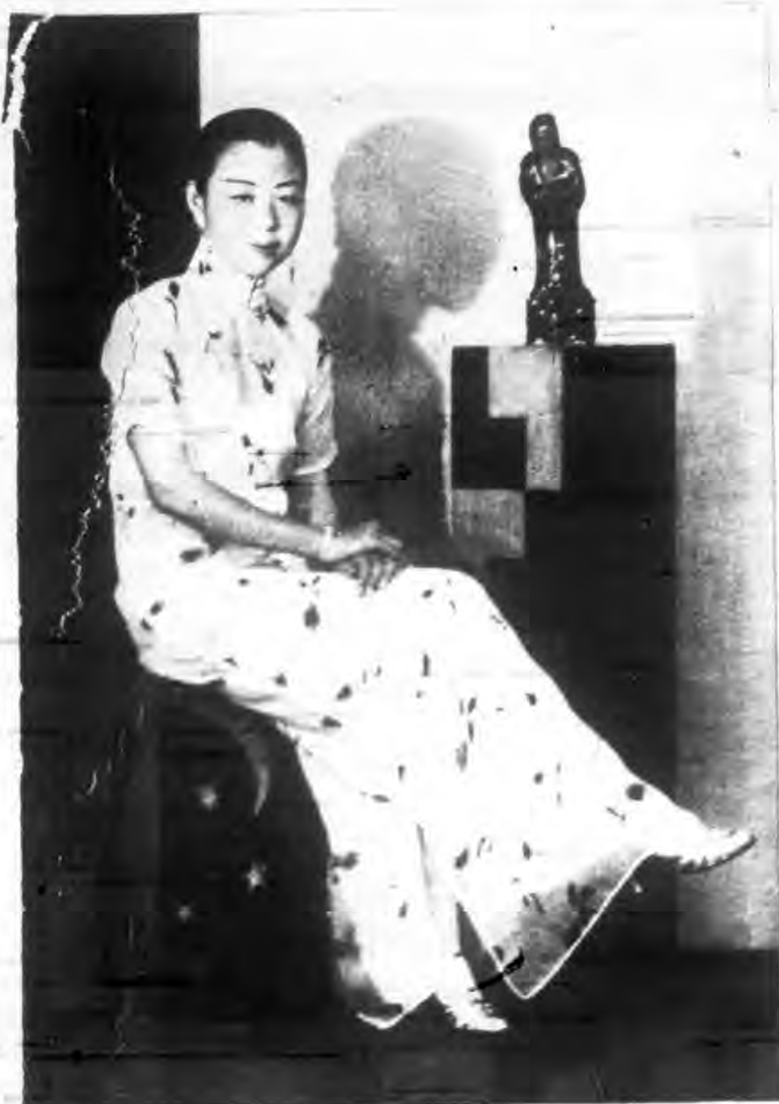
贈光 手助師醫真惠林為現士女瑞瓊鄧都成