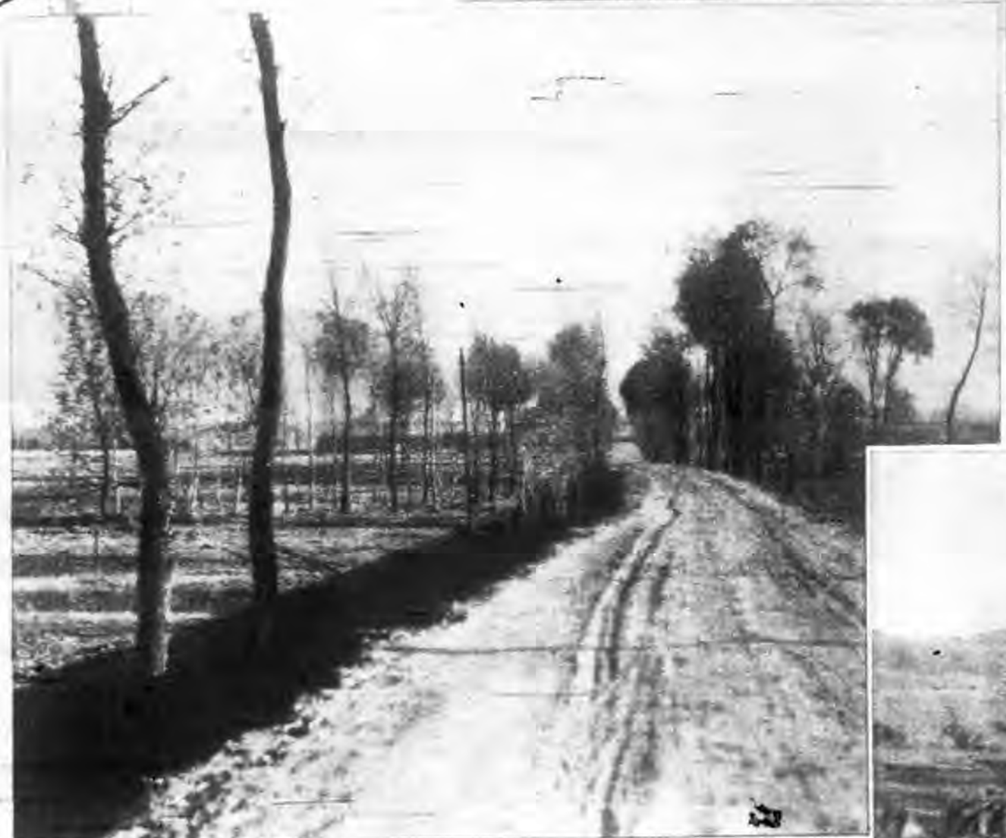
自太原赴河邊村中途