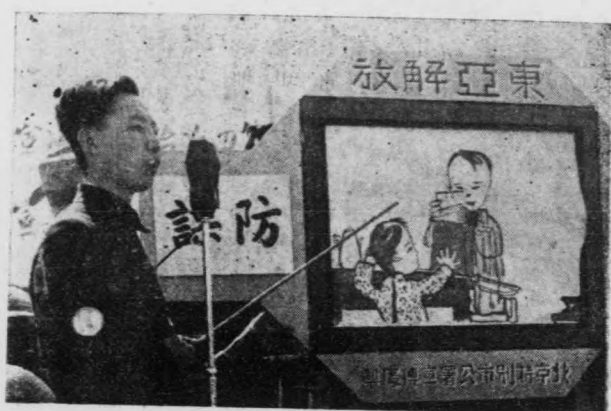
圖爲「防諜」布戲之表演

抱定謹言審聽之宗旨，則間諜雖狡，亦無由施其巧技，語云，牆有風壁有耳，可見一言一語均有洩漏消息之可能，如果對於不知來歷之人緘口不談時事，或只談正式公布之消息，則敵人間諜行爲自不能收其效，此就積極的防諜辦法而言，至於消極的辦法，對於敵人希圖擾亂後方，而故意散布之無稽謠言，不予輕聽，所謂流言止於智者，則間諜之企圖，亦可無形解消，總而言之，謹言審聽四字，誠爲防諜之不二法門，本局同人務須謹守此四字埋頭工作，是所厚望。