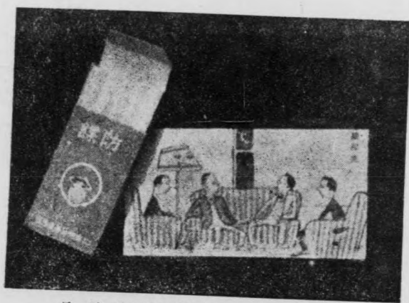
品傳宜捲烟「諜防」為圖

記，不可忽視，本席今日特加補充如下（一）消極防諜應不聽謠言，不傳謠言，在間諜方面造謠生事，無非擾亂後方起見，如有一人傳述謠言，即不啻為間諜宣傳，並宜考查謠言來源，報告長官，此宜切寔警戒者，（二）積極防諜，即在從事同人社會上接近人士，必多在隨地隨時考察，如確有可疑者，務努力檢查與發，以盡吾輩責任，不能袖手旁觀者，（三）依工務員服務令規定，公文應守秘密，在本處為市政中樞，各局處決定之件，進行之案，均應各守秘密，不為間諜所利用，此尤為防諜之惟一要訣，今後本席責成各室科領袖，勵行此令即是防諜之一道，切望同人互相勉勵，共展防諜網，以作人民表率云。