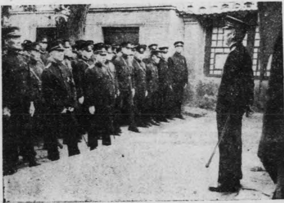
圖爲警務分長召集所屬訓話時情形

，所以防諜工作，實與治運及大東亞戰爭有極密切之關係，希望各界市民，一致協力去做云。