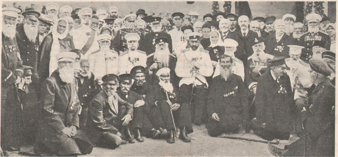
Изъ 50-лѣтію Севастопольской обороны. Его Императорское Высочество Великій Князь Александръ Михайловичъ среди севастопольскихъ ветерановъ.

Небольшое наслѣдство Грановскаго объясняется, какъ мы уже говорили, еще и тѣмъ, что онъ слишкомъ рано умеръ. На Грановскомъ еще разъ сказались грустный фатумъ, тяготящій надъ лучшими русскими людьми: почти всѣ они рано умирали, не свершивъ и половины того, что могли бы свершить.