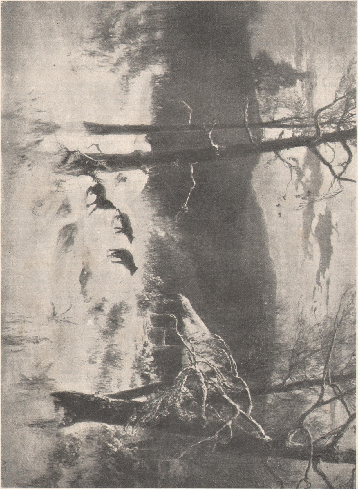
Серенада. Картина М. А. Берноса. (Выставка картин Товарищества Художниковъ). Арт. «Нива».