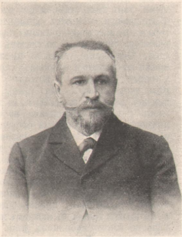
Проф. М. Курловъ, ректоръ томскаго университета.