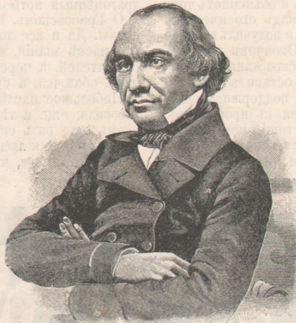
Т. Н. Грановскій. По поводу 50-лѣтія дня кончины.

Блестящій лекторъ — блестящій, несмотря даже на нѣкоторые недостатки произношенія и тихій голосъ, онъ увлекалъ свою аудиторію мастерскимъ изложеніемъ предмета, художественностью рѣчи и совершенно новыми научными приѣмами. До Грановскаго научное преподаваніе исторіи сводилось къ простому пересказу событій или къ одностороннимъ тусклымъ характеристикамъ отдельныхъ историческихъ личностей. Грановскій же приводилъ въ восторгъ слушателей яркою индивидуальностью своихъ собственныхъ взглядовъ на историческія событія, острымъ критическимъ анализомъ, а, главное, своимъ удивительнымъ умѣньемъ создавать