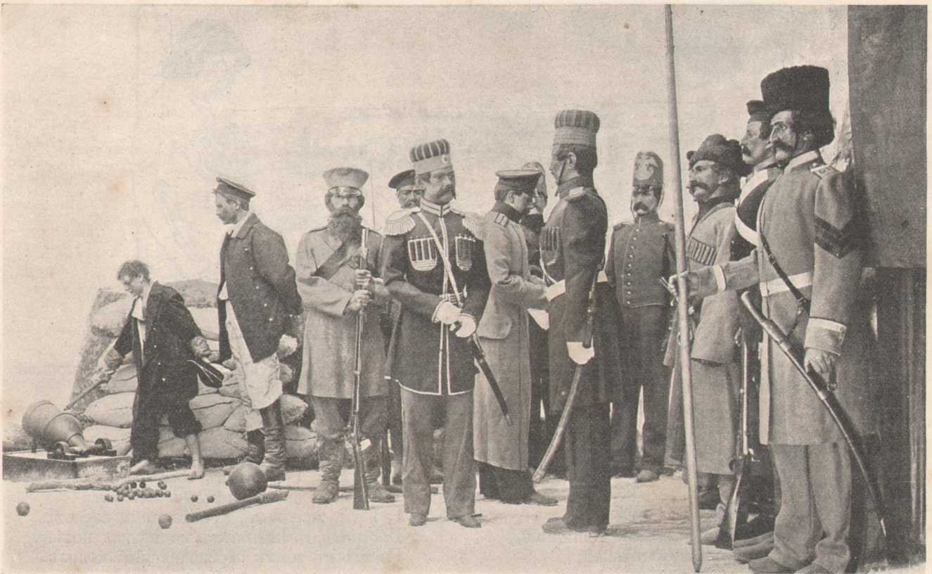
Герои Севастопольской обороны—офицеры и нижние чины в исторических костюмахъ.

держалось убеждение, что в послеродовомъ периодѣ самыми опасными врагами роженицъ являются... чистота и свѣжая вода; вотъ почему родильная горячка, встречающаяся теперь, какъ исключеніе, была самымъ обычнымъ явленіемъ въ сравнительно недавнее время. Въдъ только въ 1860 году талантливый, къ сожалѣнію, очень рано похищенный смертью, д-ръ Земмельвейсъ впервые высказалъ мнѣніе, что родильная горячка принадлежитъ