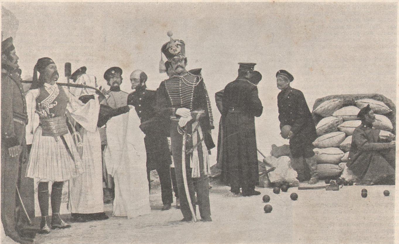
Герои Севастопольской обороны—офицеры и нижние чины в исторических костюмахъ.

къ числу инфекціонныхъ болѣзней. Въ то время, однако, извѣстнѣйшіе медицинскіе авторитеты, между прочимъ, и самъ Вирховъ, только начинавшій еще пріобрѣтать имя, съ обиднымъ пренебреженіемъ отнеслись къ работамъ молодого врача и осмѣивали его «сумасбродныя идеи». Хотя Земмельвейсъ и окончилъ свои дни въ домѣ для умалишенныхъ, однако справедливость его «сумасбродной идеи» была впоследствии блестяще доказана цѣлымъ рядомъ на-