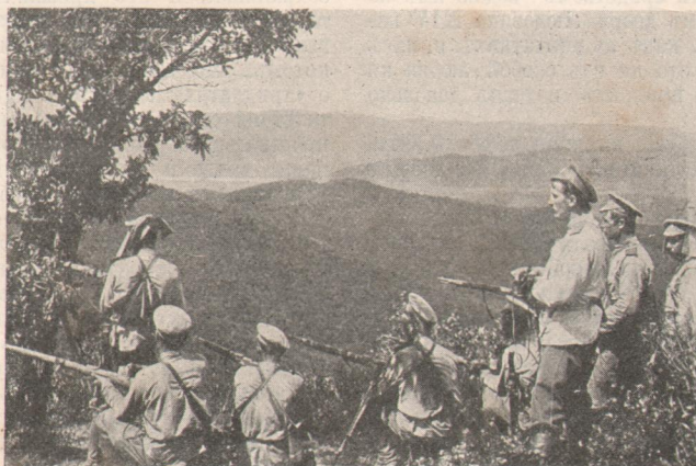
В авангардъ 3 Сибирскаго армейскаго корпуса, во время наступления японцевъ. Охотники 22 Восточно-Сибирск. полка стрѣляютъ по неприятельскому посту.