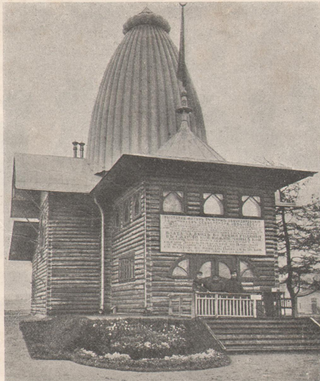
Юбилейная выставка въ память 50-лѣтія Севастопольской обороны. Видъ зданія выставки въ саду Народнаго дома Императора Николая II, въ С.-Петербургѣ.

А какъ лѣчились въ доброе старое время? Наиболее употребительнымъ, такъ сказать, универсальнымъ средствомъ, полагавшимся отъ всѣхъ болѣзней, было кровопусканіе, практиковавшееся повсемѣстно въ Европѣ до первой половины прошлаго столѣтія. При пораненіяхъ всякаго рода лучшимъ перевязочнымъ матеріаломъ считалась паутина, въ цѣлительную силу которой наши крестьяне, между прочимъ, вѣрятъ и до сихъ поръ. Далѣе, прочно