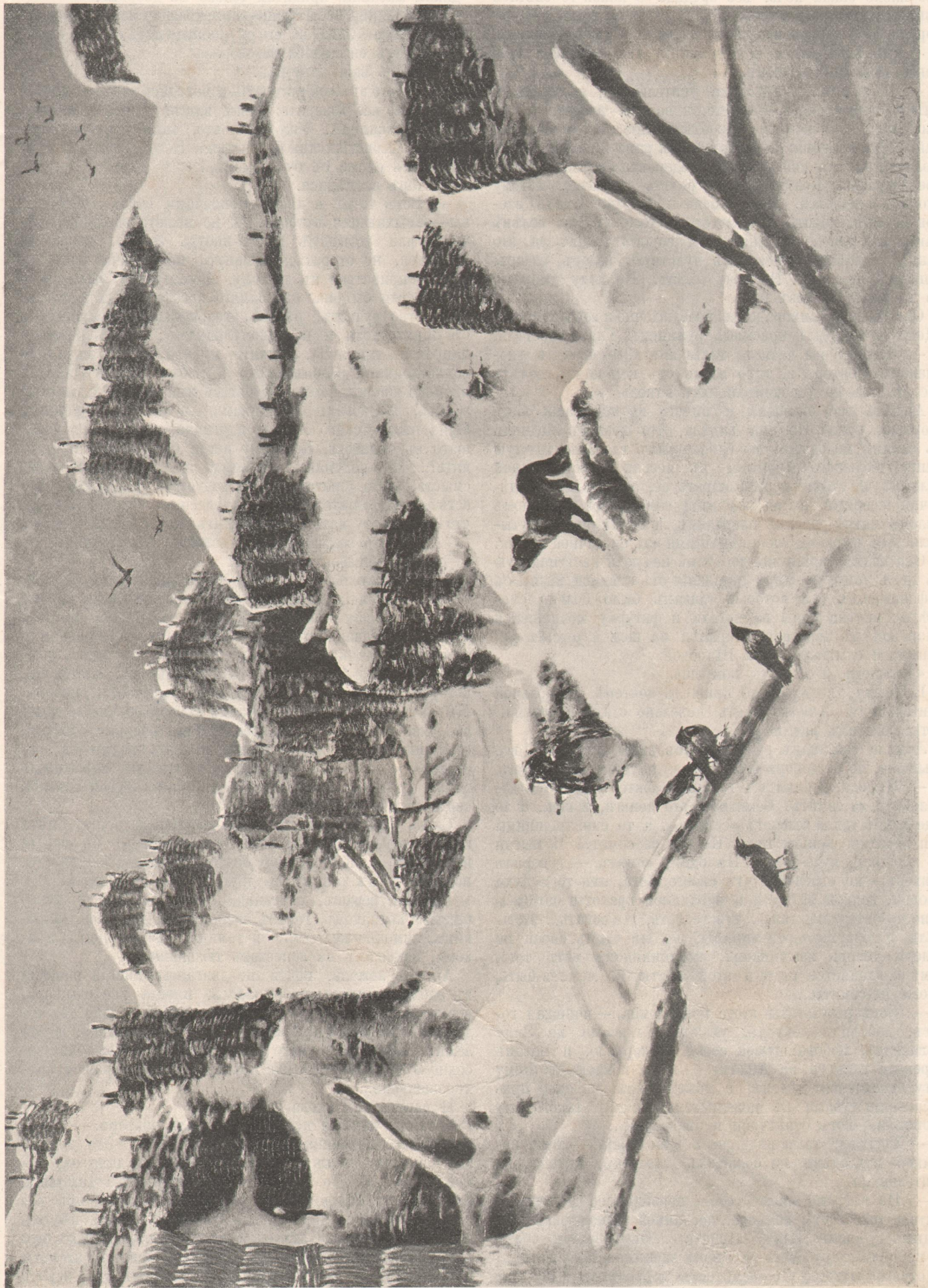
Здесь бой кипит. Картина М. Малышева (XIII выставка СХБ. Общества Художников), авт. «Нивы»