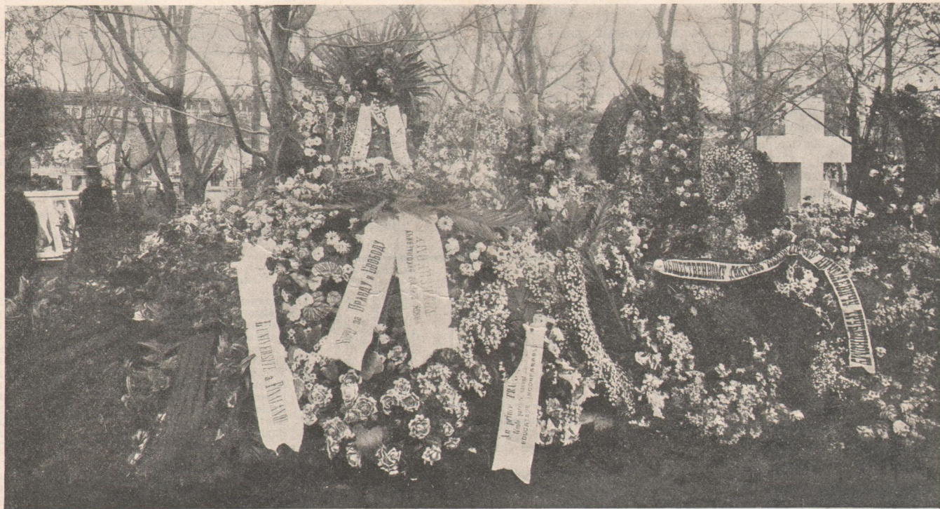
Могила князя С. Н. Трубецкаго на кладбищѣ Донскаго монастыря въ Москвѣ.