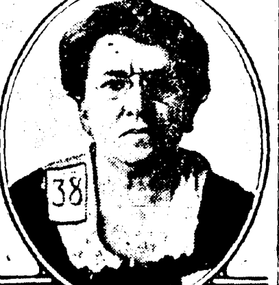
ALEXANDER BERKMAN, and EMMA GOLDMAN, Deported by U. S. Department of Justice as Leading Spirits in Communism Plots.