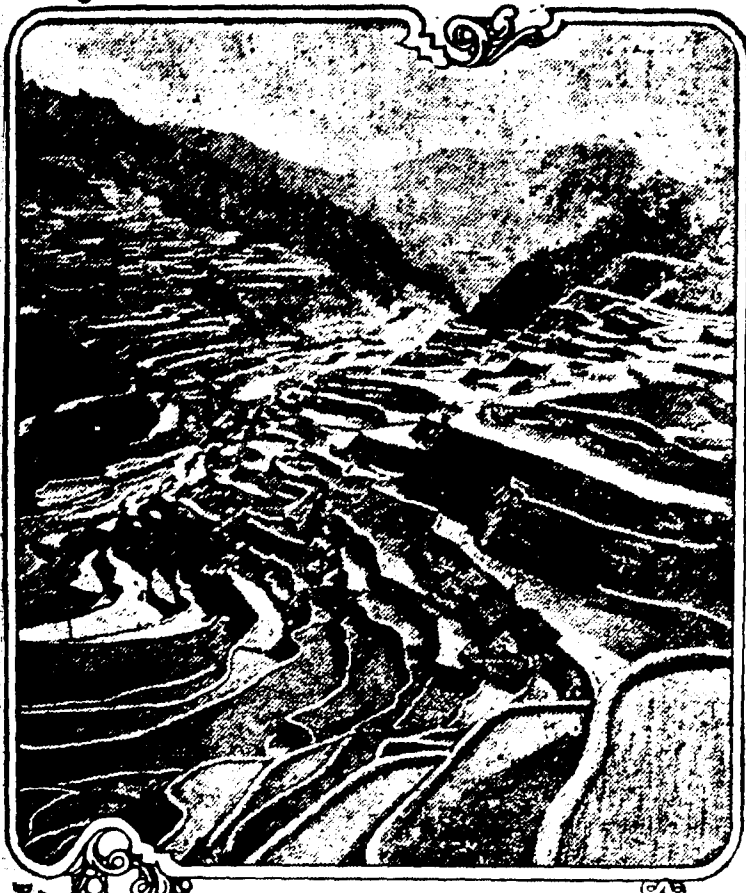
This is a photograph of the Ifugao Igorrot rice terraces, which are among the most remarkable of their kind in the world. They are one of the many marvelous sights for the tourist to see in the Philippine Islands and are to be found in the Ifugao district of the Mountain Province, Northern Luzon.