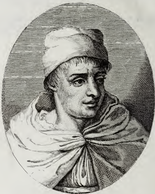
D. Lorenzo Monaco