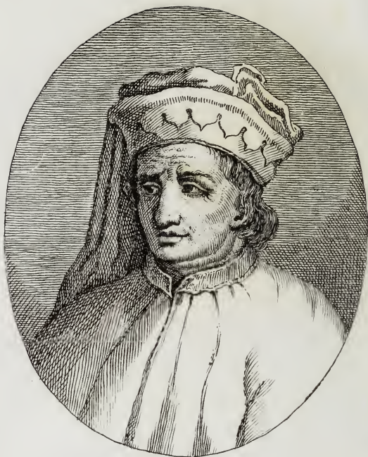
Jacopo di Casentino