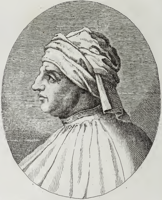
Tomaso detto Giottino