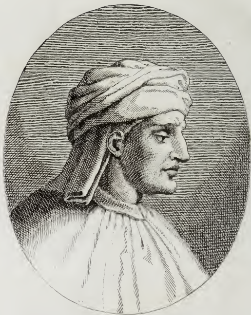
Lorenzo di Bicci