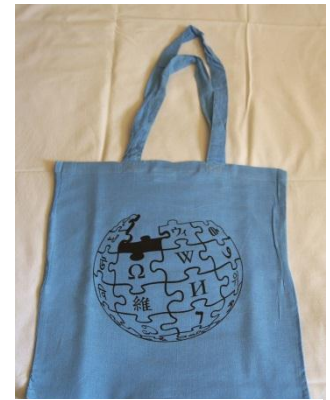
2. ábra Az egyik új wikipédiás bevásárlótáska

Folytatódott a munka a wikipédiás ajándéktárgy-készletünk felfrissítésére. Az ajándéktárgyak – köztük kitűzők, bevásárlótáskák, és jójók – március végére készültek el és eseményeinken, illetve versenyeinken díjként osztjuk el őket.