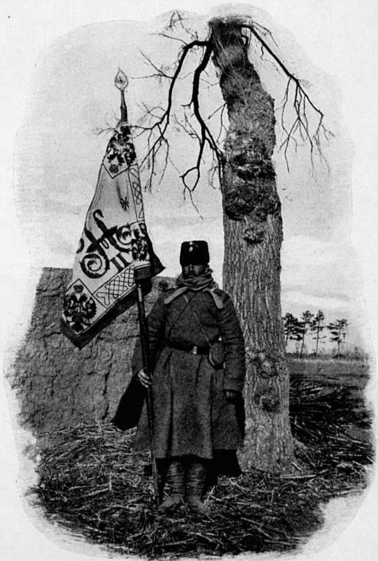
ЗНАМЯ 1-ГО ВОСТОЧНО-СИБИР. СТРѢЛК. ЕГО ВЕЛИЧЕСТВА ПОЛКА, ... Въ послѣднемъ бою (подъ Мукденомъ, у д. Цинванче) особенно отличился первый Его Величества стрѣлковый полкъ, весь поголовно состоящій изъ героевъ. Граната неприятеля сшибла со знамени полка наконечникъ, изображающій двуглаваго орла, но мы надѣемся что это мѣсто гордо займетъ георгіевскій крестъ...» (Изъ телег. П. Орловца въ «Русь», № 49).

Помнится, около половины ноября прошлаго года, въ вагонъ № 414, гдѣ я жилъ съ офицеромъ 1-го Читинскаго казачьяго полка В. К. Шнеуромъ, вошелъ человекъ одѣтый въ валенки, сѣрый тулупъ безъ погонъ и черную папаху, рѣзко отгнѣявшую его бѣлое, еще не загорѣлое и не обвѣтренное лицо съ голу-