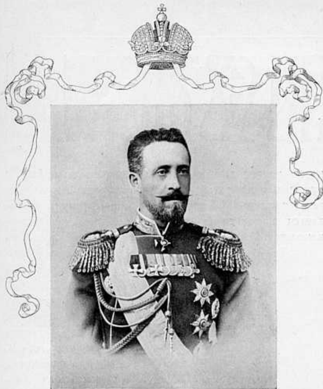
АВГУСТѢЙШІЙ ПРЕДСѢДАТЕЛЬ ОСОБАГО СОВѢЩАНІЯ ПО ВЫРАБОТКѢ ПОЛОЖЕНІЯ О ПОСТОЯНОМЪ СОВѢТѢ ГОСУДАРСТВЕННОЙ ОБОРОНЫ ЕГО ИМПЕРАТОРСКОЕ ВЫСОЧЕСТВО ВЕЛИКІЙ КНЯЗЬ НИКОЛАИ НИКОЛАЕВИЧЪ.

отошли на югъ подъ давленіемъ нашихъ кавалерійскихъ частей, выдвинувшихся впередъ. Въ общемъ, передовые посты воюющихъ сторонъ очень сблизились. Возлѣ Паобатуня ихъ раздѣляетъ 100 шаговъ, въ другихъ мѣстахъ — 400. Тѣмъ не менѣе развѣдка чрезвычайно трудна. Японцы тщательно маскируютъ группировку своихъ силъ. Они передвигаютъ крупныя части небольшими эшелонами, смѣшиваютъ въ эшелонахъ части разныхъ дивизій, разныхъ армій; эшелоны эти двигаются съ сѣвера на югъ, съ запада на востокъ, съ востока на западъ и съ юга на сѣверъ. Получается впечатлѣніе какой-то толчеи... Но все дѣлается въ системѣ, по выработанному плану и все придетъ въ порядокъ, если имъ не помѣшать. Маскировку сосредоточенія облегчаютъ японцамъ хунхузскіе отряды, «производящіе впечатлѣніе чуть ли не полковъ регулярной арміи.» Двигаясь вдоль границы Монголіи, они представляютъ какъ бы завѣсу предъ нейтральной страной, — завѣсу, маскирующую работу японцевъ по подготовкѣ складовъ, необходимыхъ въ случаѣ желанія снова обойти нашъ правый флангъ съ той же быстротой и внезапностью, какъ подъ Мукденомъ. А на это есть, будто бы, ясныя указанія. Телеграммы настойчиво гласятъ о сосредоточеніи главныхъ силъ японцевъ противъ нашего праваго фланга. Здѣсь все подозрительно тихо, тогда какъ на лѣвомъ флангѣ, въ районѣ Чантафу—Каншинсянь—