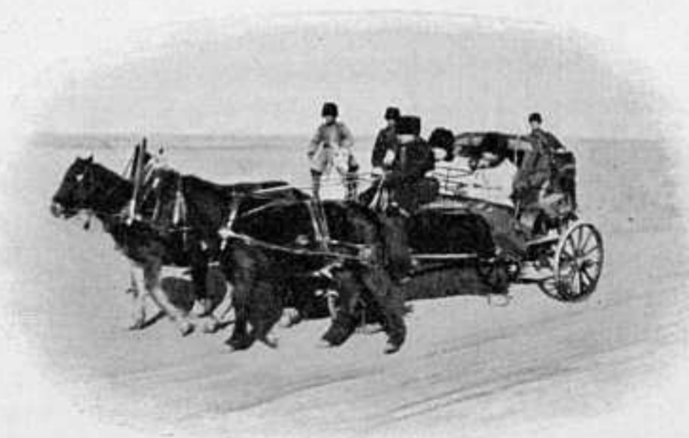
ВЫѢЗДЪ КОМАНДОВАВШАГО 2-Й МАНЧЖУРСКОЙ АРМІЕЙ ГЕН.-АДЪЮТ. ГРИППЕНБЕРГА.

«Я посѣтилъ въ Годзяданѣ санитарный Имени Вашего Высочества поѣздъ, который представился мнѣ въ безукоризненномъ видѣ, во всѣхъ отношеніяхъ, въ особенности удобны кровати и носилки. Весь персоналъ поѣзда второй годъ неустанно и съ полной энергіей работаетъ на пользу нашихъ раненыхъ и больныхъ воиновъ, сдѣлалъ тридцать рейсовъ и перевезъ 9.983 человекъ, почему я призналъ возможнымъ, справедливымъ и заслуженнымъ наградить слѣ-