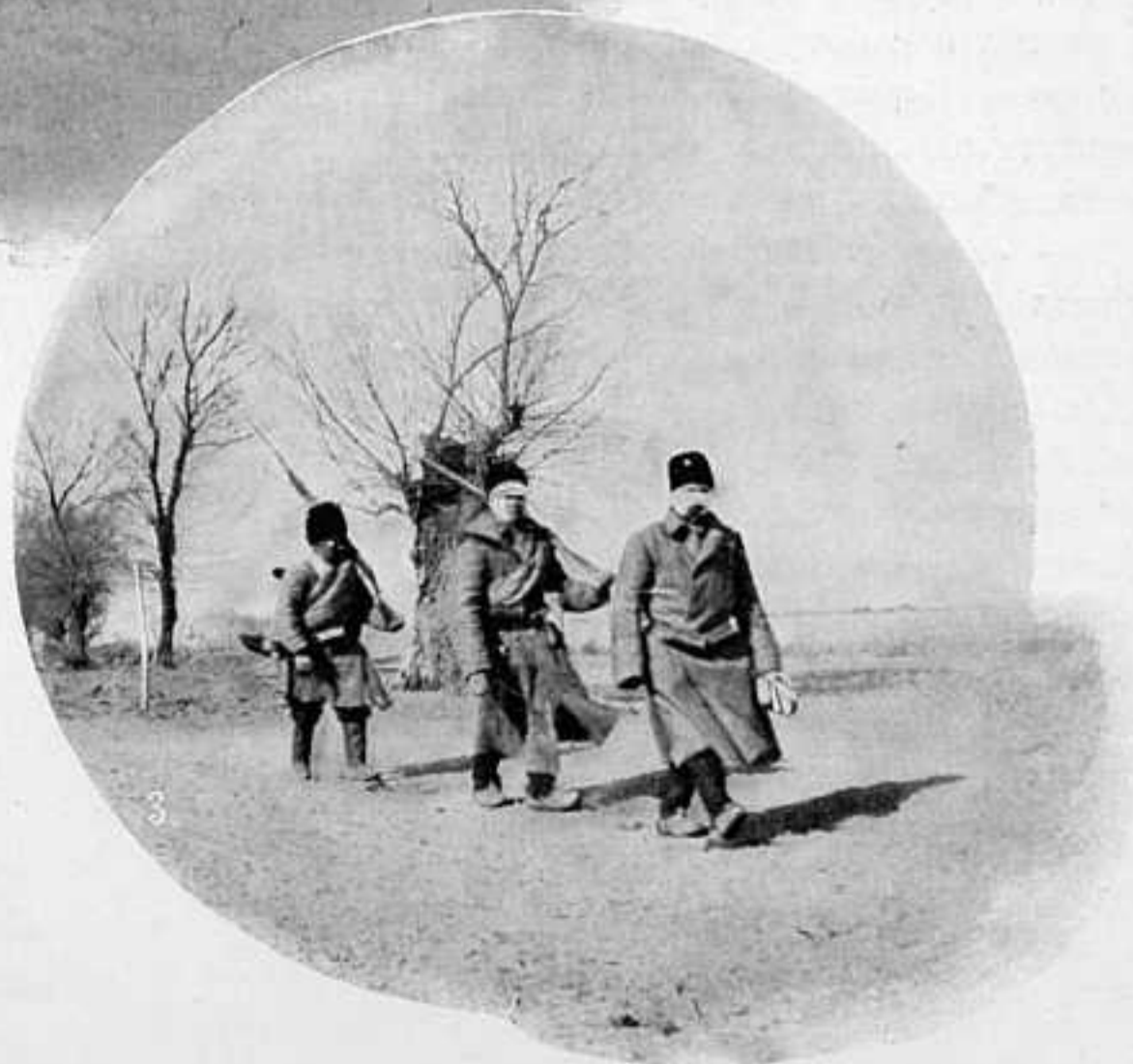
РАНЕННЫЕ 1-ГО ВОСТ.-СИБ. ЕГО ВЕЛИЧЕСТВА СТРѢЛК. ПОЛКА ПО ДОРОГѢ ИЗЪ ДЕРЕВНИ ЦУАНВАНЧЕ. ПО ФОТ. В. БУЛЛА.