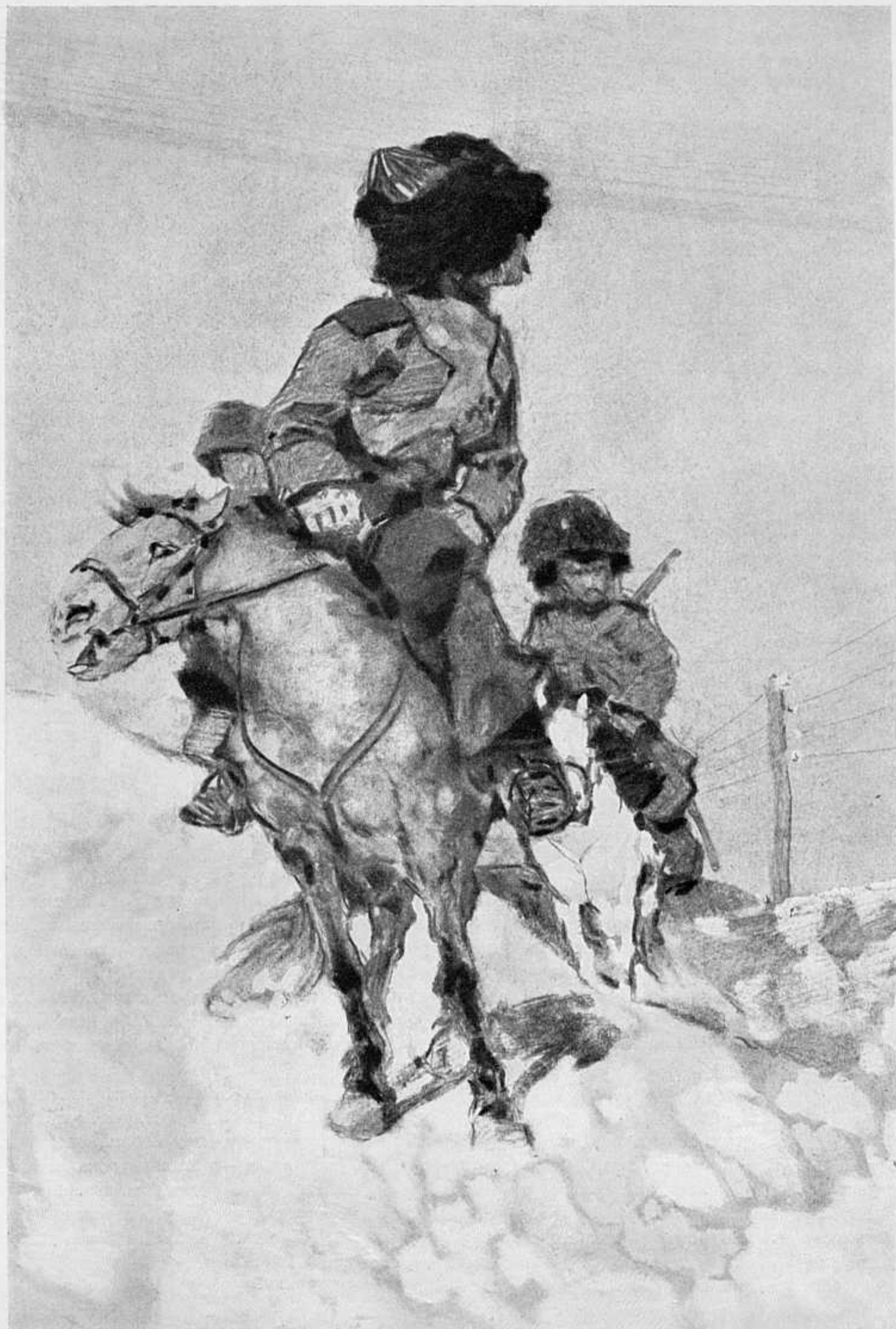
НА РАЗВЪДКЪ. РИС. ХУД. ЕЗУЧЕВСКАГО.