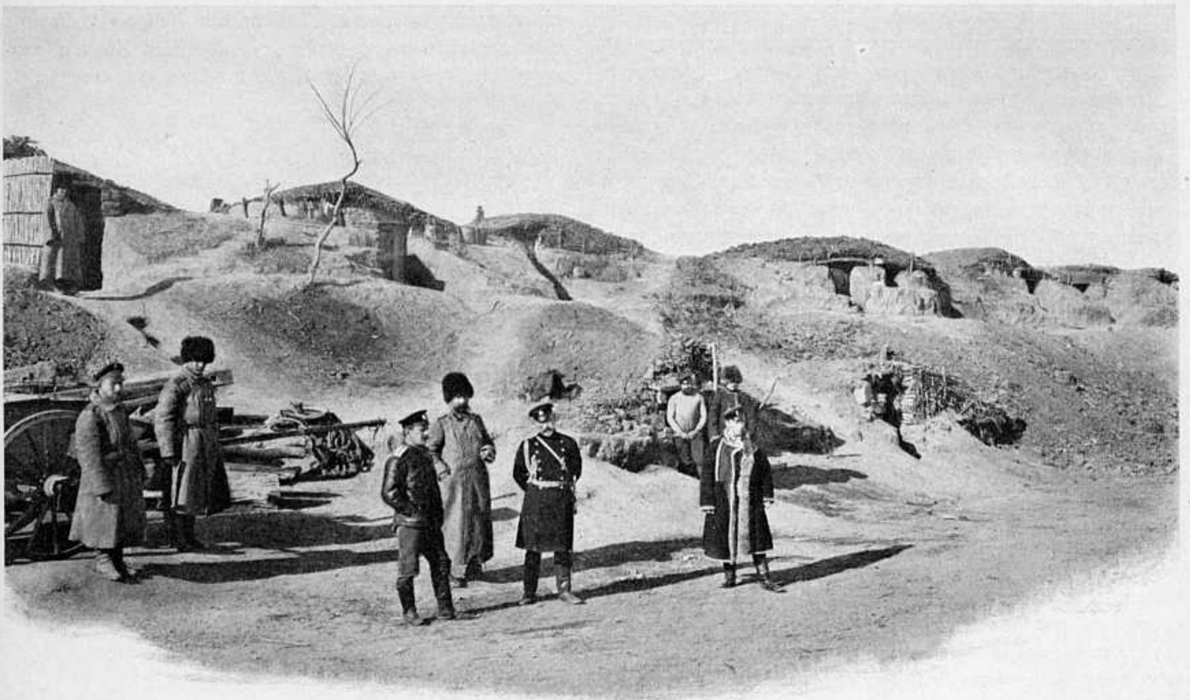
ЗЕМЛЯНКИ ОФИЦЕРОВЪ-Артиллеристовъ Близъ ПОЗИЦИ у ДЕРЕВНИ ЭРДАГОУ.