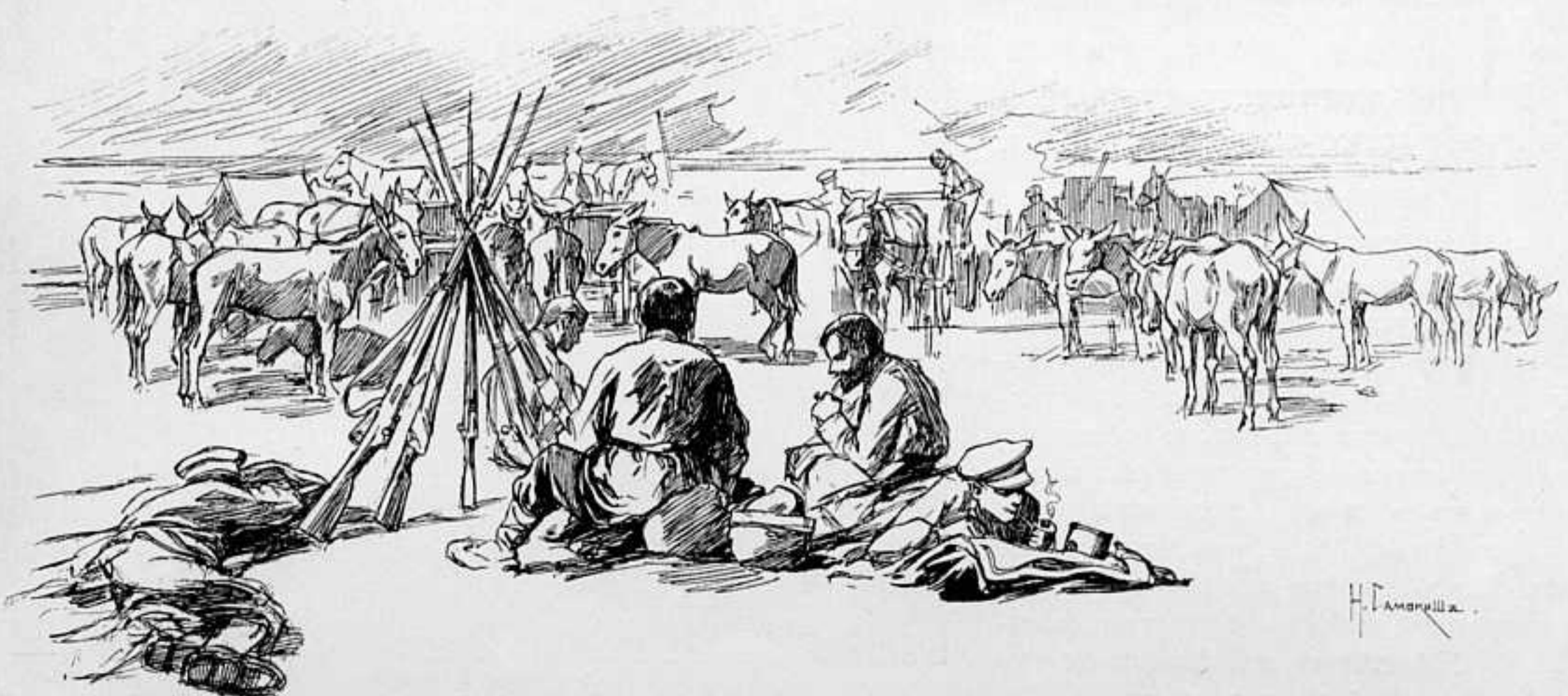
ОБОЗНЫЕ МУЛЫ У СУЛТУНЯ. РИС. АКАД. Н. САМОКИША.