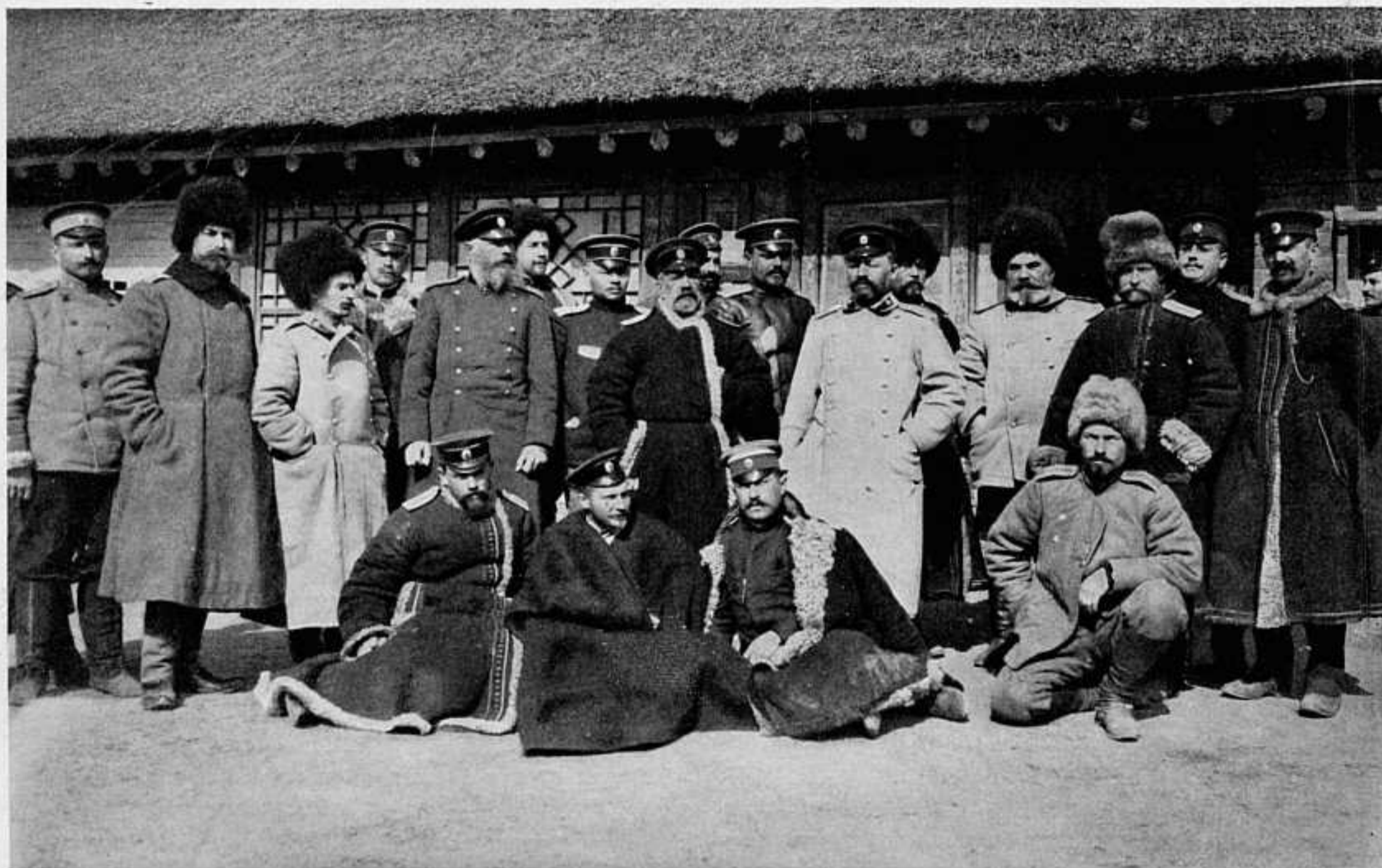
ГРУППА ЧИНОВЪ ШТАБА 8-ГО АРМЕЙСКАГО КОРПУСА.

попытки Японіи помѣшать этому черезъ посредство своихъ агентовъ. Послѣ обнаруженія доставки угля на эскадру изъ японскихъ портовъ послѣдовало распоряженіе о воспрещеніи вывоза угля изъ Японіи въ Сайгонъ, до тѣхъ поръ пока русская эскадра находится въ водахъ Индо-Китая; надняхъ задержаны японскими властями 4.500 тоннъ угля, предполагавшіяся къ отправкѣ въ этотъ портъ съ о. Кіу-сіу. Имѣются свѣдѣнія, что изъ Сайгона надняхъ вышли нѣсколько пароходовъ съ грузомъ угля для русской эскадры, что вблизи его стоитъ цѣлая флотилія рус-