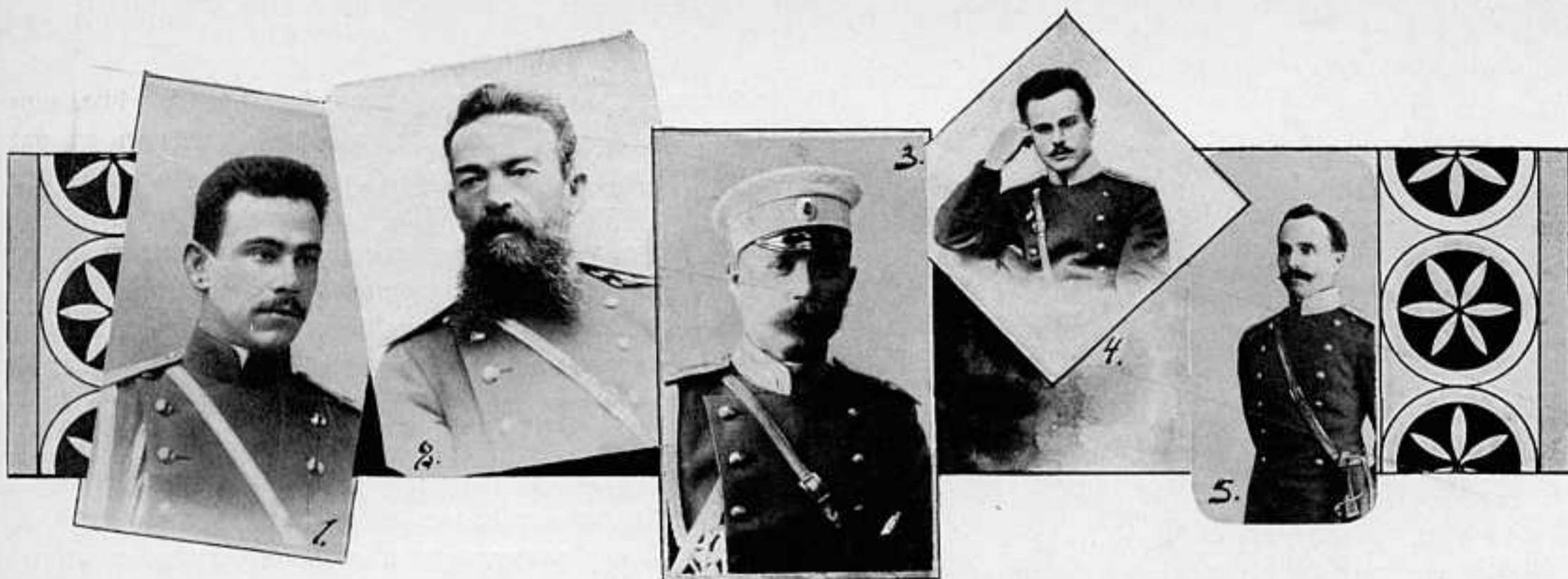
1. Подпоручикъ 4-го Восточно-Сибирскаго стрѣлковаго полка Ф. М. БОРОВСКІЙ, убитъ въ бою при деревнѣ Санделу, 14 января 1905 года. 2. Подполковникъ 34-го Восточно-Сибирскаго стрѣлковаго полка Б. У. ПЕНТКО, убитъ 29 сентября на Туманлинскомъ перевалѣ. 3. Подпоручикъ 36-го пѣх. Орловскаго полка Г. В. ГОРОДСКОЙ, убитъ подъ Ляояномъ. 4. Поручикъ 86-го пѣх. Вильманстрандскаго полка М. М. ПАПИСОВЪ, убитъ подъ Мукденомъ. 5. Поручикъ 2-го Восточно-Сибирскаго стрѣлковаго полка К. К. ИВИЦКІЙ, убитъ у Ляояна.

Продовольствіе офицеровъ находится въ дурныхъ условіяхъ, вслѣдствіе некультурности страны и крайней дороговизны припасовъ, къ которымъ офицеры привыкли въ мирное время.