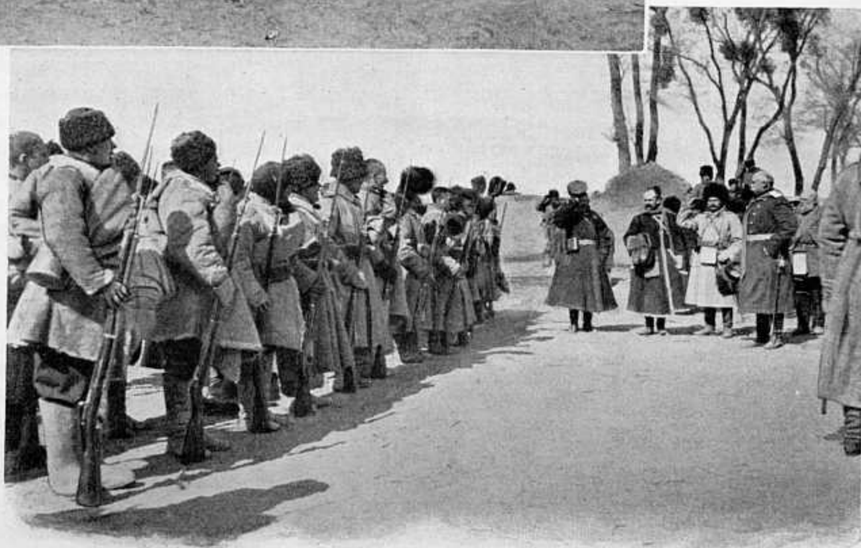
КОМАНДУЮЩІЙ 2-Й АРМІЕЙ ГЕНЕРАЛЬ КАУЛЬБАРСЪ ЗДОРОВАЕТСЯ СО СТРЕЛКАМИ.

и скудны. Настоящее и будущее приходится разгадывать по телеграммамъ различныхъ агентствъ. Онѣ утверждаютъ, что японская армія закончила свои комплектованія, что общая ея численность 350—380 тысячъ. Всѣ почти силы подтянуты впередъ къ позиціямъ, которыя укрѣплены. Въ тылу очень малые гарнизоны. Отъ Инкоу и Мукдена