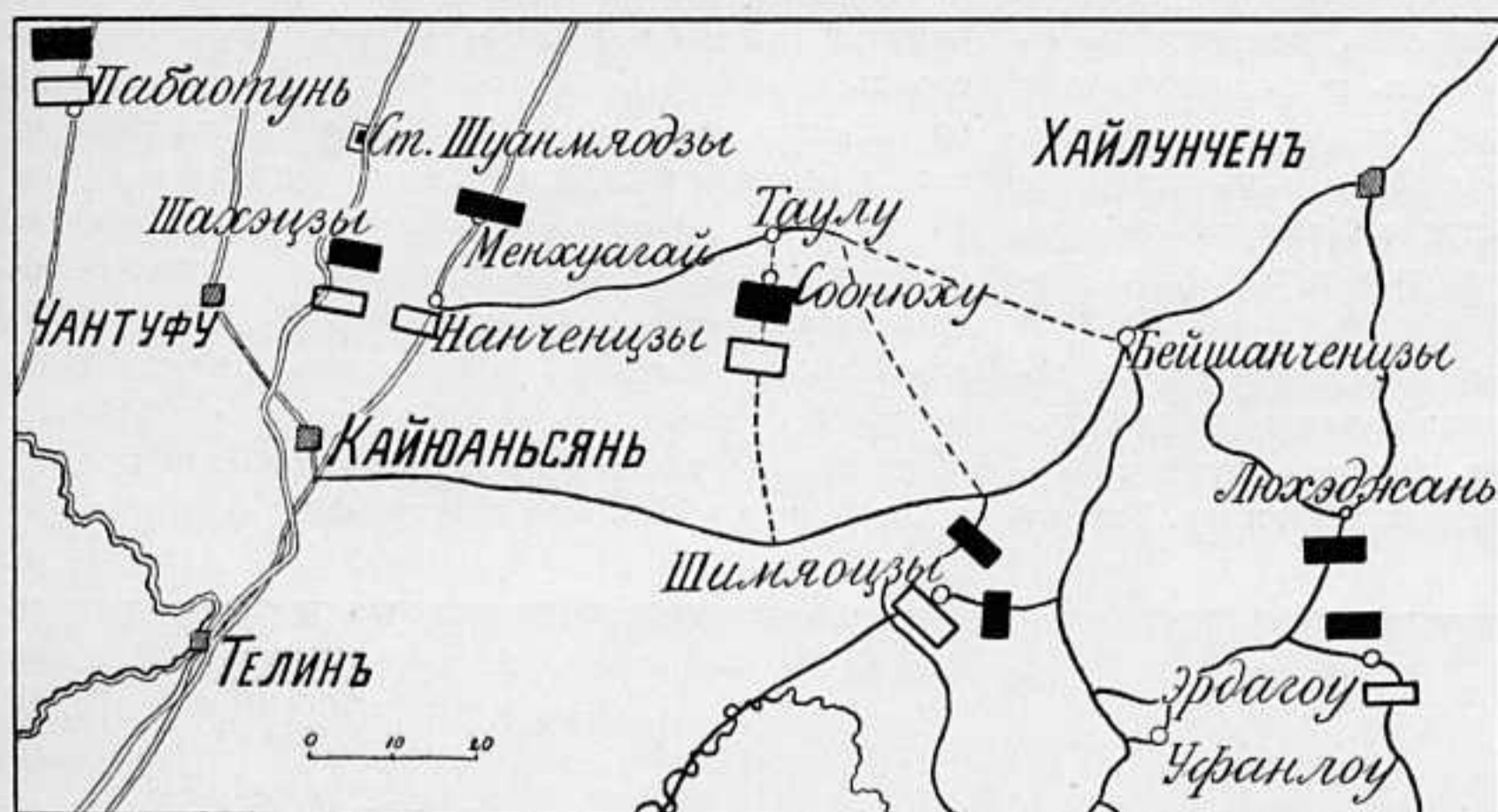
ПОЛОЖЕНІЯ ПЕРЕДОВЫХЪ ЧАСТЕЙ КЪ 8 МАЯ 1905 ГОДА.

ОФИЦІАЛЬНЫХЪ ИЗВѢСТІЙ ПОЛУЧЕНО МАЛО, ВЪ НИХЪ ГОВОРІТСЯ ЛИШЬ О НЕБОЛЬШИХЪ СТЫЧКАХЪ ПЕРЕДОВЫХЪ ЧАСТЕЙ; ПОСЛѢДСТВІЙ ОНѢ НЕ ИМѢЛИ.