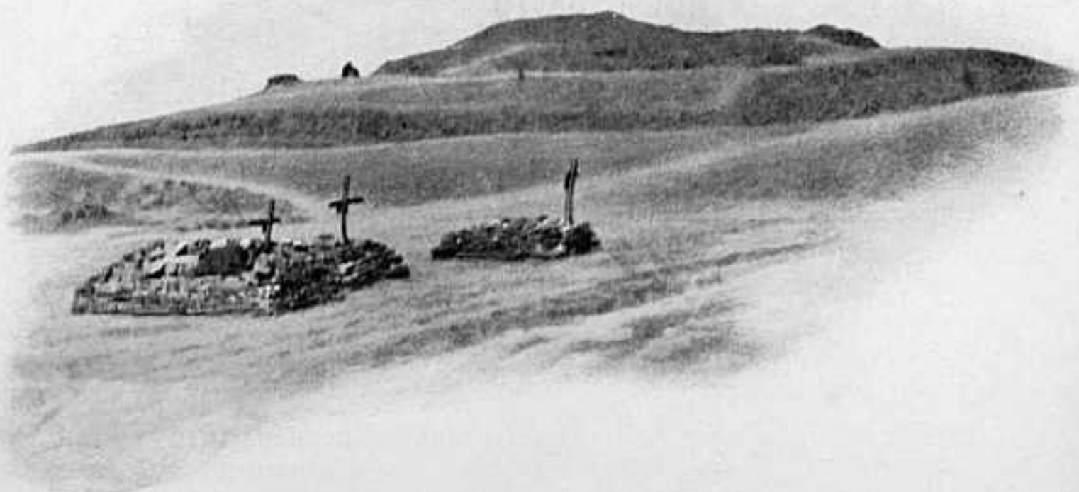
БРАТСКАЯ МОГИЛА НА ПУТИЛОВСКОЙ СОПКѢ.

Неблагопріятнымъ обстоятельствомъ является большая трата продовольственныхъ и фуражныхъ припасовъ при отступленіяхъ, при чемъ нерѣдко чины интендантства уничтожали припасы, отказывая въ выдачѣ ихъ нуждающимся войскамъ. Вредное вліяніе на боевую численность войскъ оказывало отвлеченіе большого числа людей на хозяйственныя дѣла. Наконецъ, война показала, что принятая у насъ отчетность по хозяйству изобилуетъ формальностями, выполненіе которыхъ вредитъ дѣлу и причиняетъ большія затрудненія командному составу.