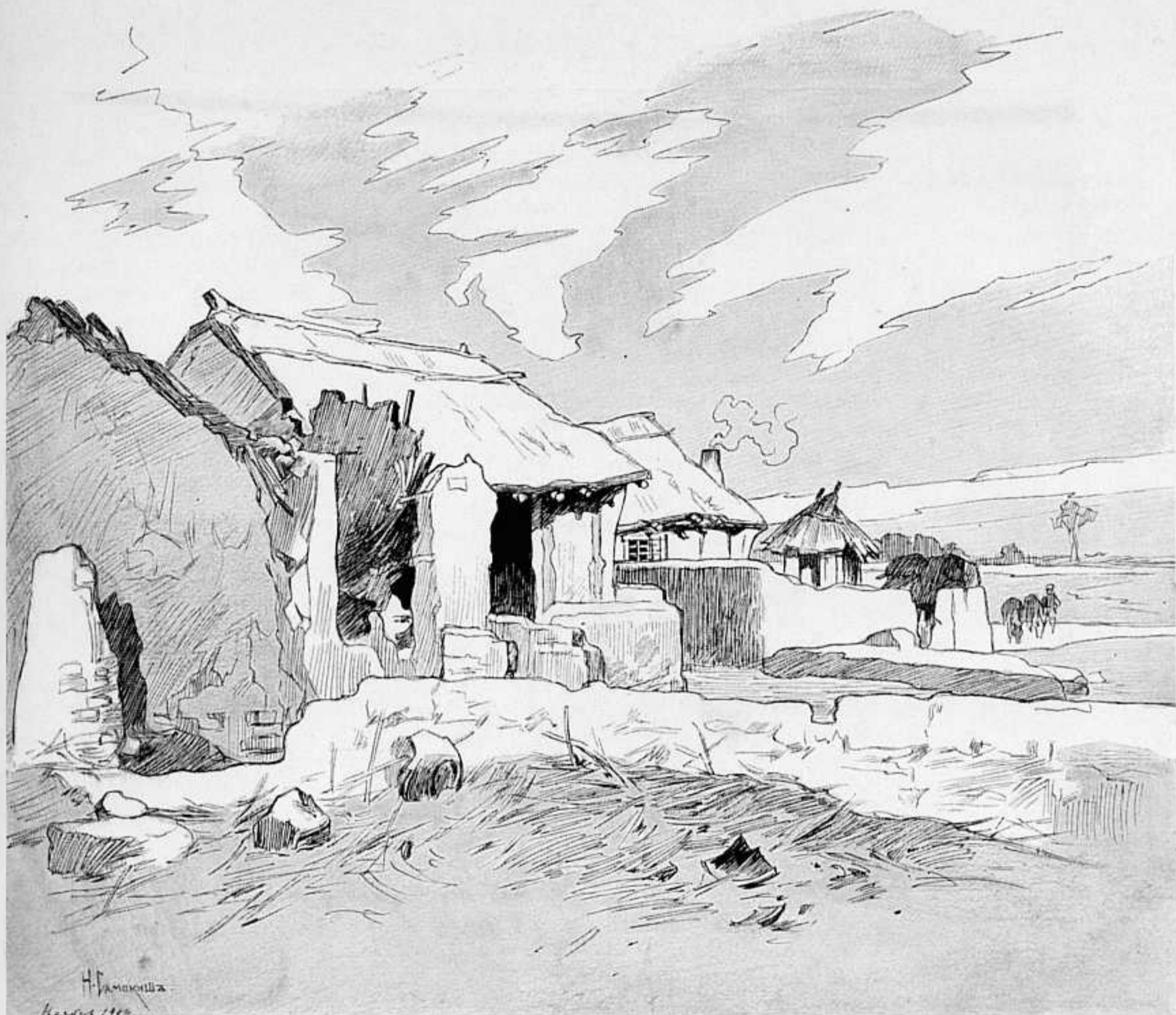
ДЕРЕВНЯ ГУДЗЯДЗЫ. РИС. АКАД. Н. САМОКИША.

наши батареи должны, какъ говорятъ, открыть огонь, на что японцы, конечно, будутъ отвѣчать. Громъ будетъ ужасный и по всей вѣроятности не мало будетъ смертей. Понятно, рано или поздно побѣда останется за нами, но сколькихъ людскихъ жертвъ это будетъ стоить—одному Богу извѣстно. Позиціи у непріятеля сильныя—на горахъ, которыя онъ облилъ водой. Вотъ тутъ и влѣзь на нее!..