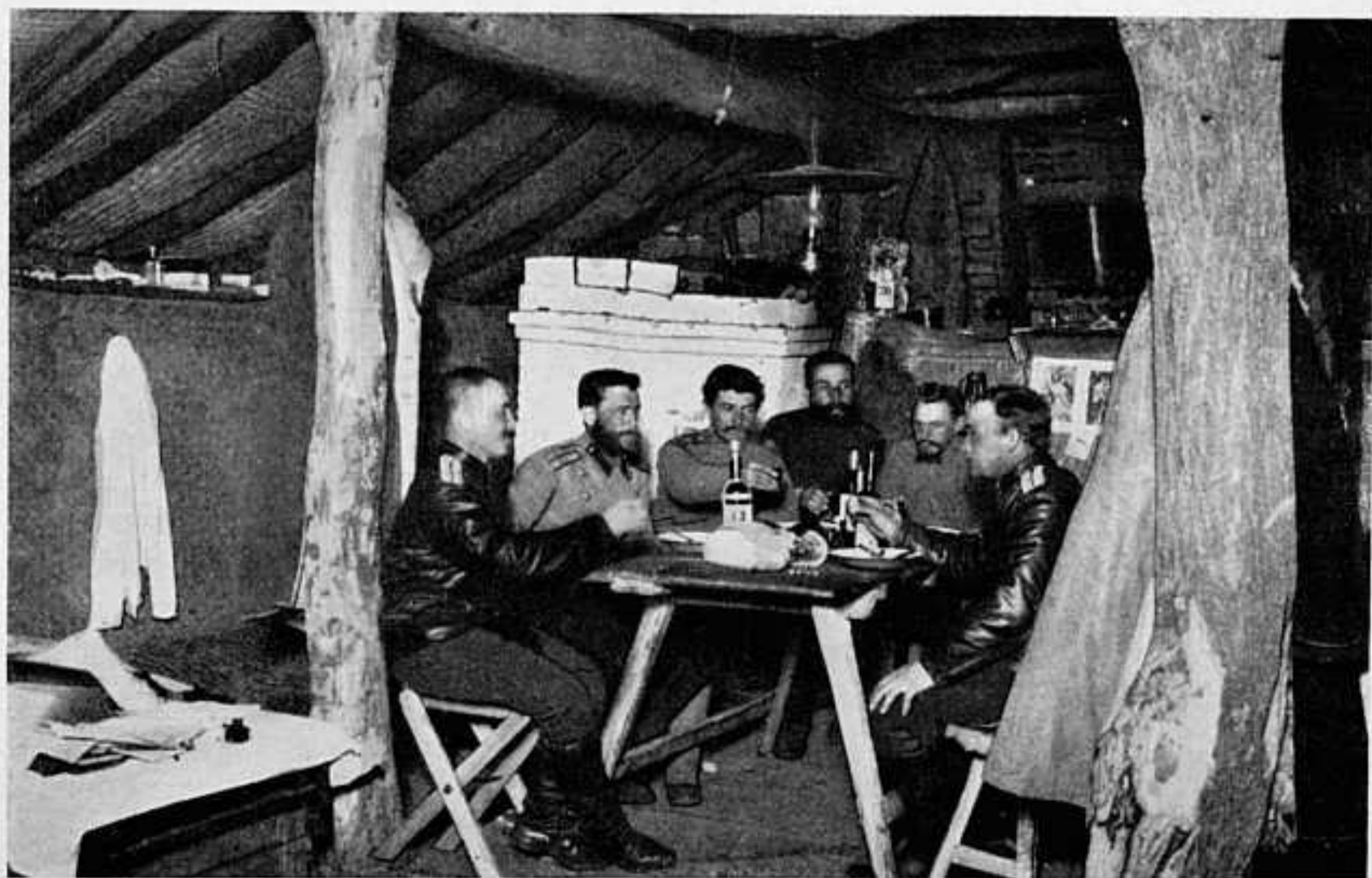
ВНУТРЕННИЙ ВИДЪ ЗЕМЛЯНКИ ОФИЦЕРОВЪ БАРНАУЛЬСКАГО ПОЛКА.