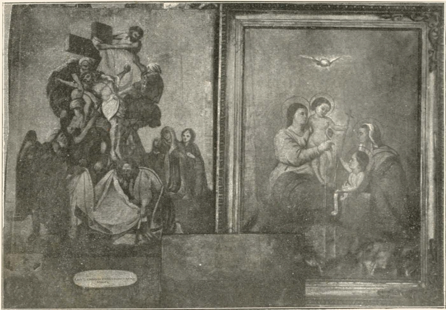
„Снятіє со Креста“ и „Мадонна“

въ церкви Рождества пр. Богородицы въ с. Боромль, Ахтырскаго уѣз., Харьковск. губ.