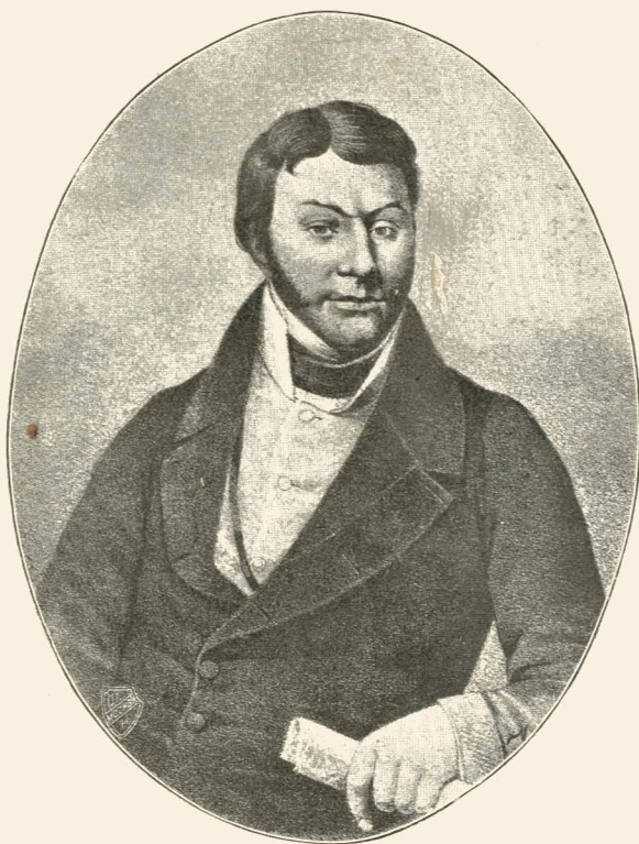
Григорій Федорович Квитка-Основьяненко. (р. въ 1778 въ Основѣ, † 1843).