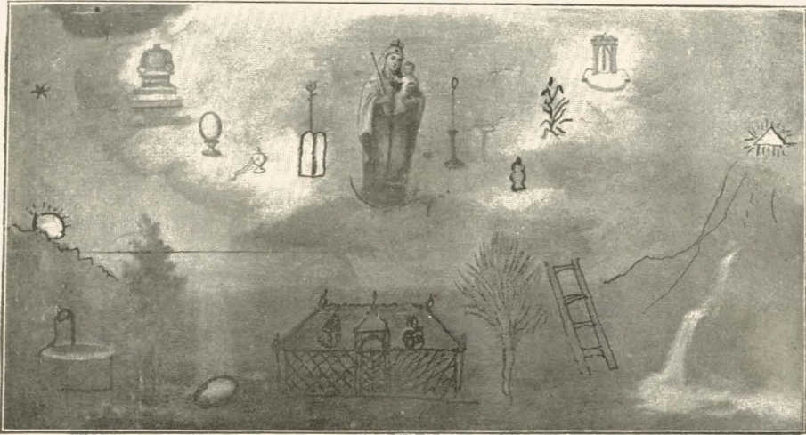
Акаѳистная икона пр. Богородицы въ церкви Рождества пр. Богородицы въ с. Боромла, Ахтырскаго уѣз., Харьковск. губ.

Принадлежит Киевской Городской Народ- ной бесплатной читальне имени Н. В. ГОГОЛЯ и продана быть не может