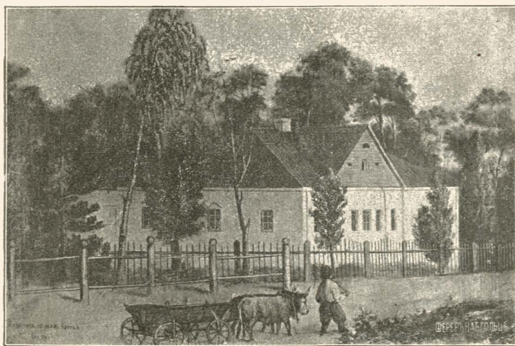
Будынокъ де живъ Квитка на Основѣ.