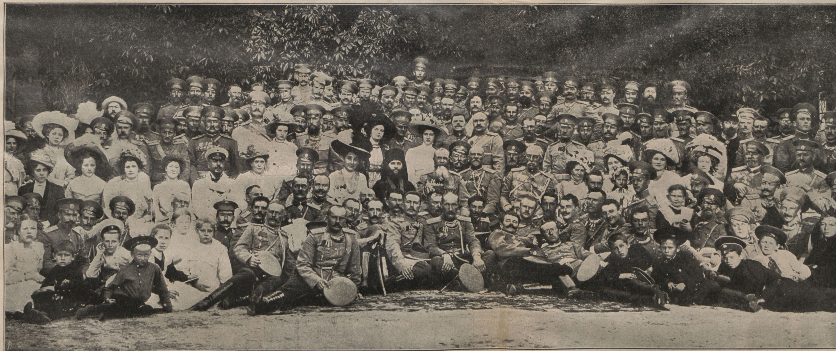
Группа офицеровъ съ почетными гостями. Въ серединѣ командующій войсками ген.-ад. Н. І. Ивановъ.

тепломъ. Отъ этого теплаго молодого смѣха съежился и уползъ сѣрый сумракъ, теряясь за могильными холмами. Солнце зарумянило блѣдную кожу на блѣдномъ лицѣ. Оно любовно задѣло розовое ухо и прядь прекрасныхъ волосъ... Озаренная золотыми лучами женщина казалась скорбящей о безвозвратно покинувшихъ