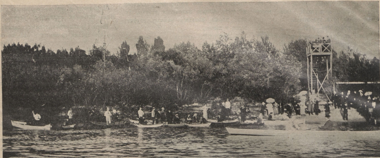
Передъ юбилейными гонками.