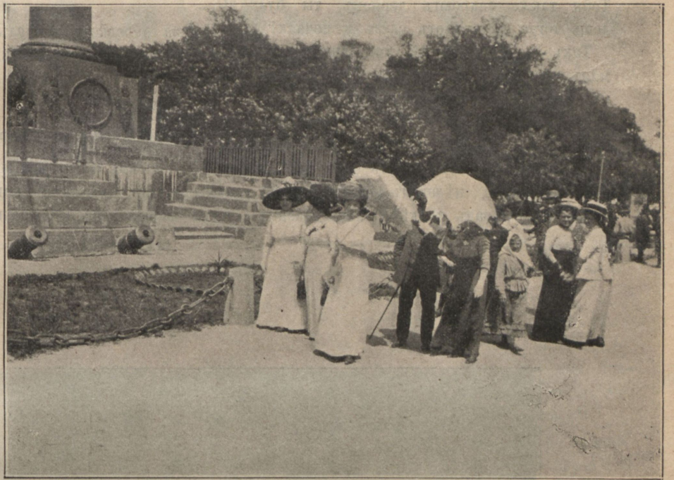
Продажа цвѣтка у памятника „Побѣды“.