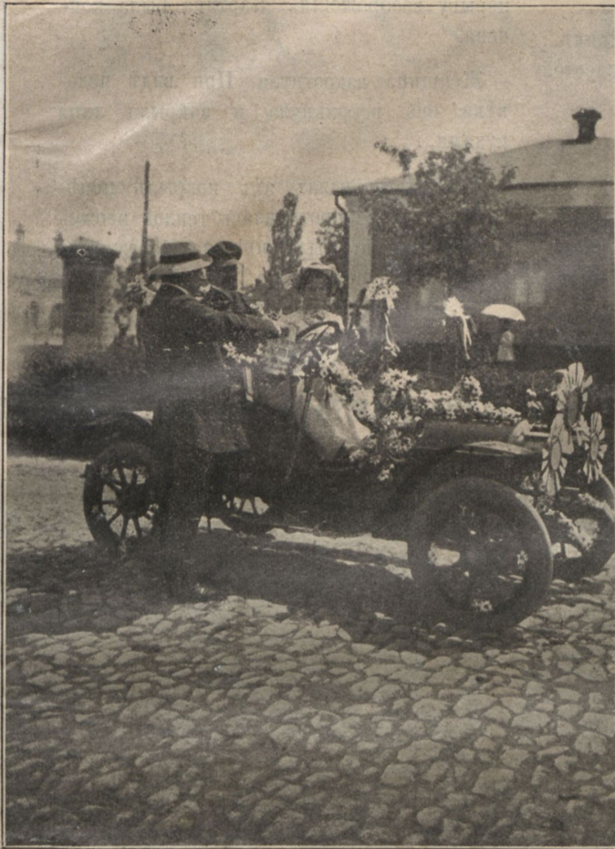
Автомобиль гр. Капниста.