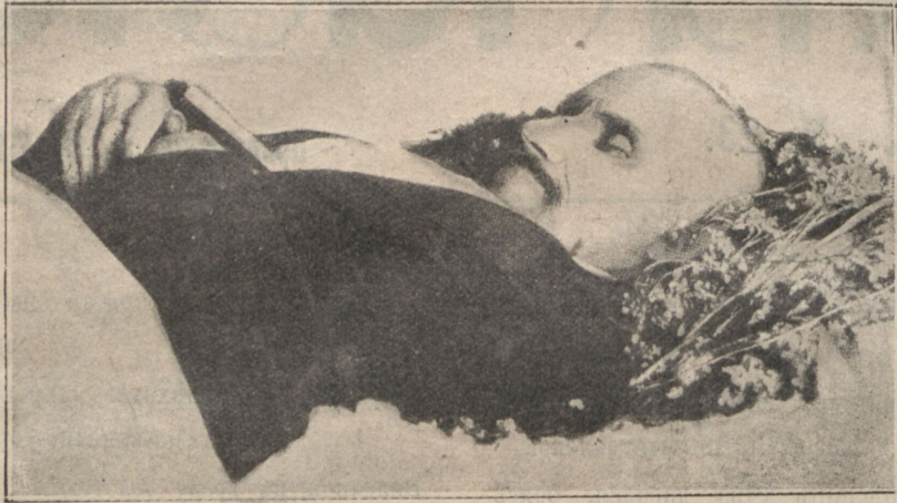
К. М. Фофановъ на смертномъ одрѣ