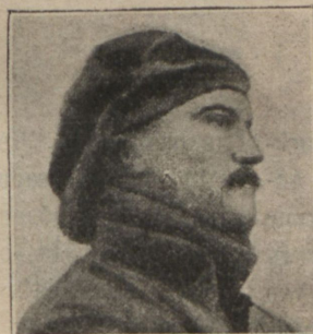
Авиаторъ Ведринъ, побѣдитель на перелетѣ Парижъ— Мадридъ.