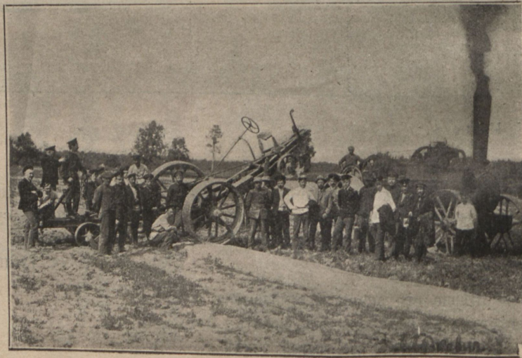
Работа съ паровымъ плугомъ.