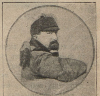
Авиаторъ Бомонъ, побѣдитель на перелетѣ Парижъ— Римъ.