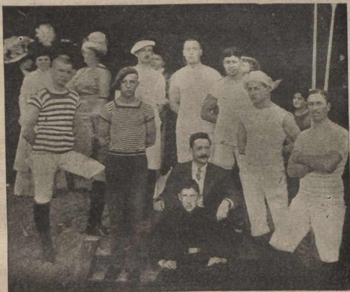
Участники юбилейныхъ гонокъ.